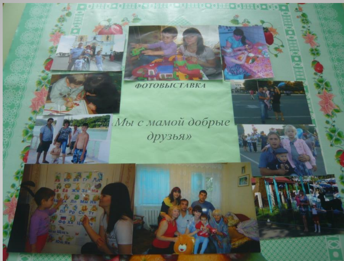
Фотовыставка «Мы с мамой добрые друзья»