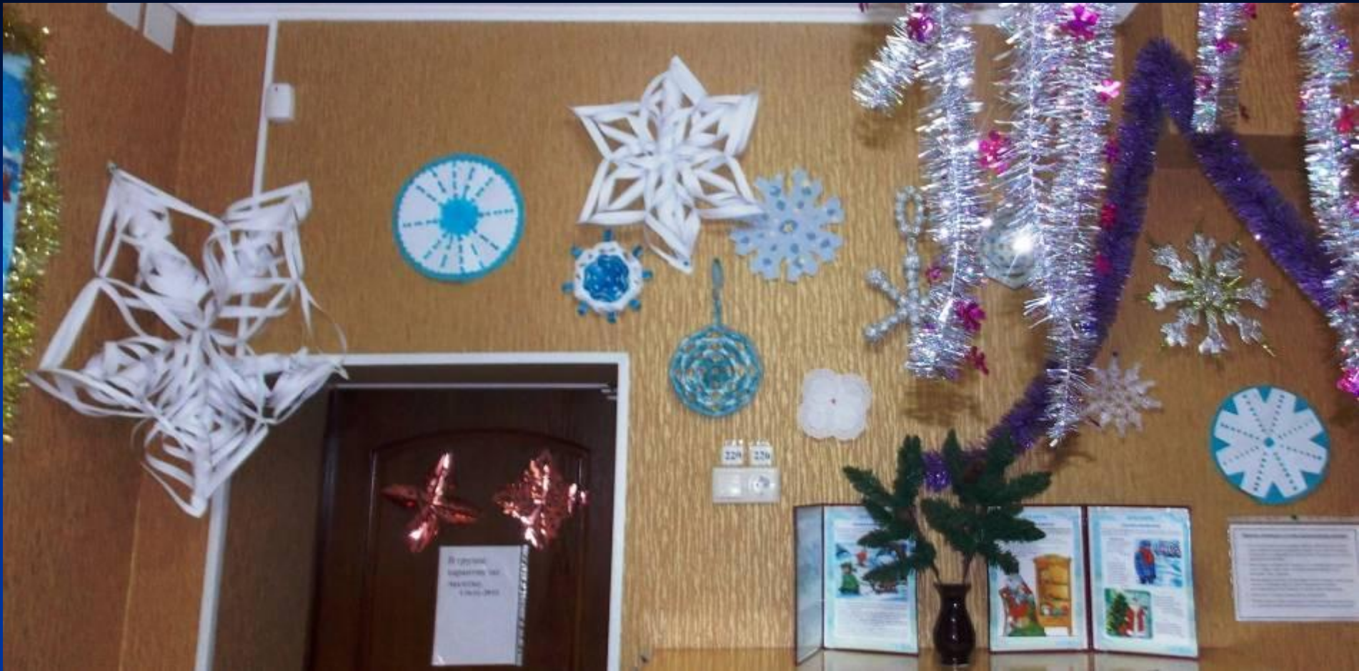
Оформление выставки снежинок в раздевальной комнате