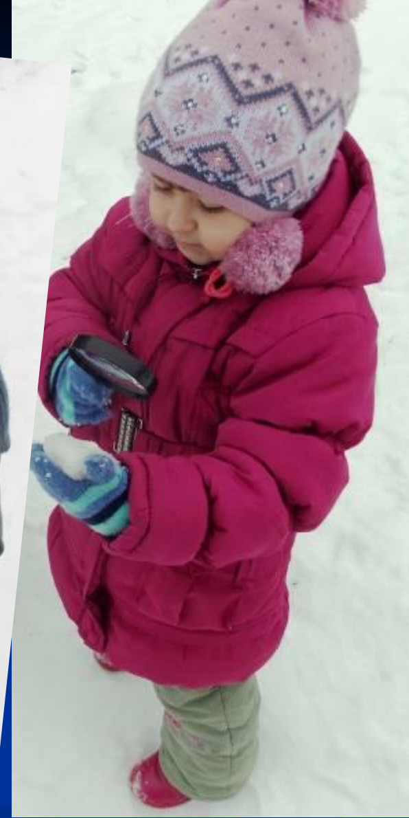
Рассматривание снежинок через лупу