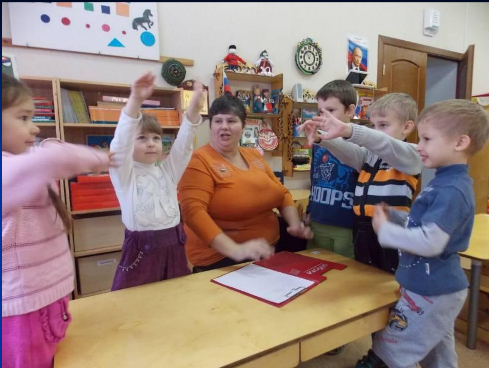
Составление рассказа о снежинке