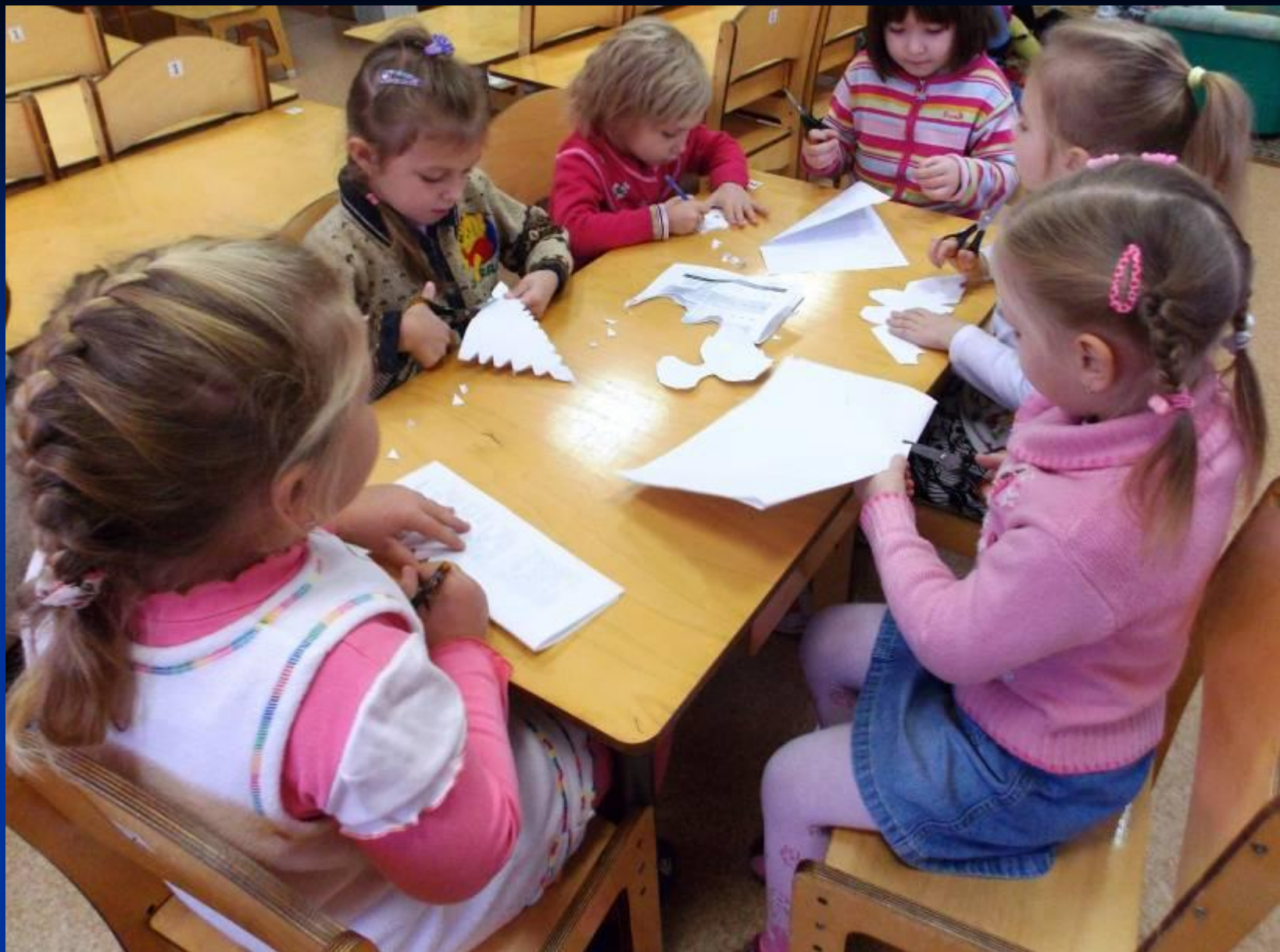
Самостоятельное вырезание снежинок