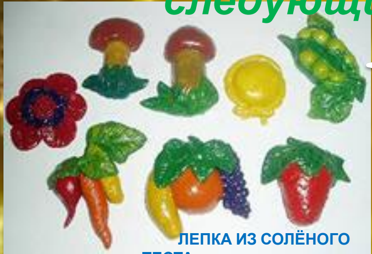
ЛЕПКА ИЗ СОЛЁНОГО ТЕСТА