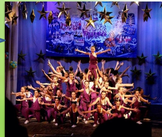
В СТИЛЕ ДЖАЗ-МОДЕРН