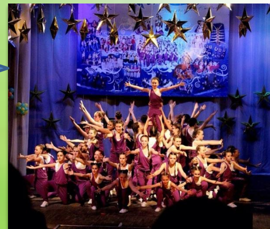
В СТИЛЕ ДЖАЗ-МОДЕРН