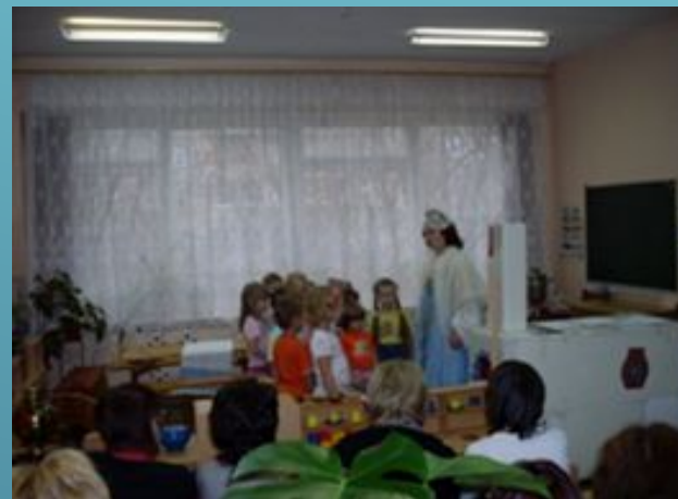
День открытых дверей