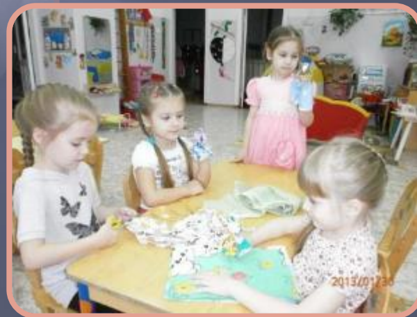
Изготовление кукол – оберегов - Кувадок