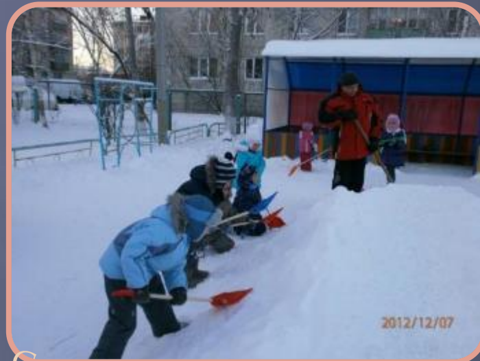
Сооружение горки (совместно с родителями)