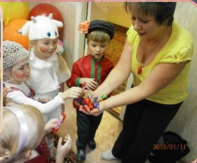
Новый год, Святочные гадания