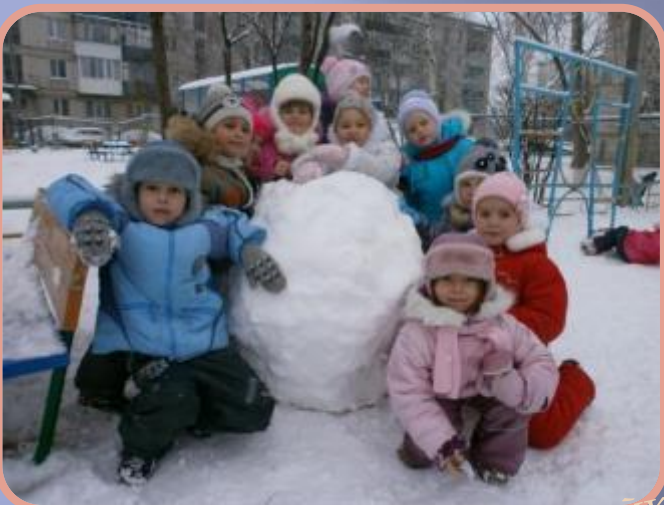
Снежные комья для постройки крепости, лепки Снеговика