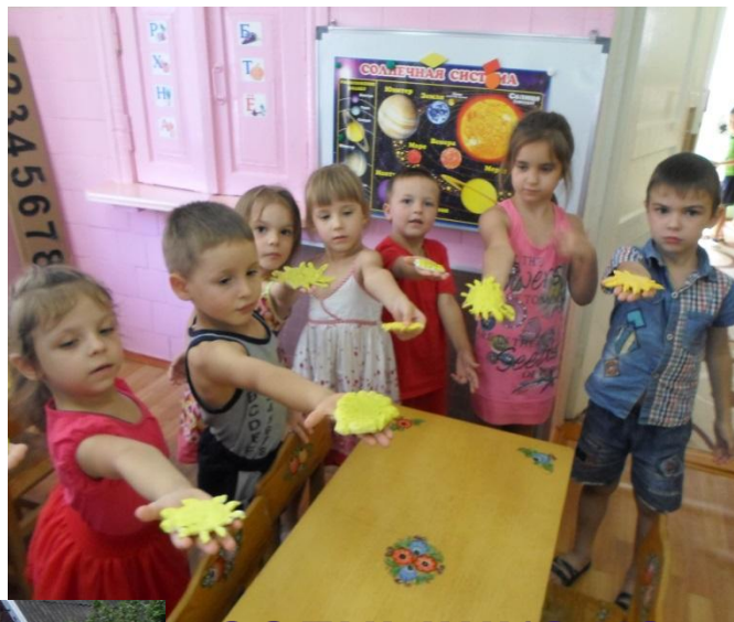
СОЛНЫШКО ИЗ СОЛЕНОГО ТЕСТА