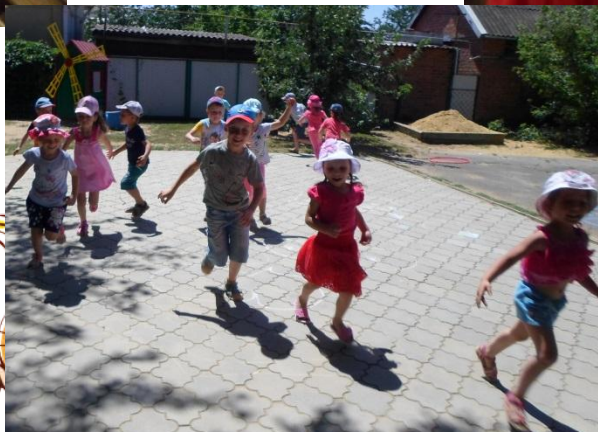
ИГРА «АИСТЫ И ЛЯГУШКИ»