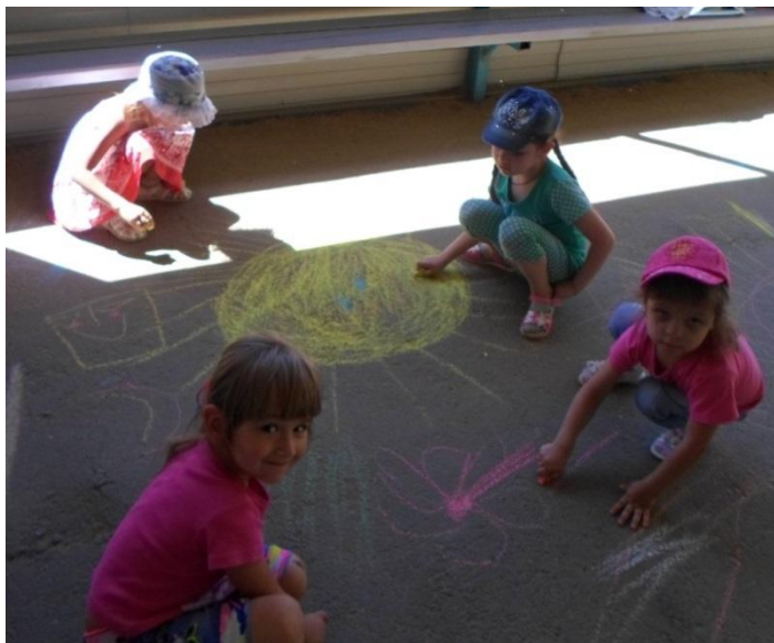
КОНКУРС РИСУНКОВ НА АСФАЛЬТЕ