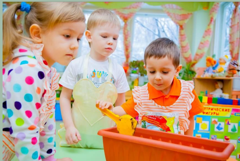
Готовим грунт для посадки семян