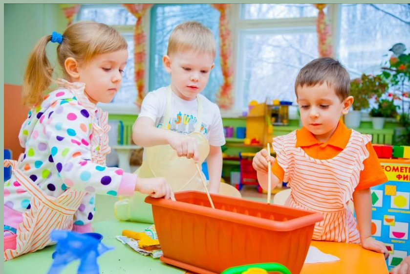
Проводим посадку семян