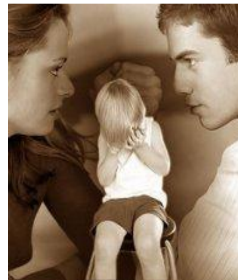
Негативное отношения в семье