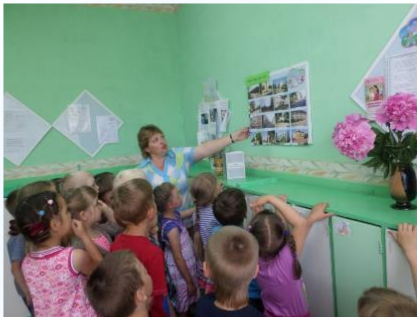
Фотовыставка «Моя улица, мой дом»