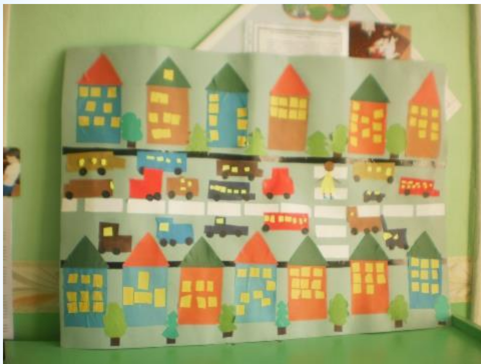
Аппликация «Улица нашего города» (коллективная работа)