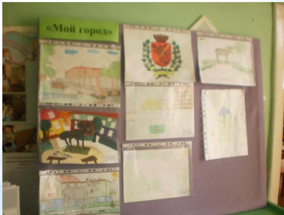
Выставка рисунков «Мой город» Лучшие работы отобраны на муниципальный конкурс творческих работ к 290-летию Гусева