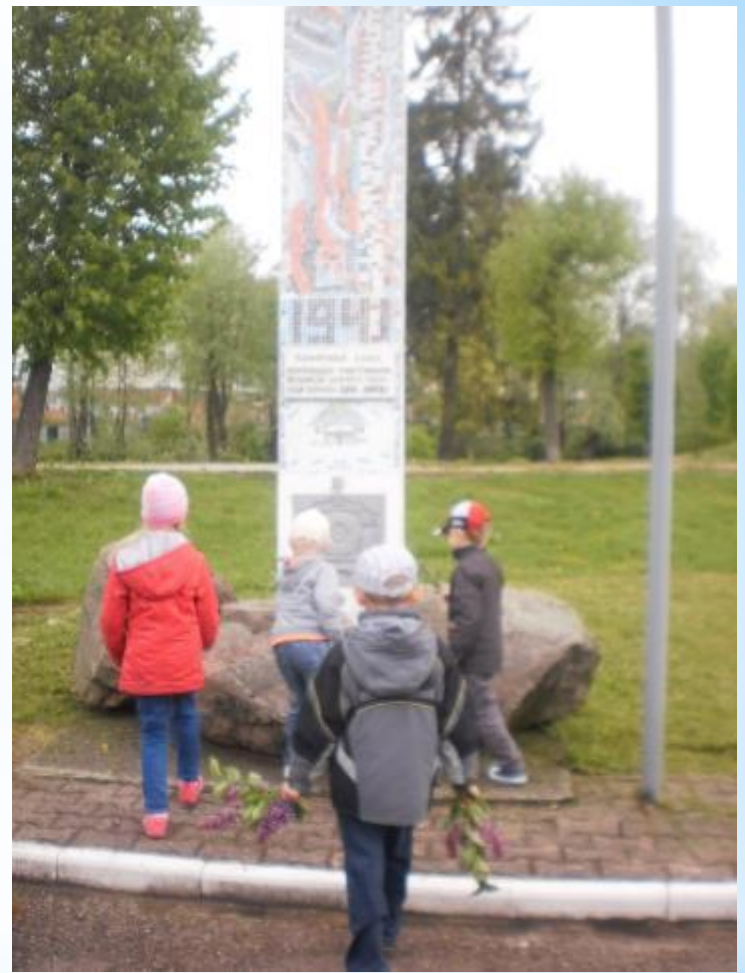
Аллея Славы - ул. Зои Космодемьянской - возложение цветов