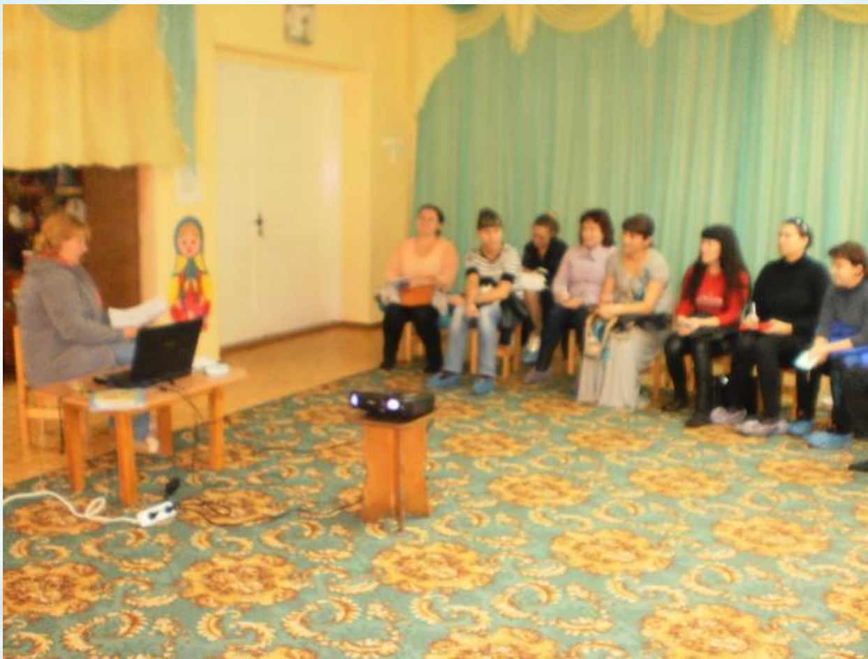
Презентация проекта «Улицы нашего города» на родительском собрании