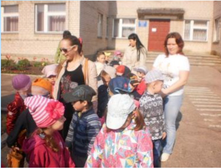
Экскурсия на ул.Московскую в краеведческий музей