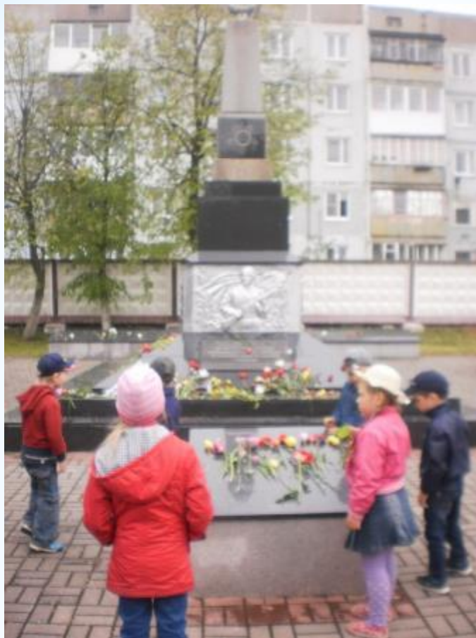
Братская могила - ул. Юрия Смирнова