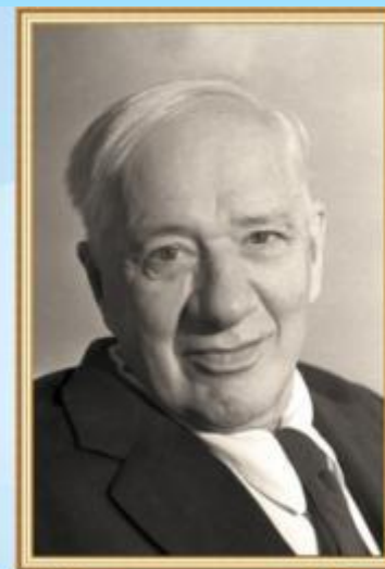
Корней Иванович Чуковский