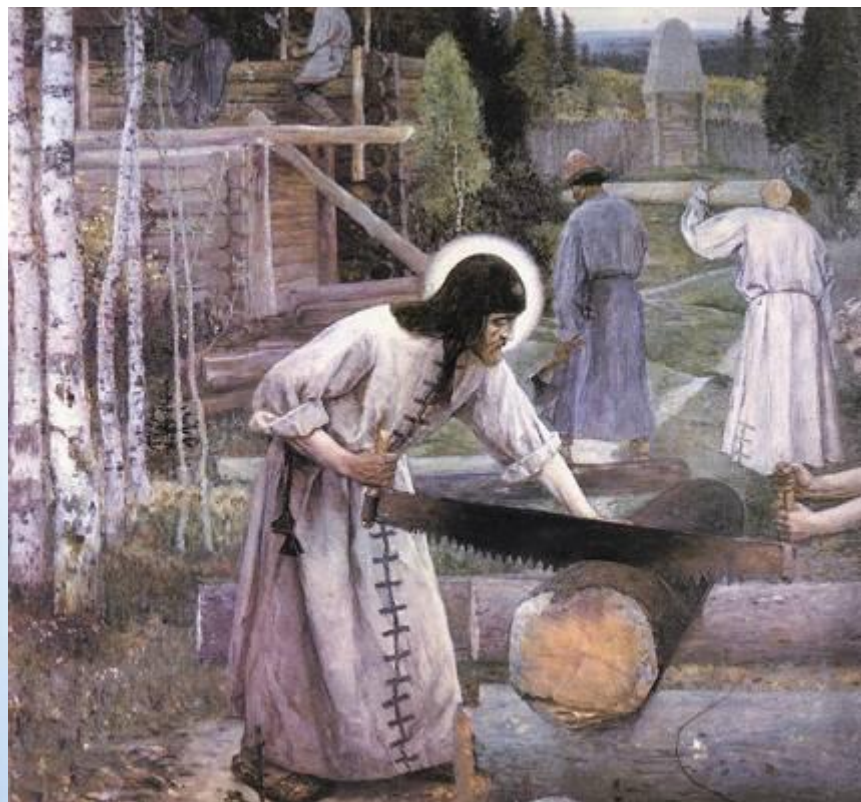
Сергий Радонежский на строительстве храма