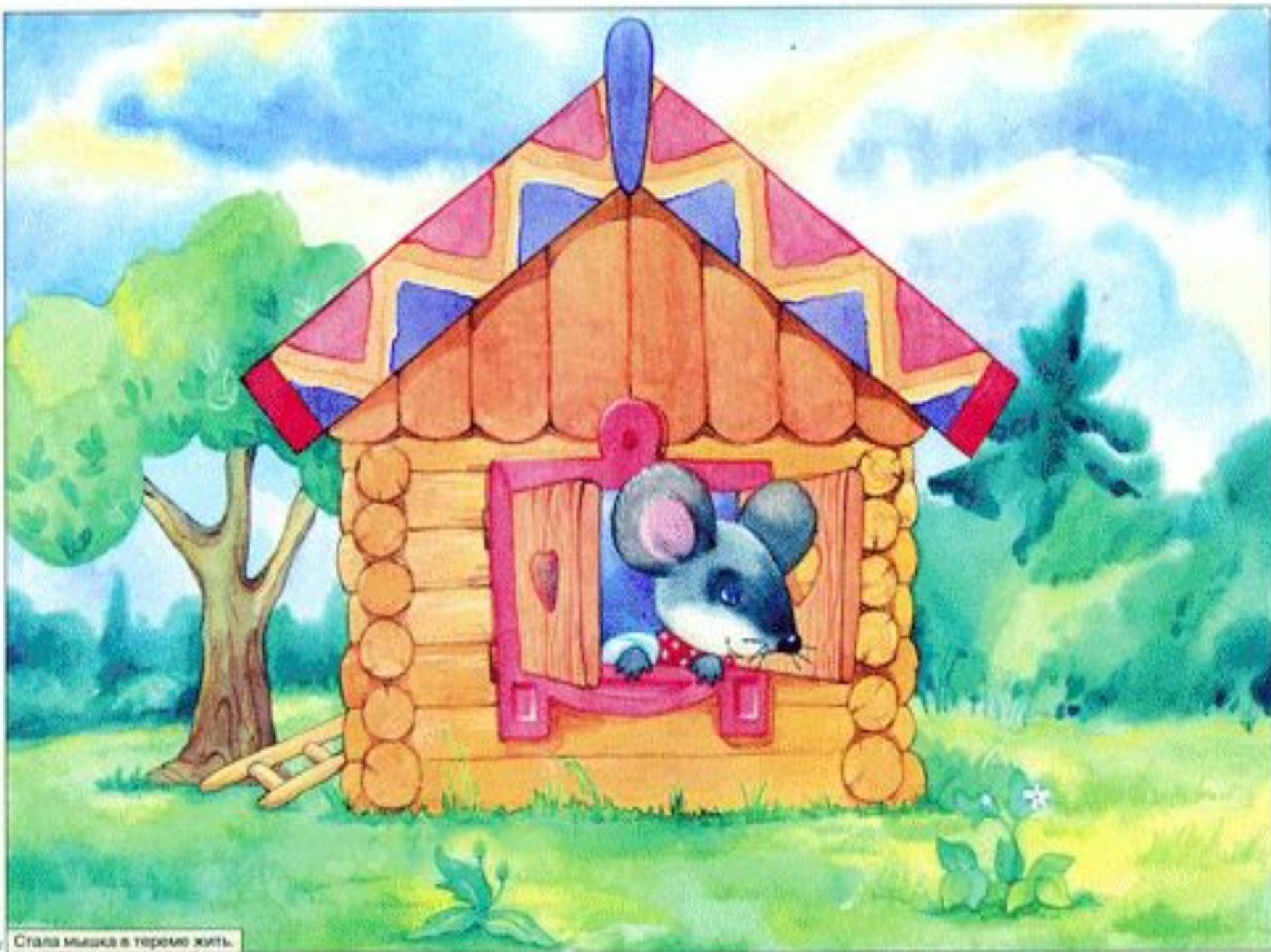
Стала мишка в тереме жить.