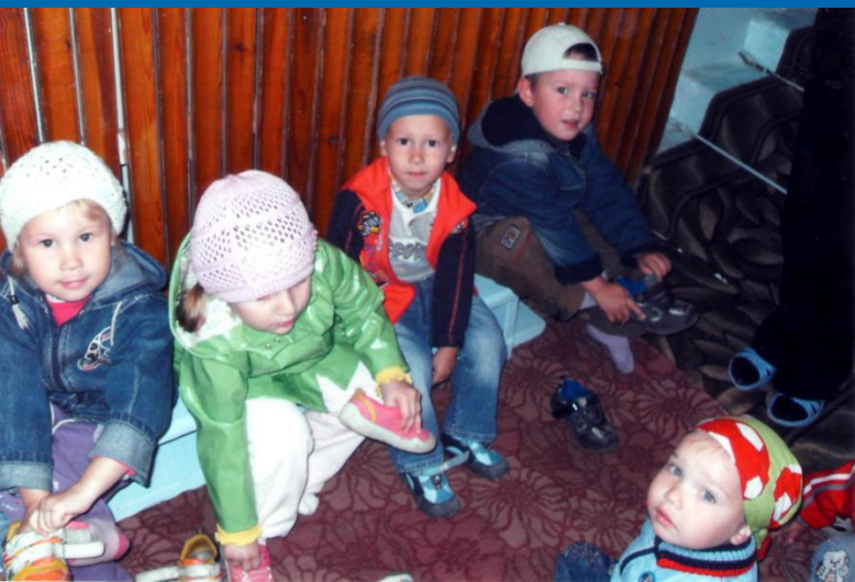
Одеваемся на прогулку