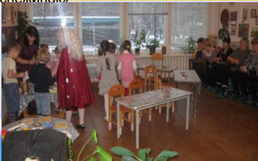
Открытый показ организации творческой деятельности детей в рамках методического объединения