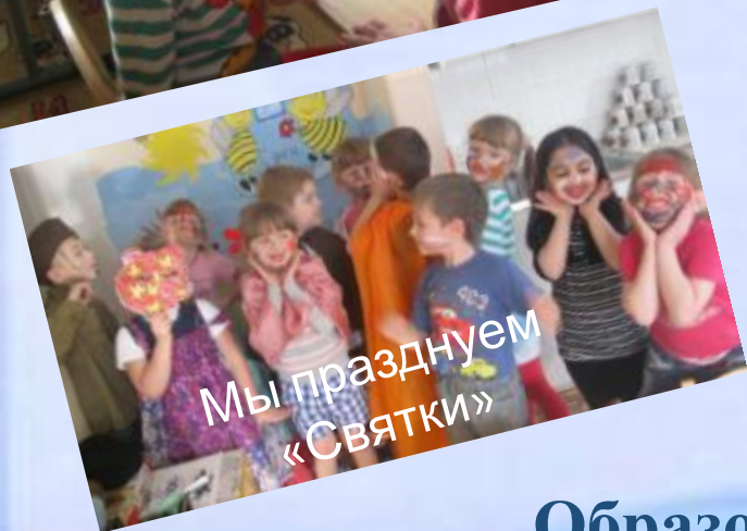
Мы празднуем «Святки»