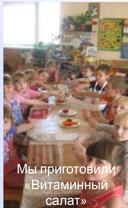
Мы приготовили «Витаминный салат»