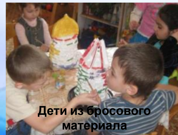
Дети из бросового материала сконструировали Башни