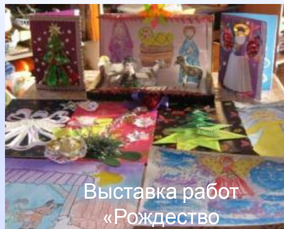
Выставка работ «Рождество Христово»