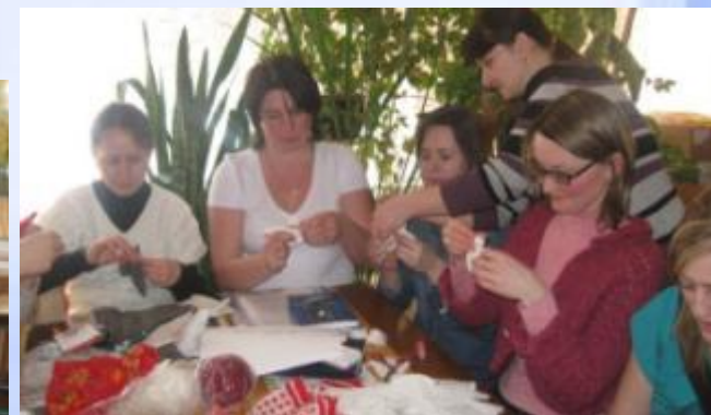
Мастер класс для педагогов ДОУ «Народная игрушка»