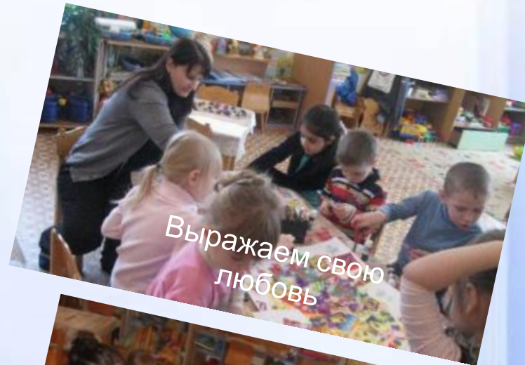
Выражаем свою любовь