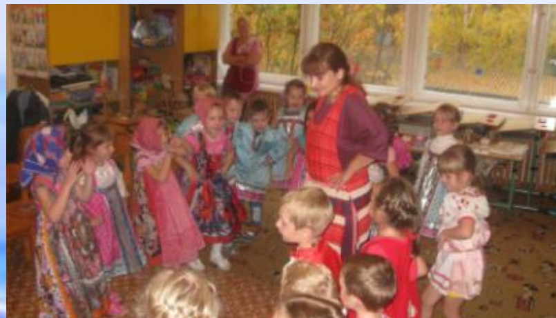
Импровизируем танец на праздновании Ярмарки