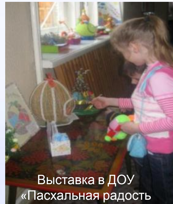
Выставка в ДОУ «Пасхальная радость»