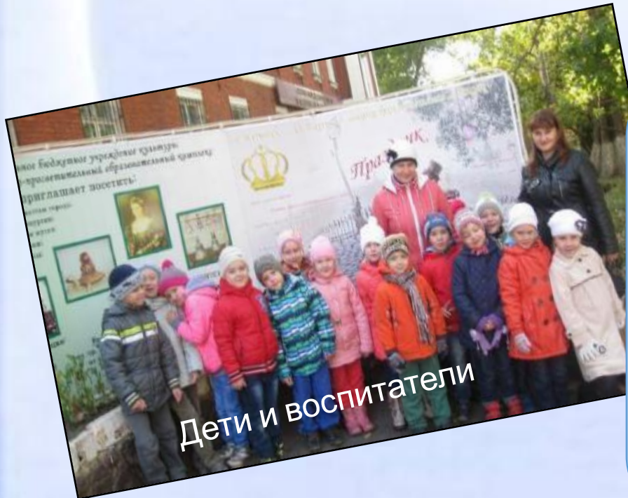
Дети и воспитатели