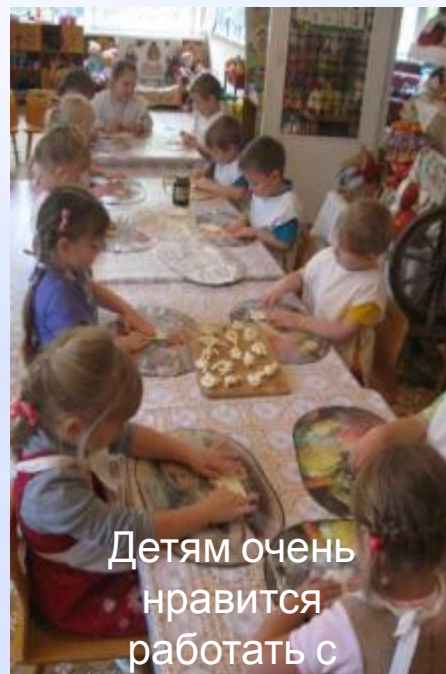
Детям очень нравится работать с тестом