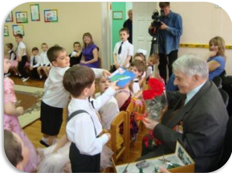
Встреча с ветераном

Приобщение детей к социокультурным нормам, традициям семьи, общества и государства