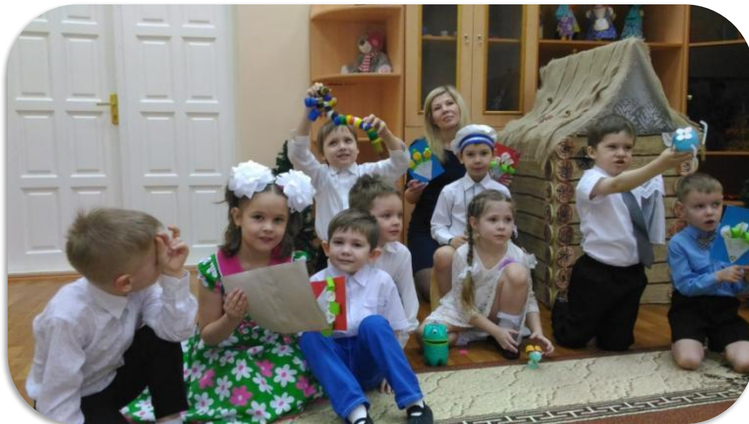
Развлечение «8 Марта»

Создание благоприятных условий развития детей в соответствии с их возрастными и индивидуальными особенностями, развитие способностей и творческого потенциала каждого ребёнка как субъекта отношений с самим собой, другими детьми и взрослыми