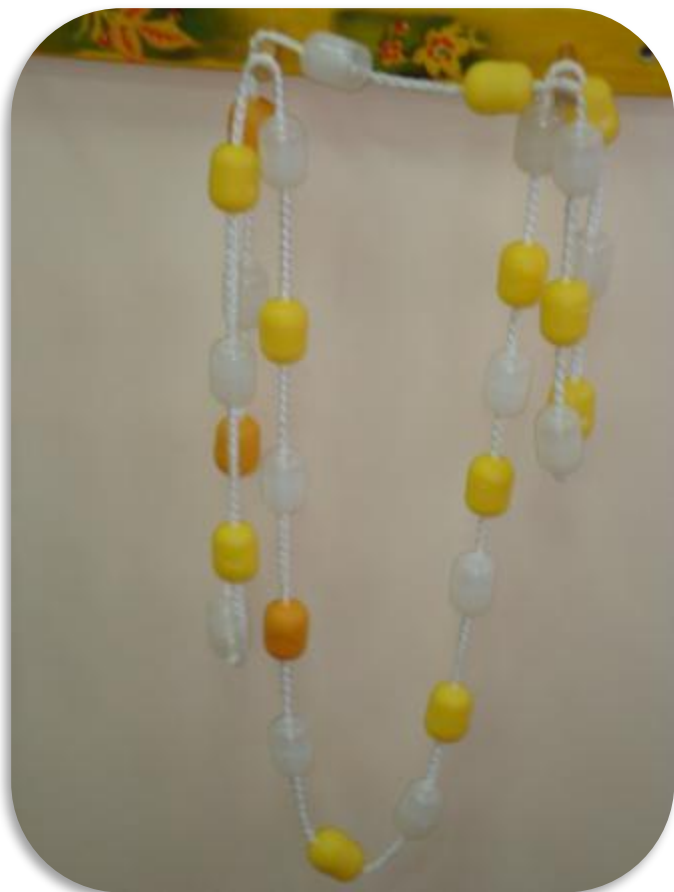
Музыкальная игра «Круг»