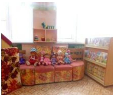
Развивающая предметно-пространственная среда второй группы раннего возраста