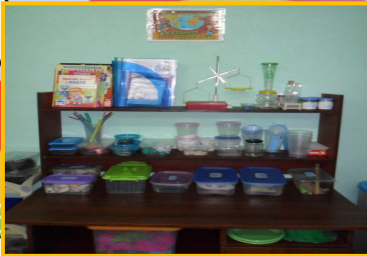
Лаборатория маленький исследователь