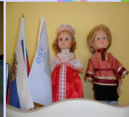
Нравственно – патриотический центр