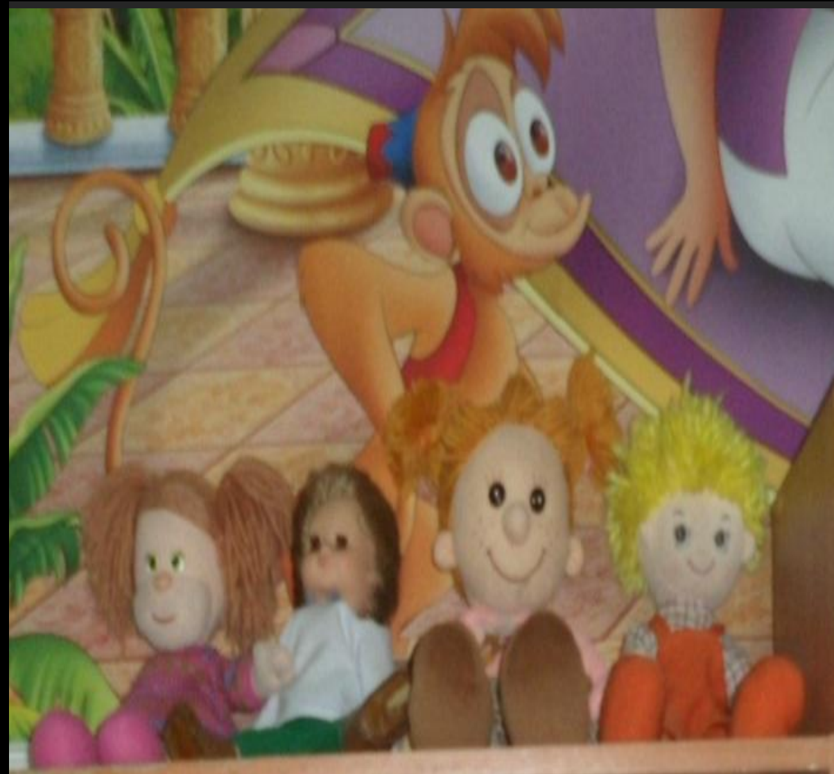
Гендерное воспитание «Дом, семья, куклы»