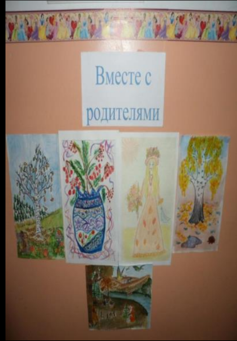
Обратная связь с родителями