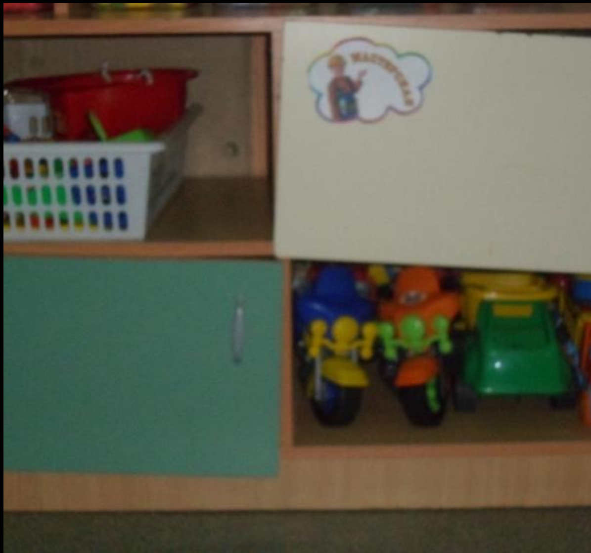
Гендерное воспитание «Мастерская»