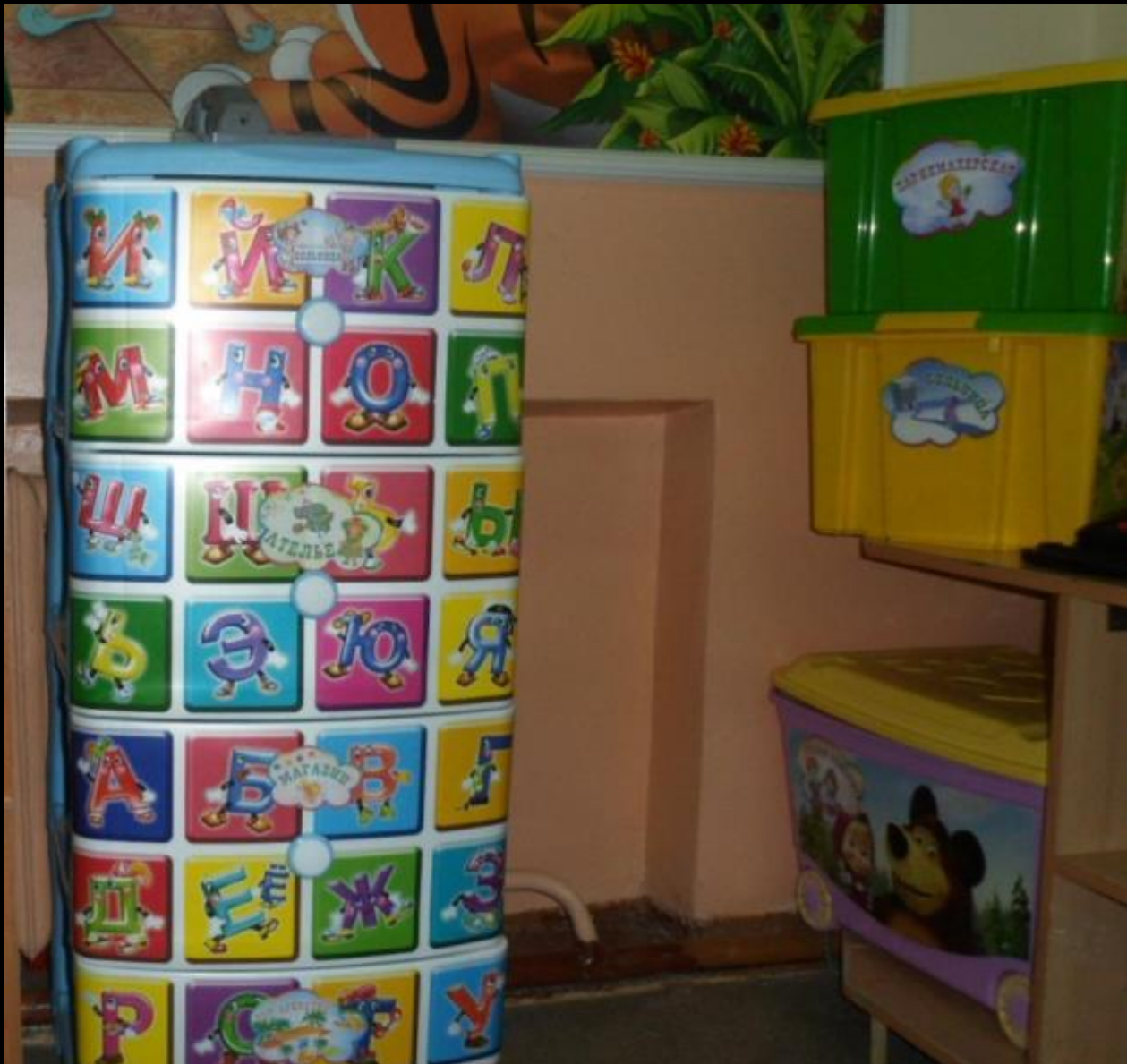
Сектор сюжетно-ролевых игр