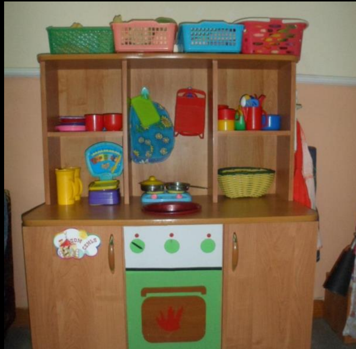
Сектор «Дом, семья»