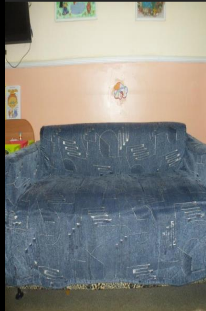
Зона отдыха и релаксации