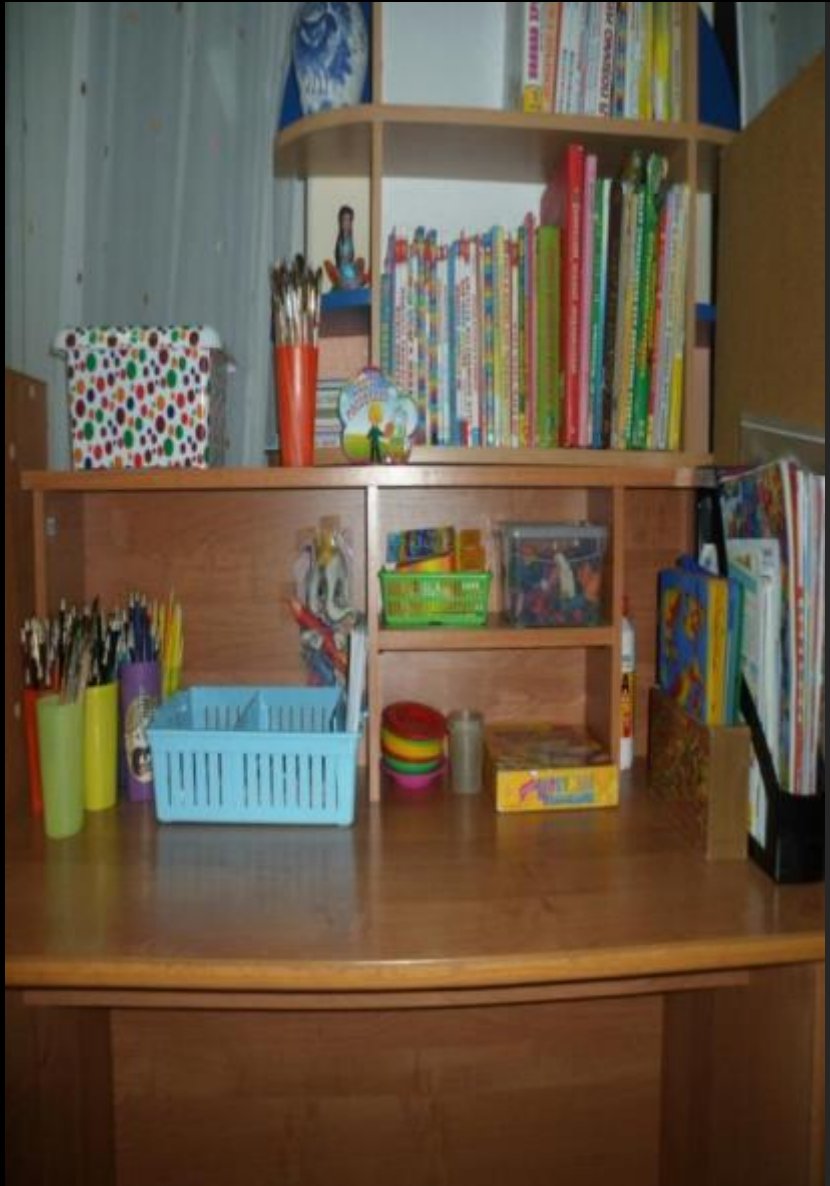
Сектор продуктивной деятельности