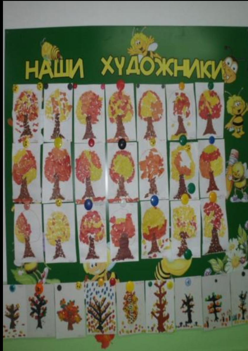
Среда для диалога с родителями