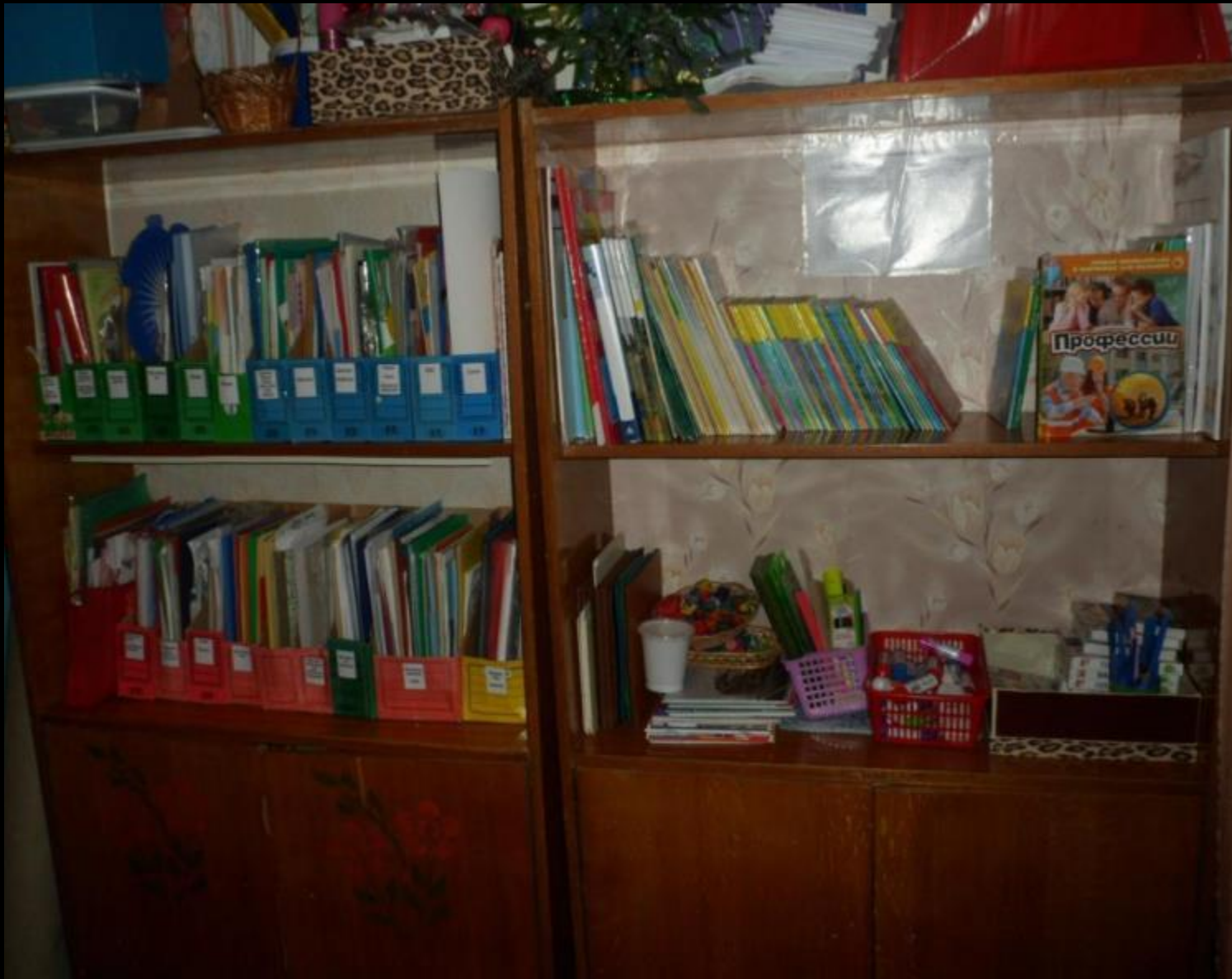
1.6. Рабочий сектор (методическая литература педагога)