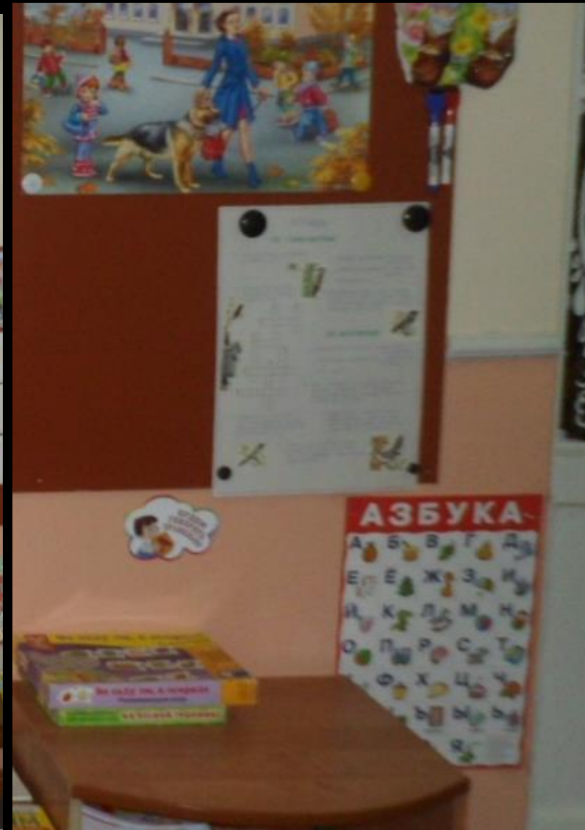
Центр правильной речи