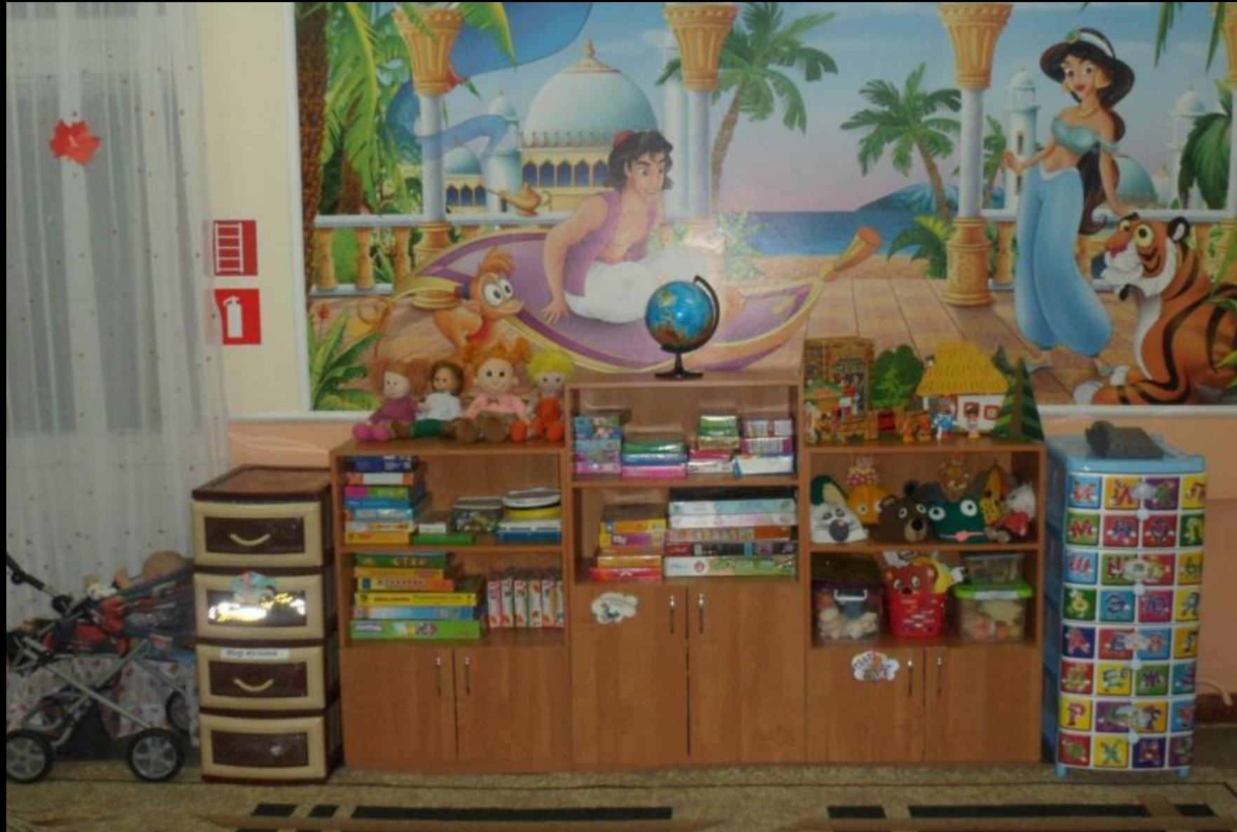
Центр игровой деятельности