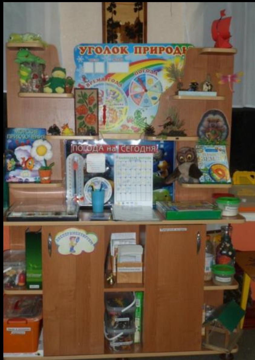
Центр природы (живая, неживая)