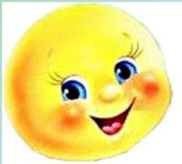
фото-отчёт лето 2016г. Группы № 10 МБДОУ № 23 воспитатель Горобец В.Б.