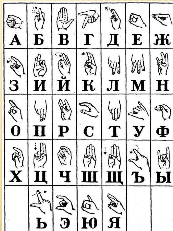
Рис. 5. Русский дактильный алфавит для глухих

Каждой букве алфавита соответствует особое положение пальцев.