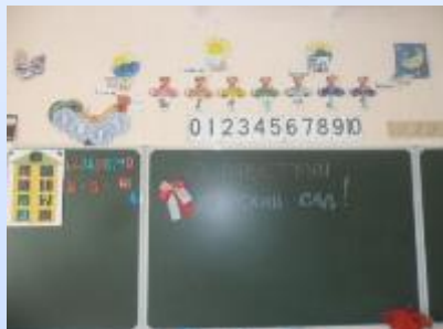
Центр математики (игротека)