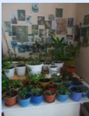
Центр науки (экспериментальный)

Развитие познавательных интересов и познавательных способностей детей; развитие воображения и творческой активности формирование представлений о себе, объектах окружающего мира, о свойствах и отношениях объектов окружающего мира (форме, цвете, размере, Материалов и т.д.), о малой родине и Отечестве и т.д. (дидактические игры, обучающие и др.).