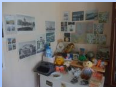
Центр сенсорного развития