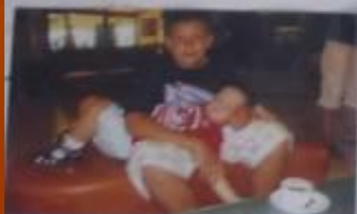
ОТДЫХАТЬ НАДО, ТОЖЕ УМЕТЬ