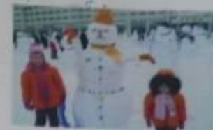
Море и солнце? - Ами! Пляжам!