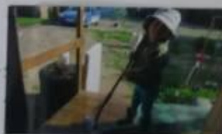
Кому еще поливать?