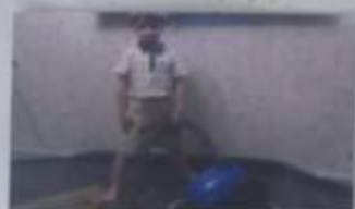
Без него, как работ, мама!