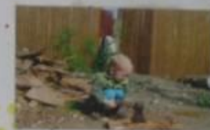
Без меня Дима? - Дима! - Игрушки не играть!