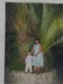
У моря, у синего моря...