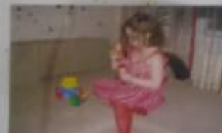
ЗАБОТЫ ВАЯ МАМА