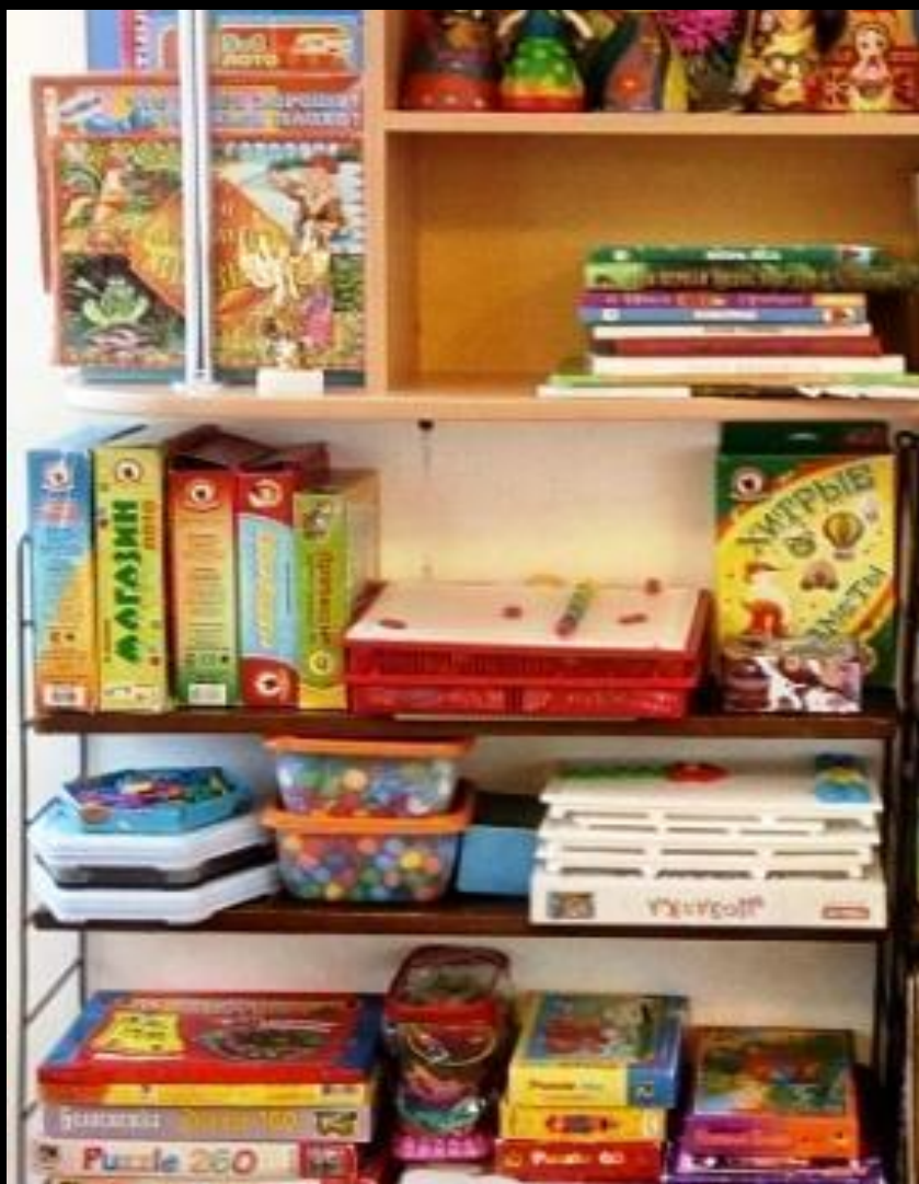
Уголок настольных игр