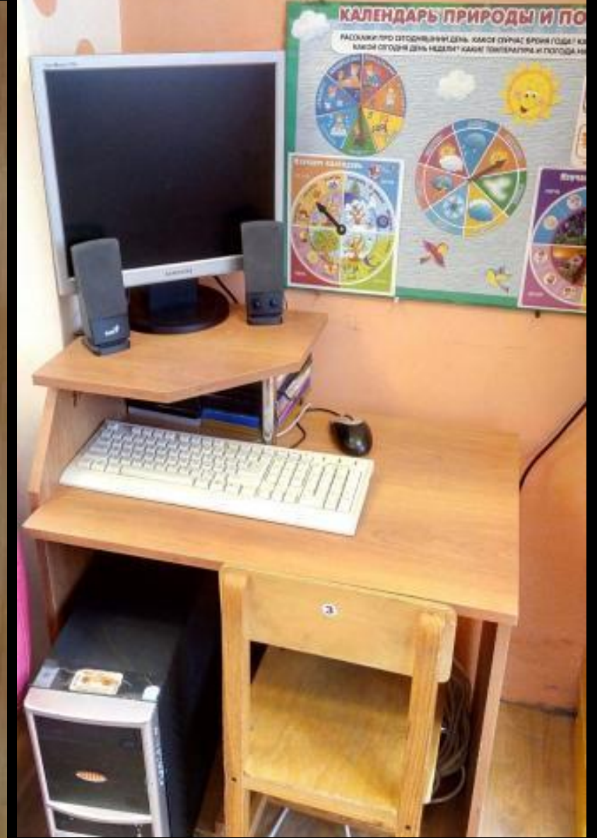
1.7. Рабочий сектор (ИКТ для педагога)