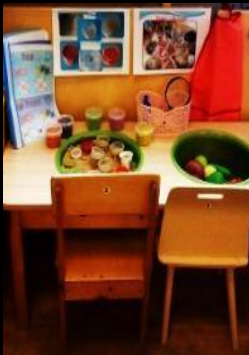
Центр воды и песка