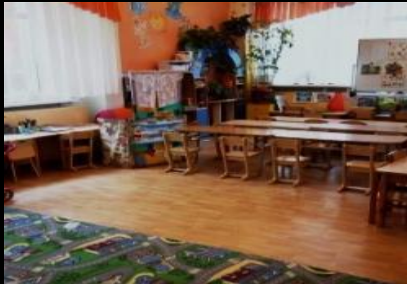
Нижняя правая точка