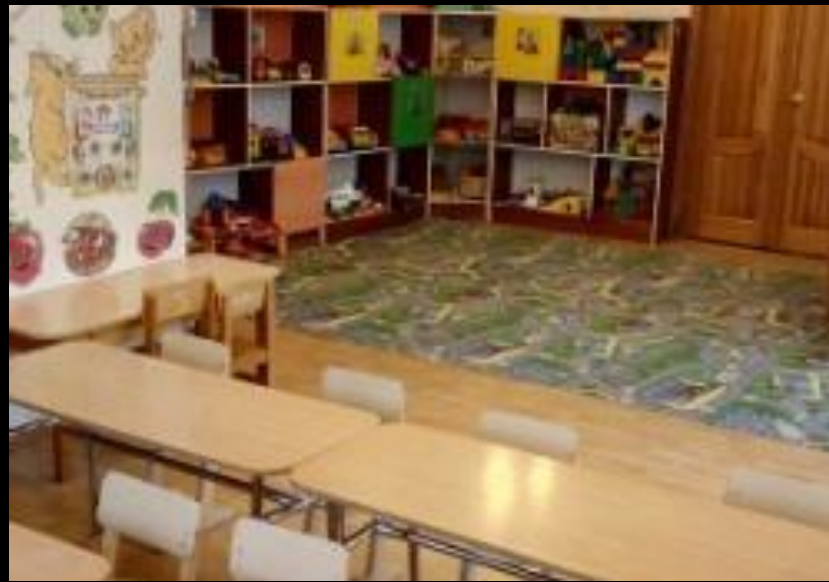
Верхняя правая точка