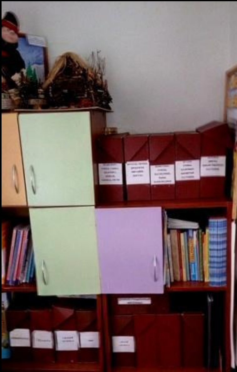
1.6. Рабочий сектор (методическая литература педагога)