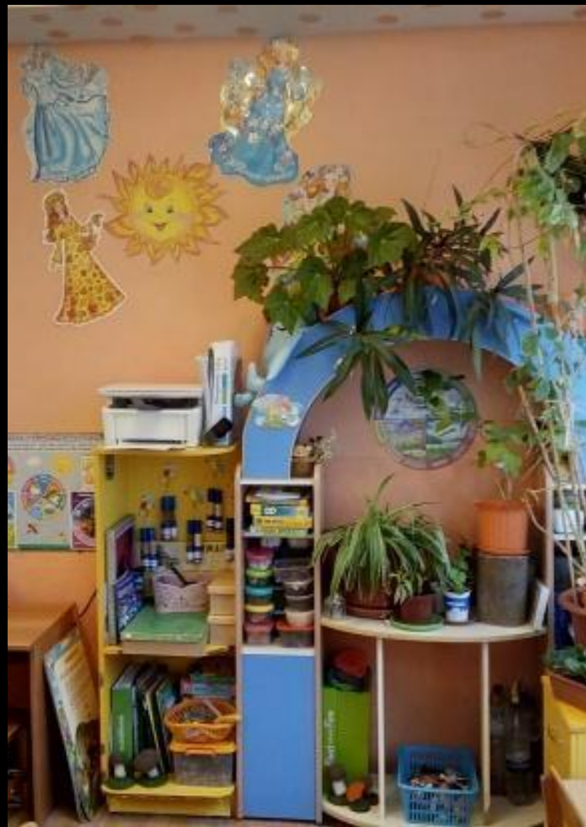
Уголок природы и экспериментальной деятельности