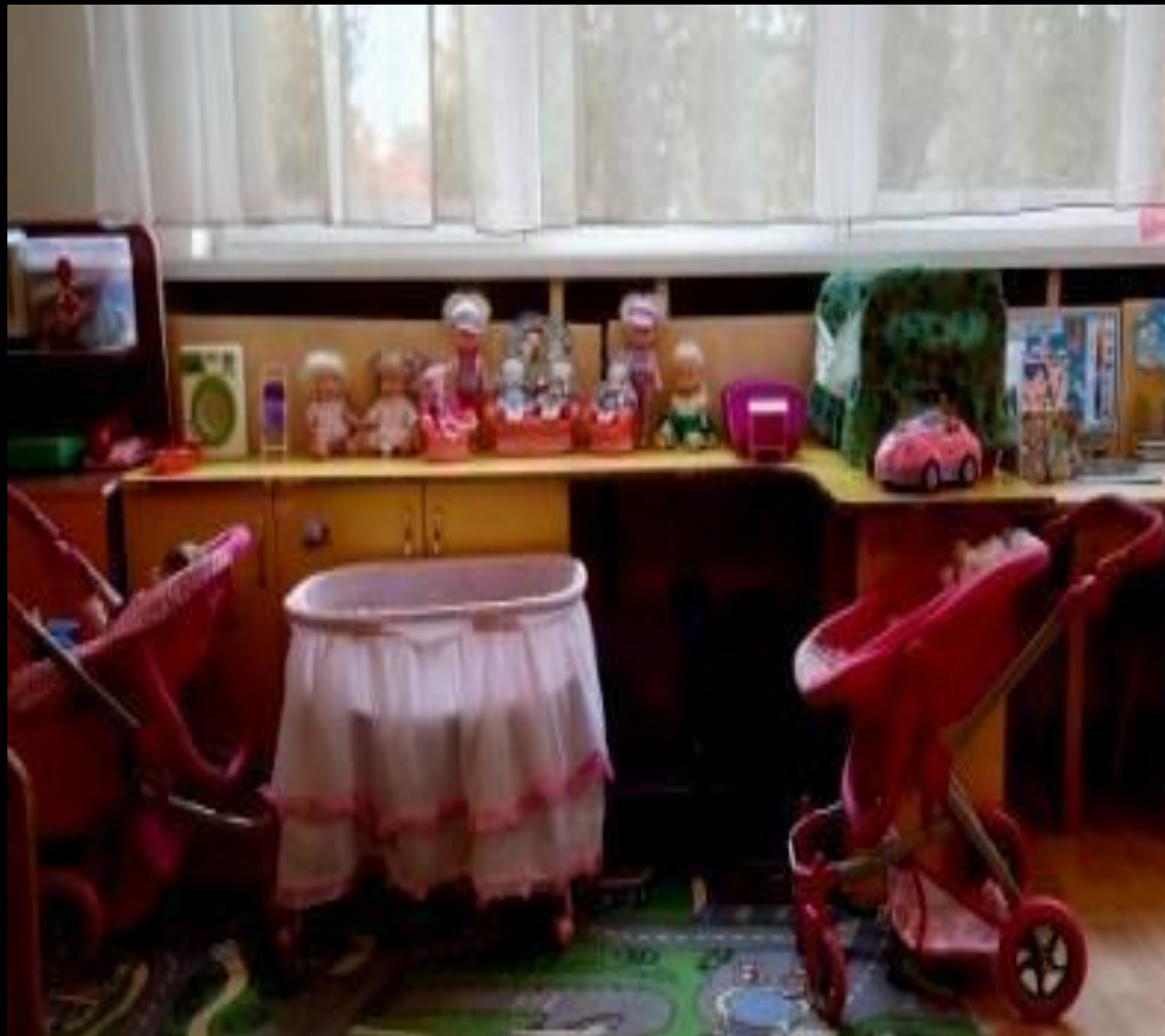
Уголок «Дом + семья»