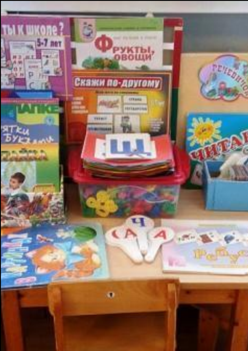
Речевой уголок «Речевичок»