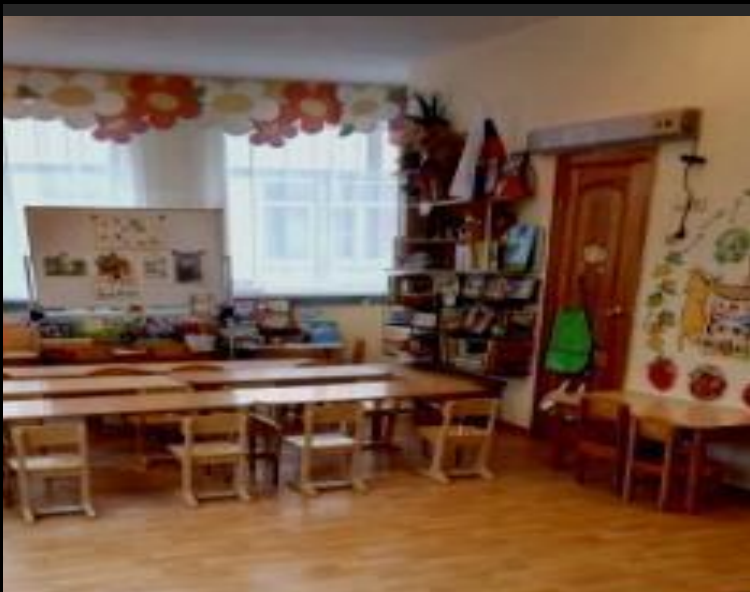
Вход в группу, нижняя левая точка