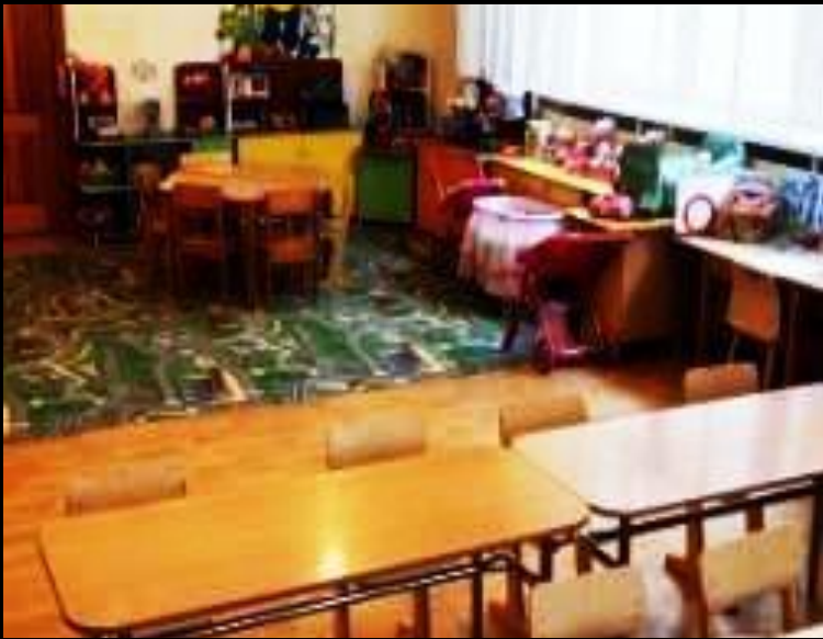
Верхняя левая точка