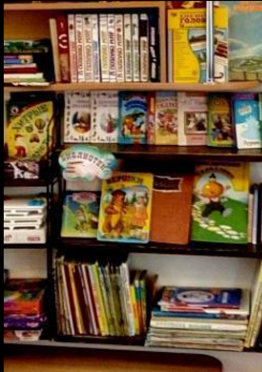
Книжный уголок «Библиотека»