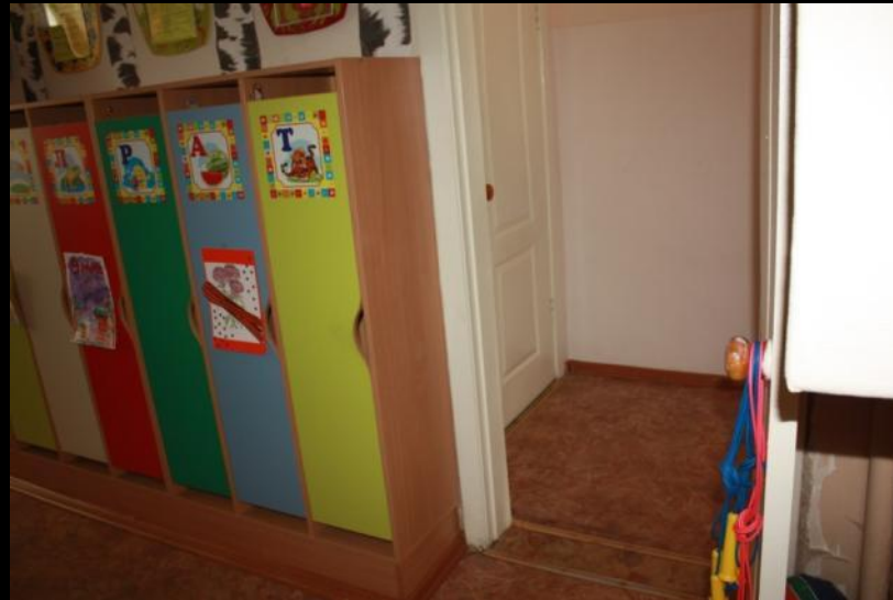
Нижняя правая точка

Помещение для приема воспитанников Образовательная тема «Моя Родина»