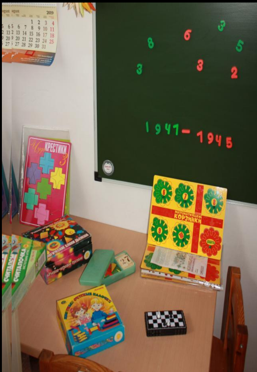
1.1.1. Рабочий сектор (модуль «Математическое развитие»)