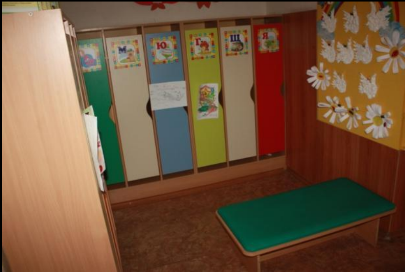
Вход в помещение, нижняя левая точка