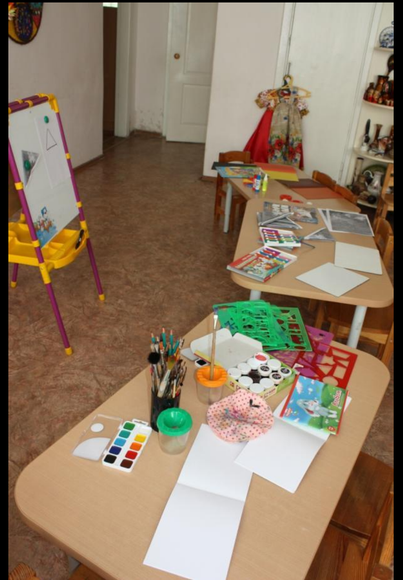
2.3. Ситуация (центр «Студия дизайна»)