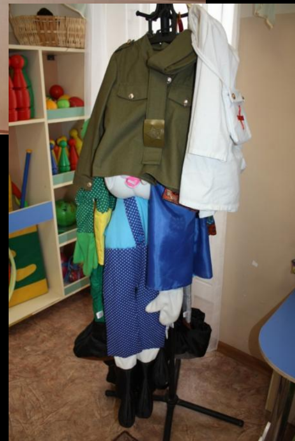
2.2.2. Активный сектор (модуль «Театр»)