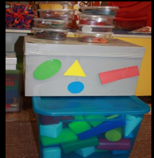
1.5. Рабочий сектор (организация хранения раздаточного и демонстрационного материала для познавательного и речевого развития)