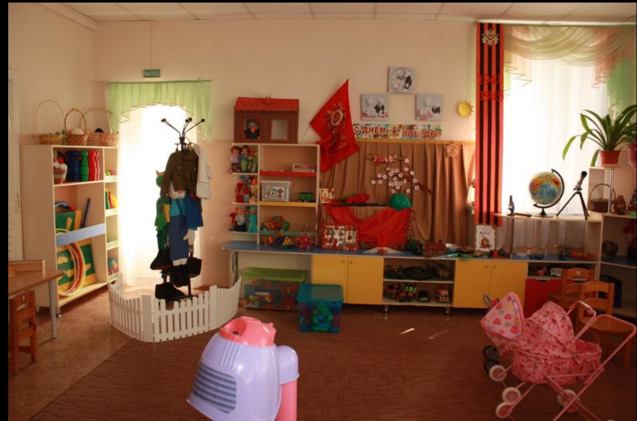
Вид из центра группы в противоположном входу направлении