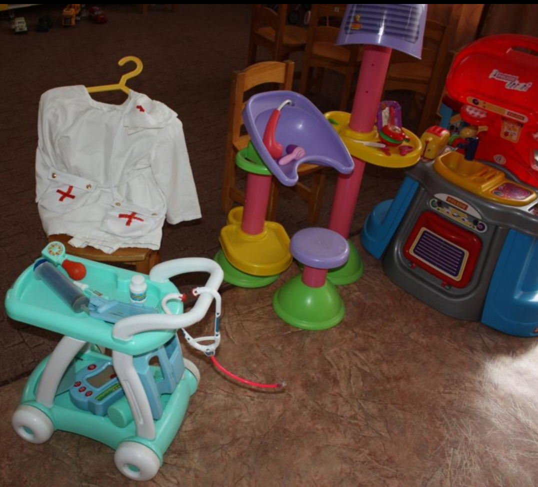
2.3.1. Ситуация 1