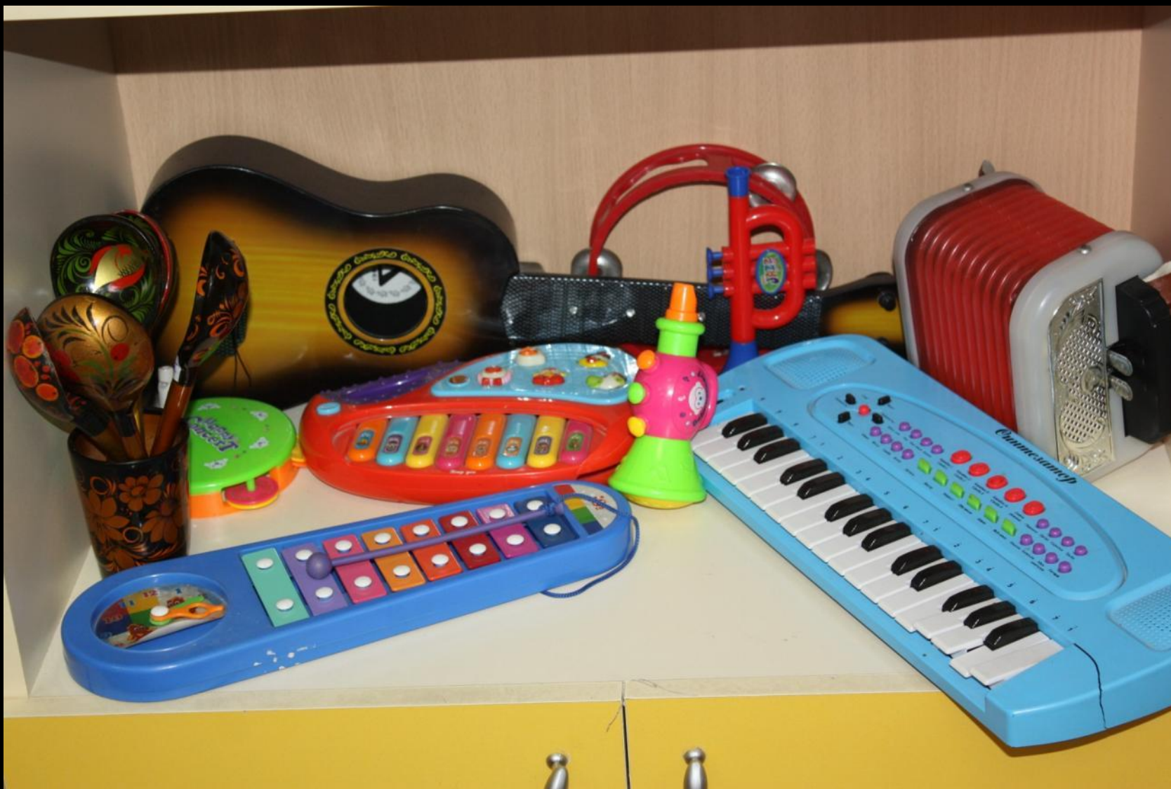
2.2. Активный сектор (центр «Мир звуков и музыки»)