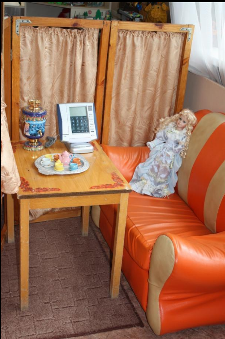
2.4. Спокойный сектор (центр «Уголок уединения»)