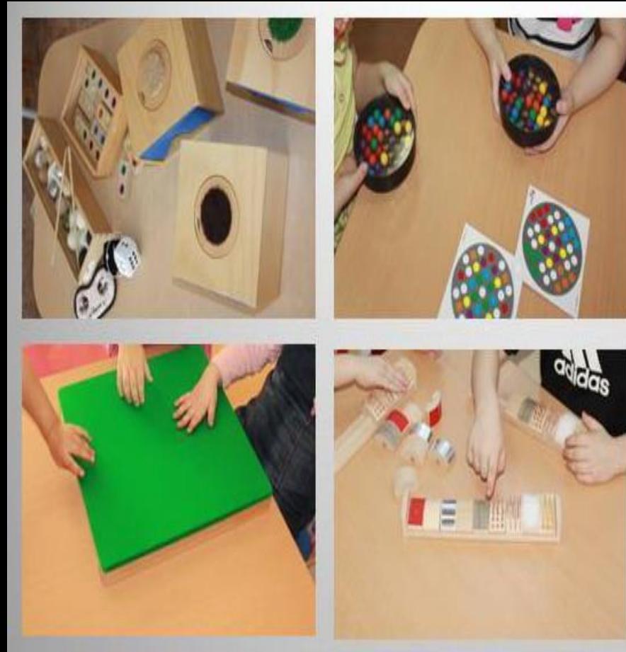
1.4. Рабочий сектор (центр сенсорики)