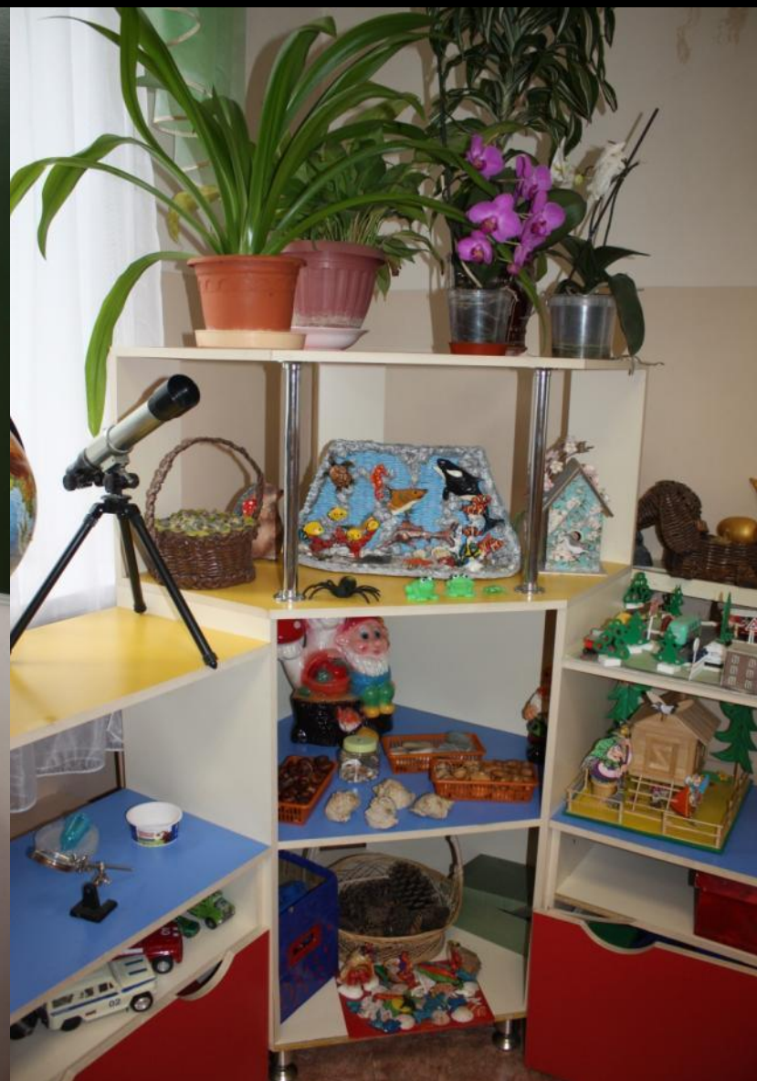
1.1.2. Рабочий сектор (центр «Живая и неживая природа»)