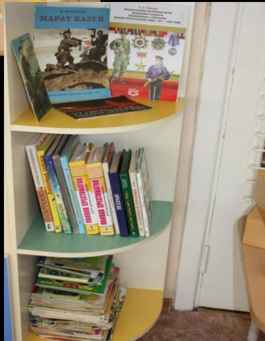
1.3. Рабочий сектор (модуль «Освоение родного языка и литература»)