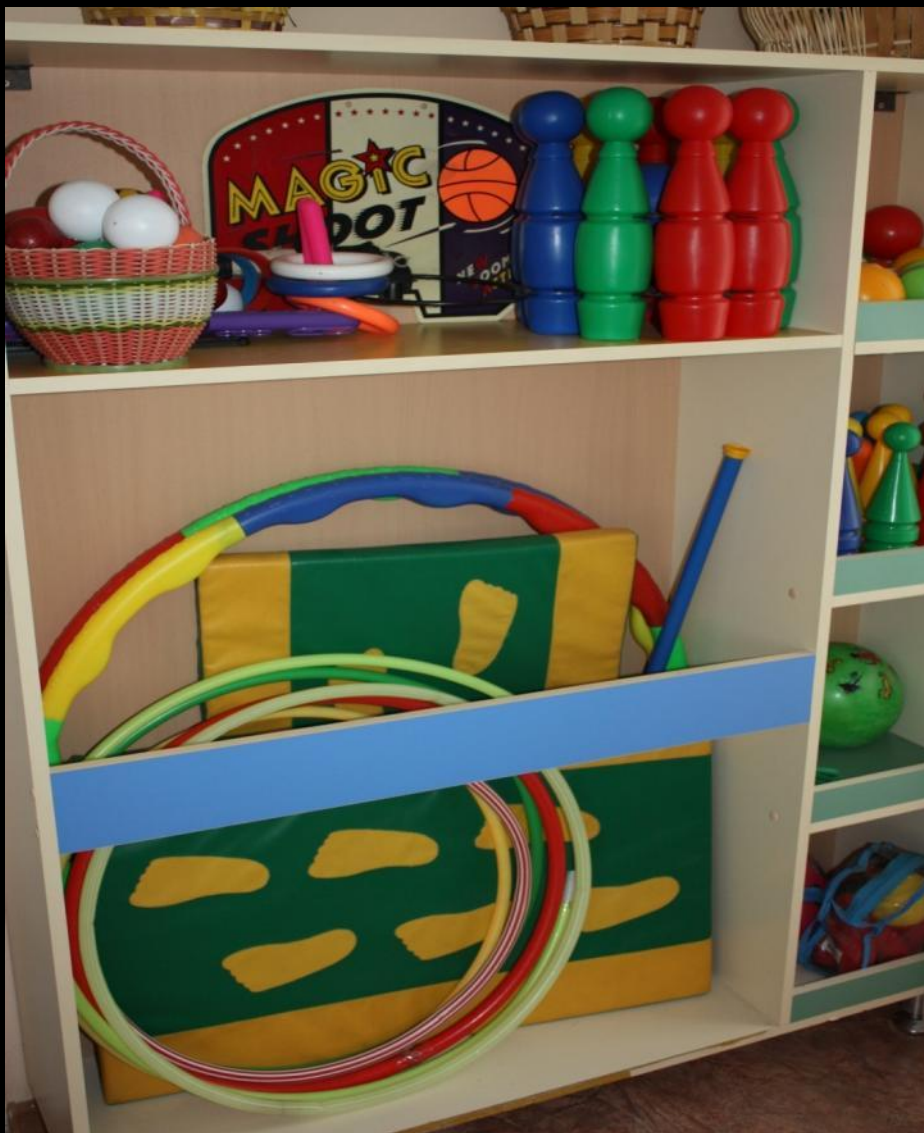
2.2.4. Активный сектор (модуль «Физкультура и спорт»,)