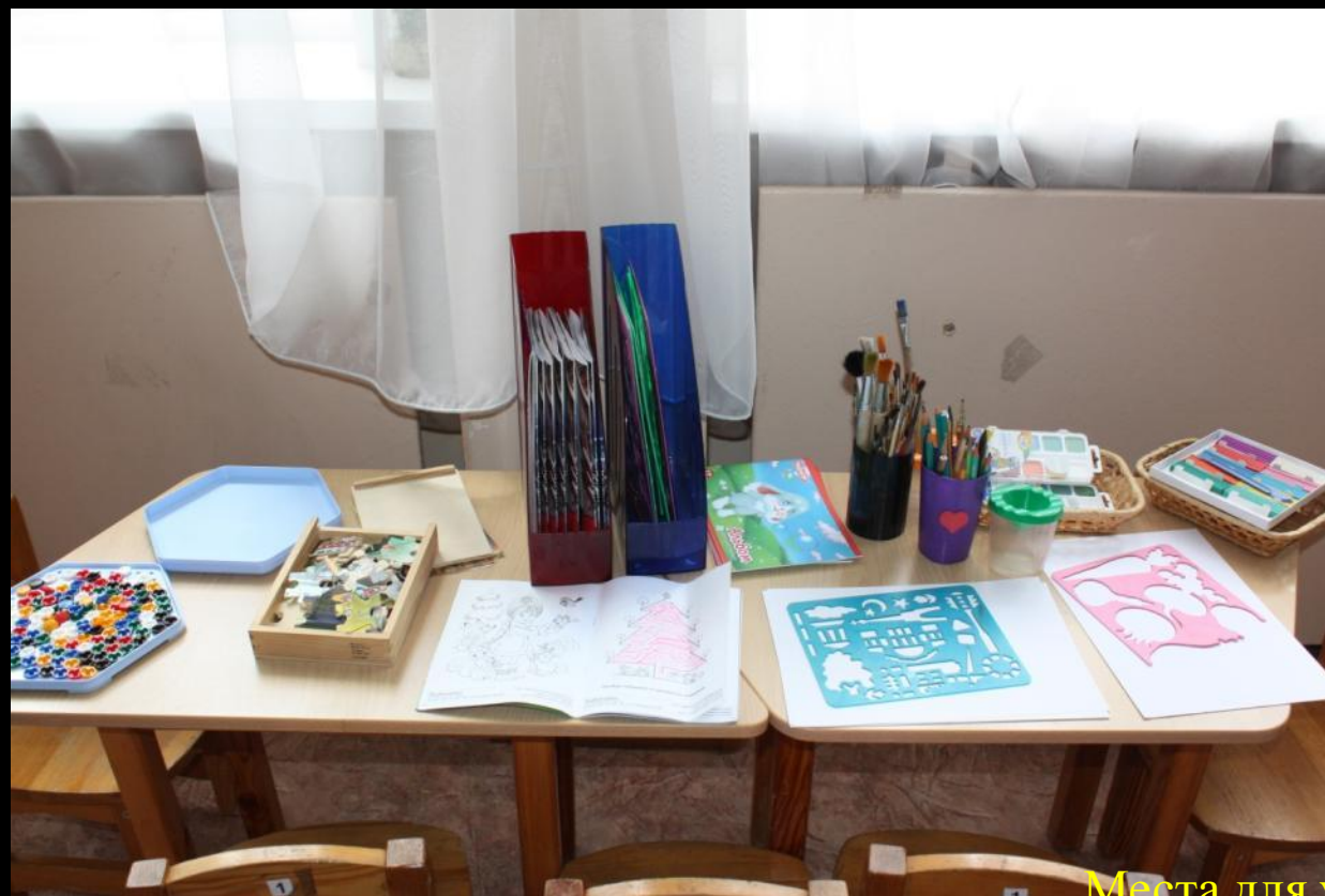
2.4.1. Спокойный сектор (центр «Художественная мастерская»)

Места для уединения доступны в течение всего дня, создаются с помощью лёгких ширм (ребёнок имеет возможность установить ширму самостоятельно); в группе существует правило, запрещающее детям мешать друг другу.