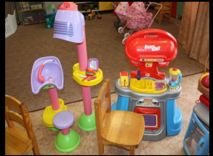
2.2.3. Активный сектор (модуль «Сюжетно-ролевые игры»)