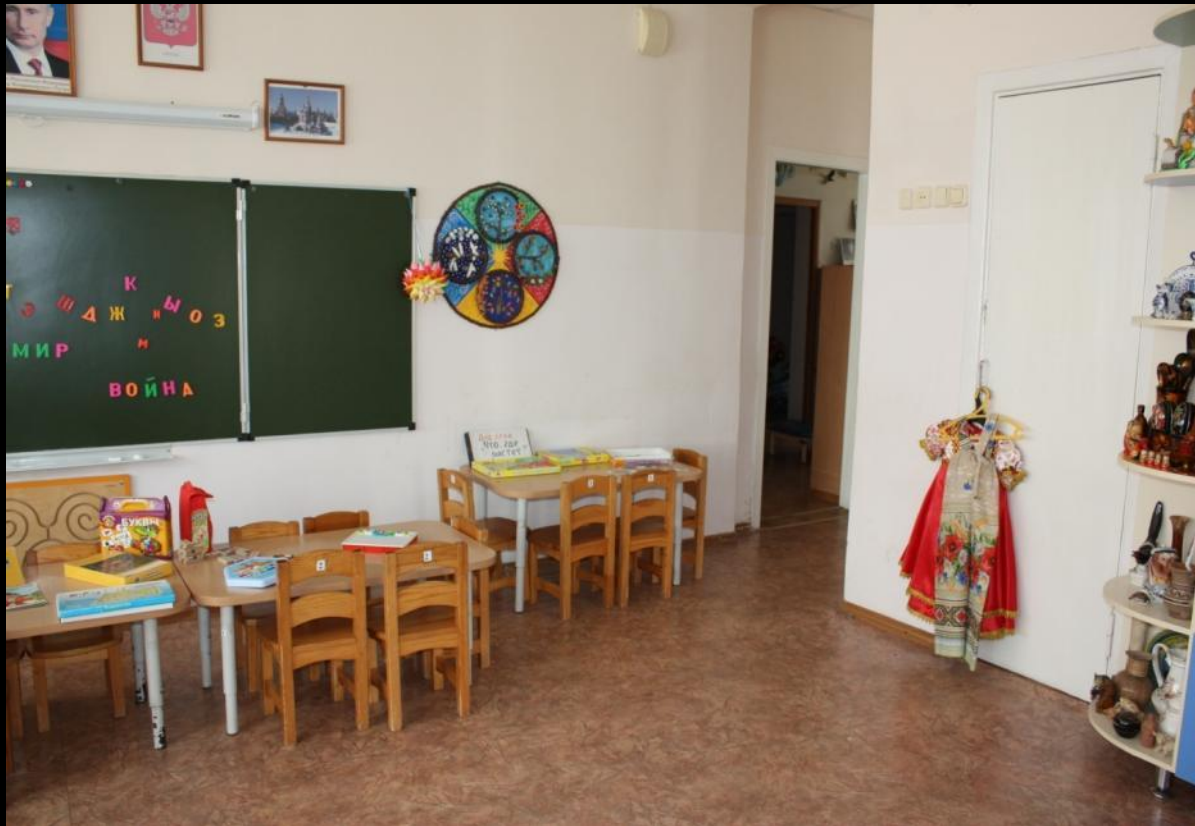
Вид из центра группы на вход в помещение