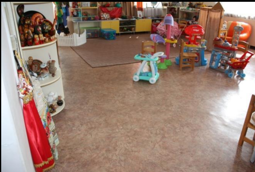
Вход в группу, нижняя левая точка