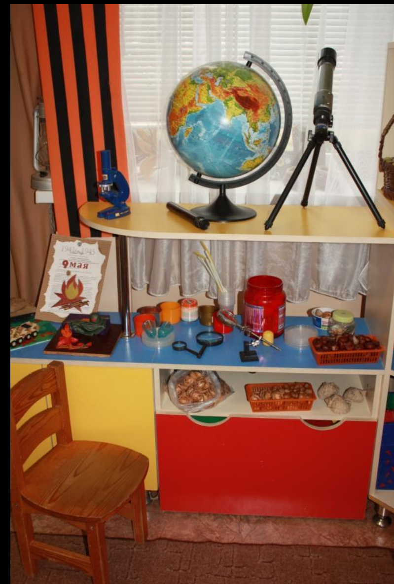
1.1.3. Рабочий сектор (модуль «Экспериментирование»)