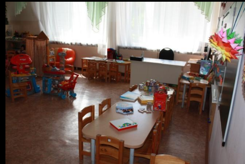
Нижняя правая точка