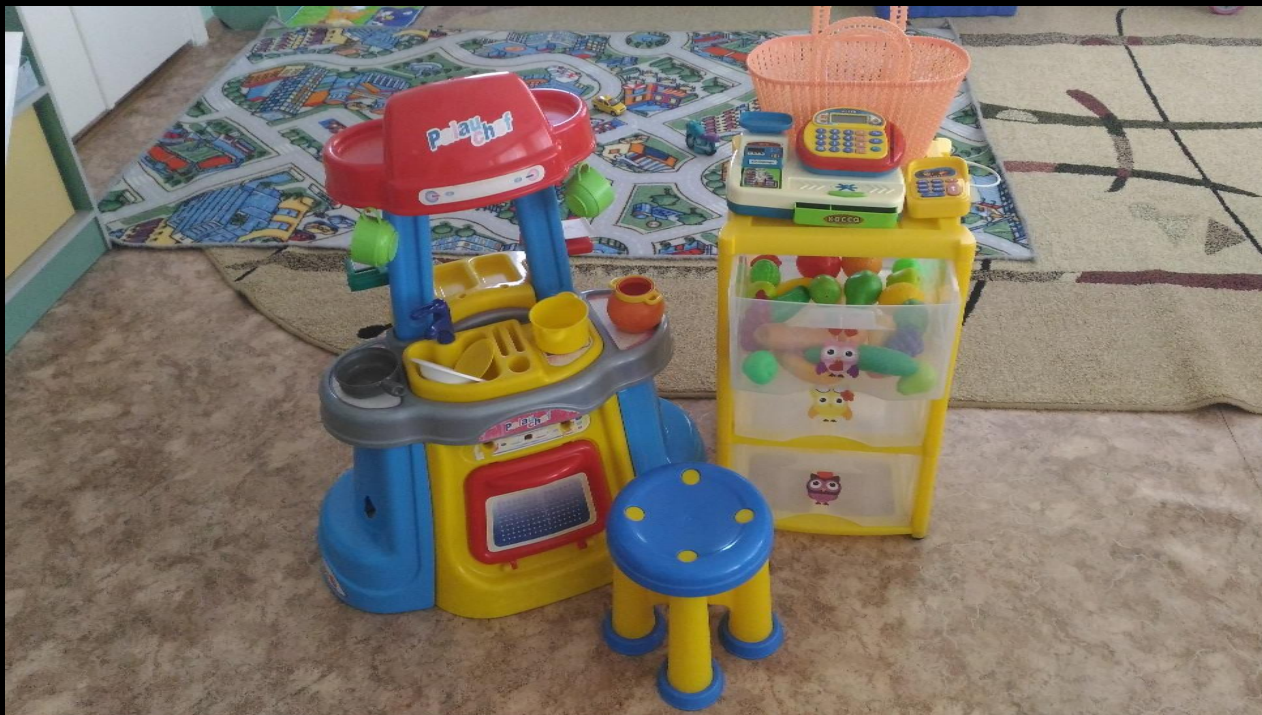
Сюжетно-ролевая игра «Магазин»