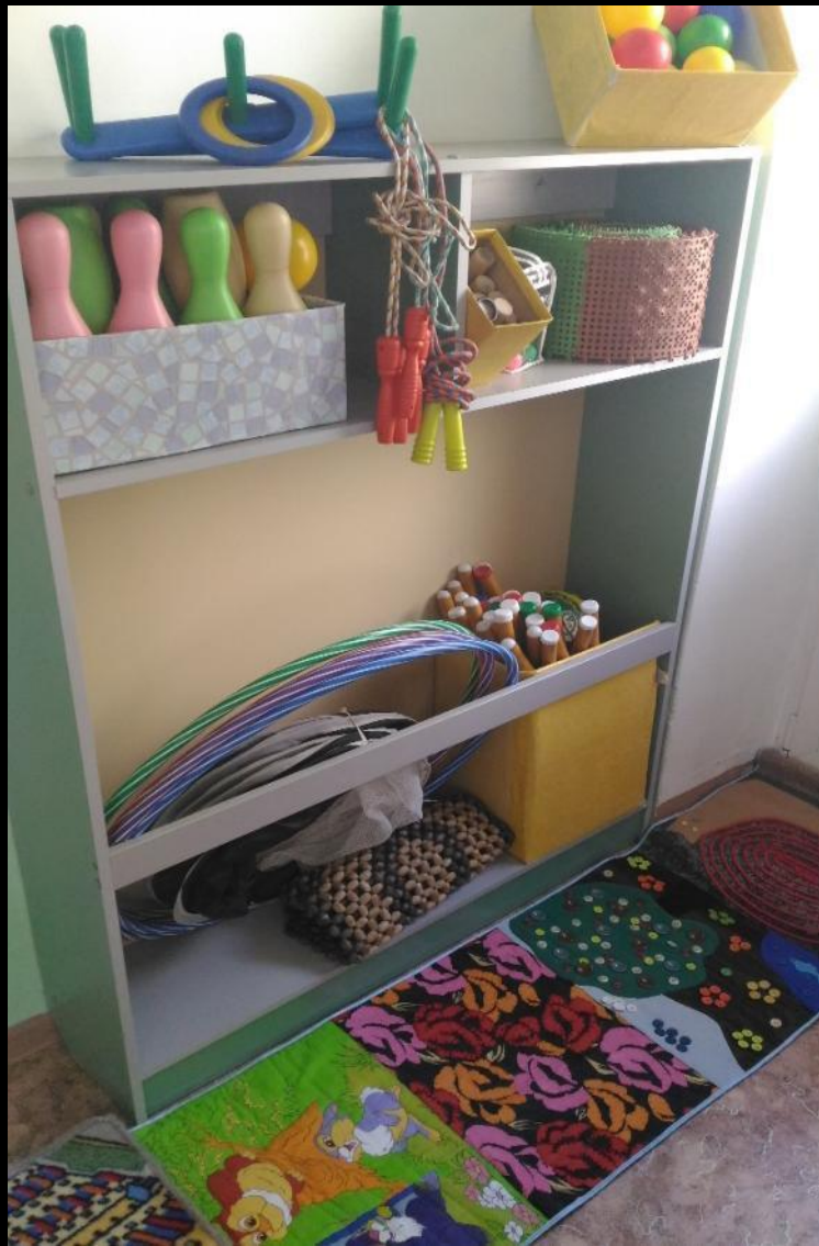
Центр двигательной активности