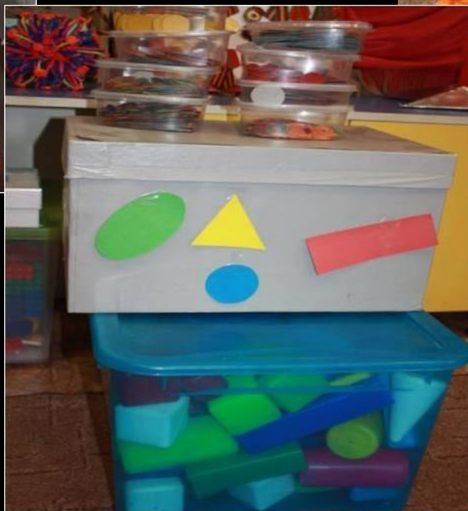
Рабочий сектор (модуль «Конструирование»)