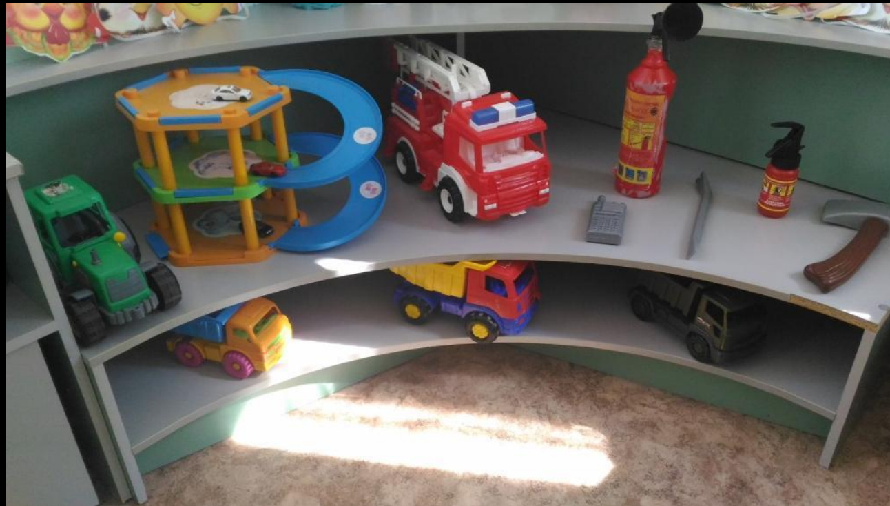
Сюжетно-ролевая игра «Гараж»