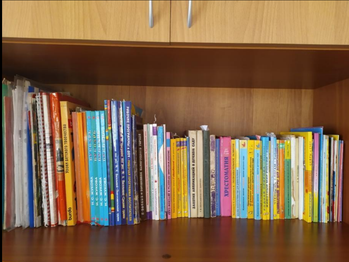
Рабочий сектор (методическая литература педагога)