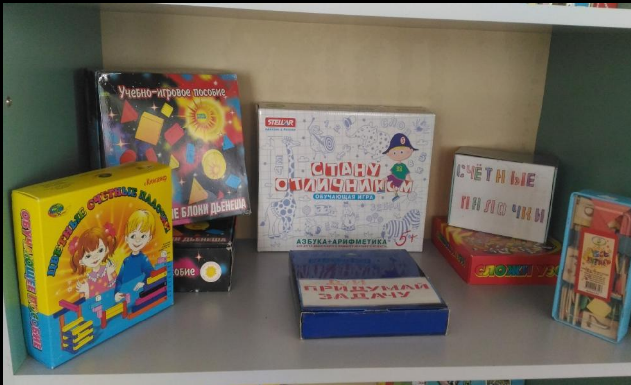
Рабочий сектор модуль «Математическое развитие»