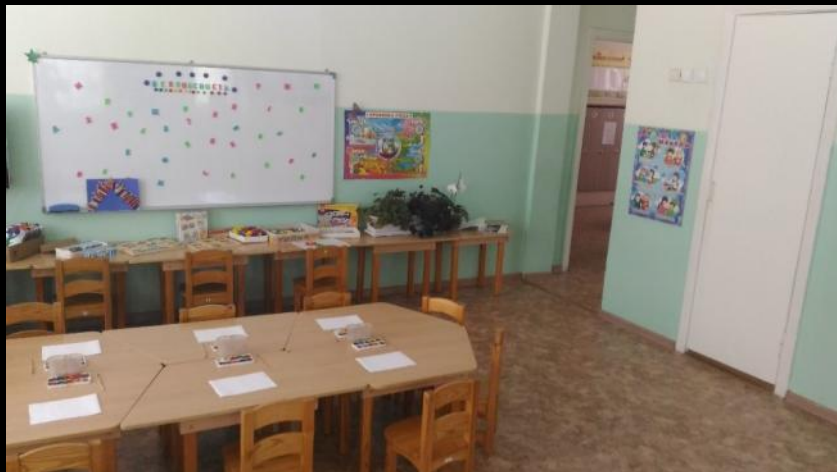
Вход в группу, нижняя левая точка