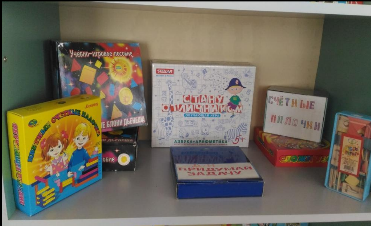
Рабочий сектор модуль «Математическое развитие»