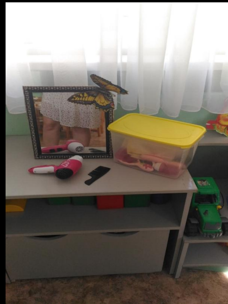
Сюжетно-ролевая игра «Парикмахерская»