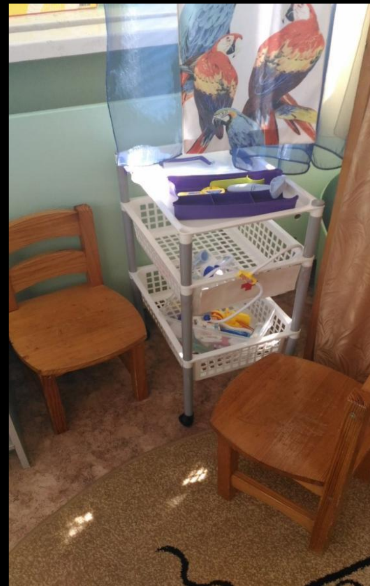
Сюжетно-ролевая игра «Доктор»