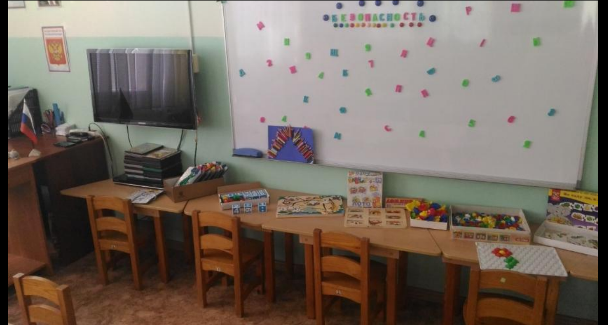
Рабочий сектор (ИКТ для педагога)