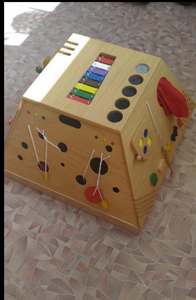
Рабочий сектор модуль «Сенсорика»