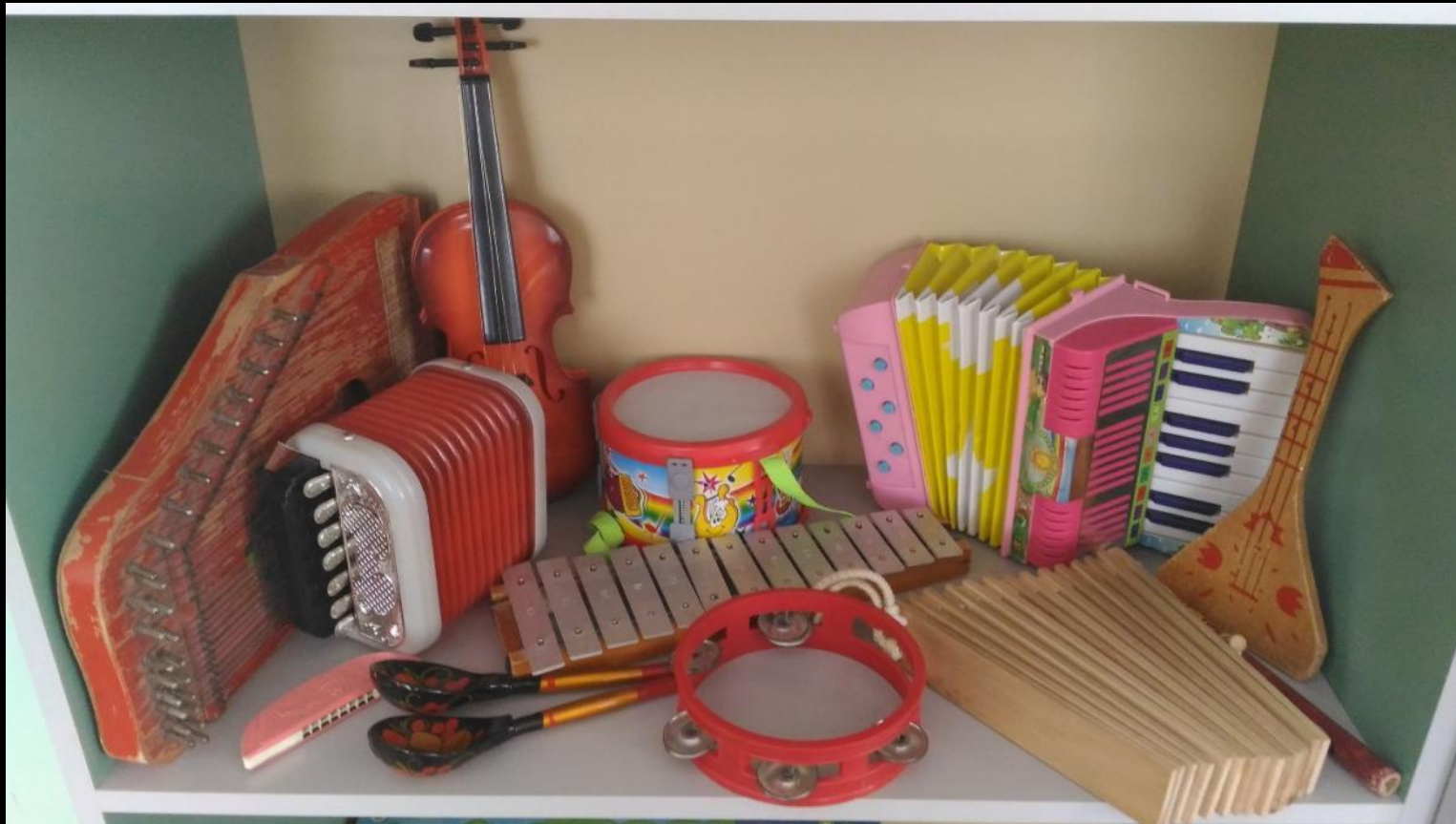
Центр музыкальной деятельности