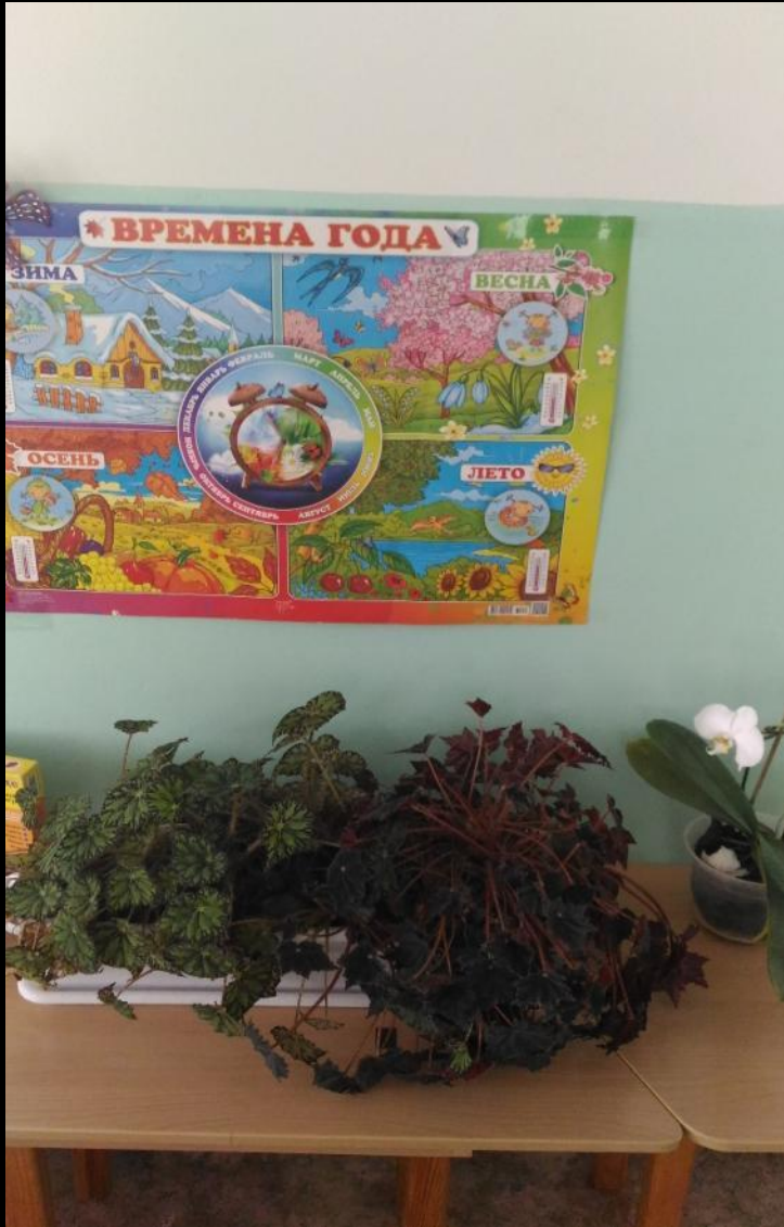
Центр живой и неживой природы