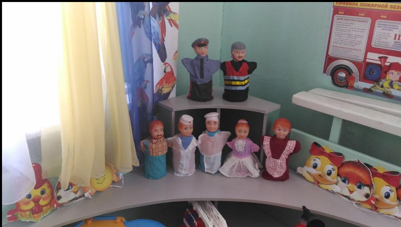
Центр театрализованной деятельности