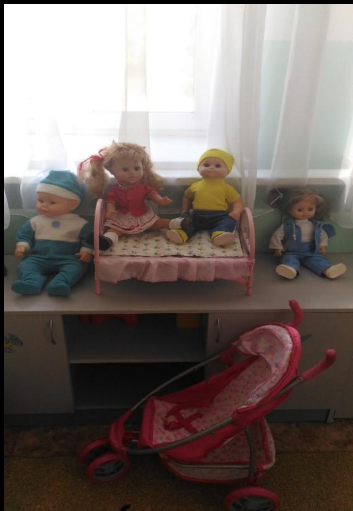
Сюжетно-ролевая игра «Дочки-матери»