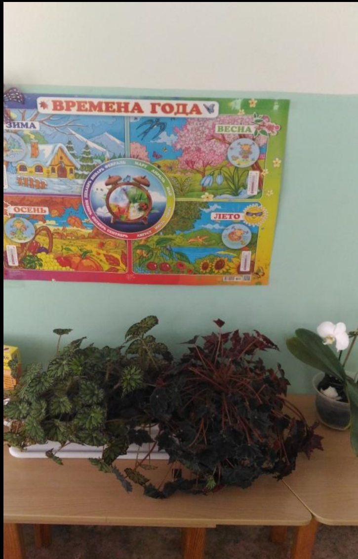
Центр живой и неживой природы