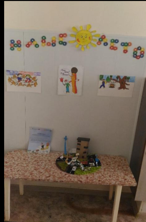
Совместное творчество детей и родителей