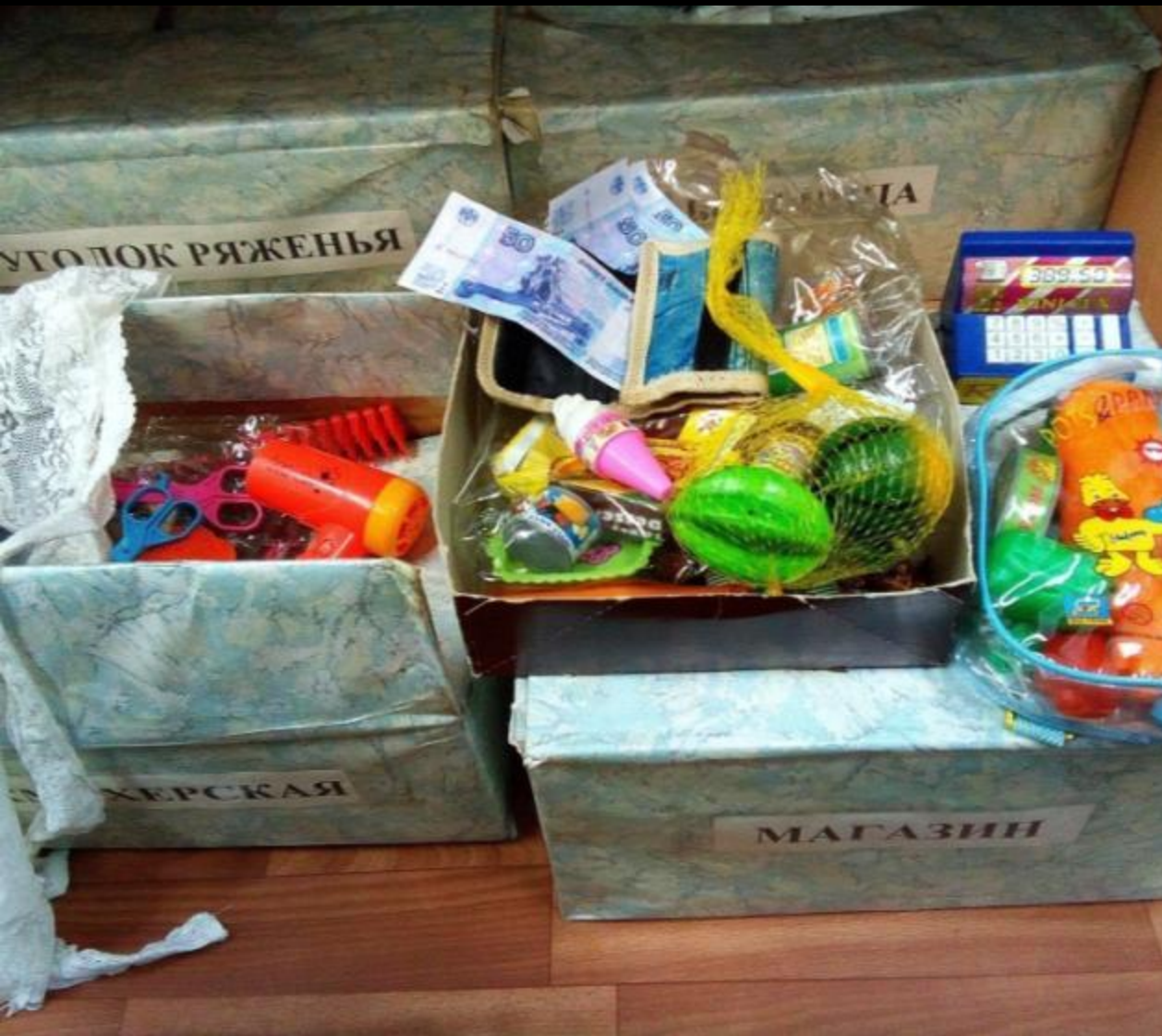
Центр сюжетно-ролевой игры