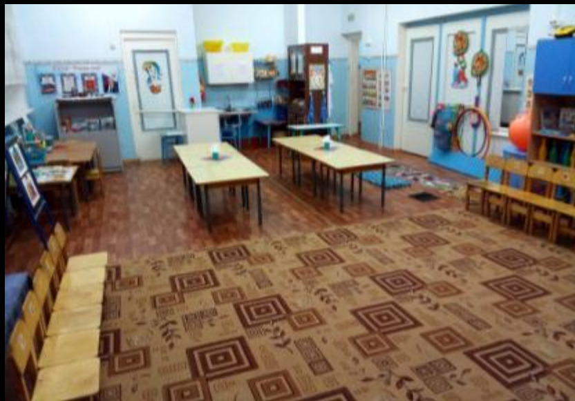
Верхняя правая точка