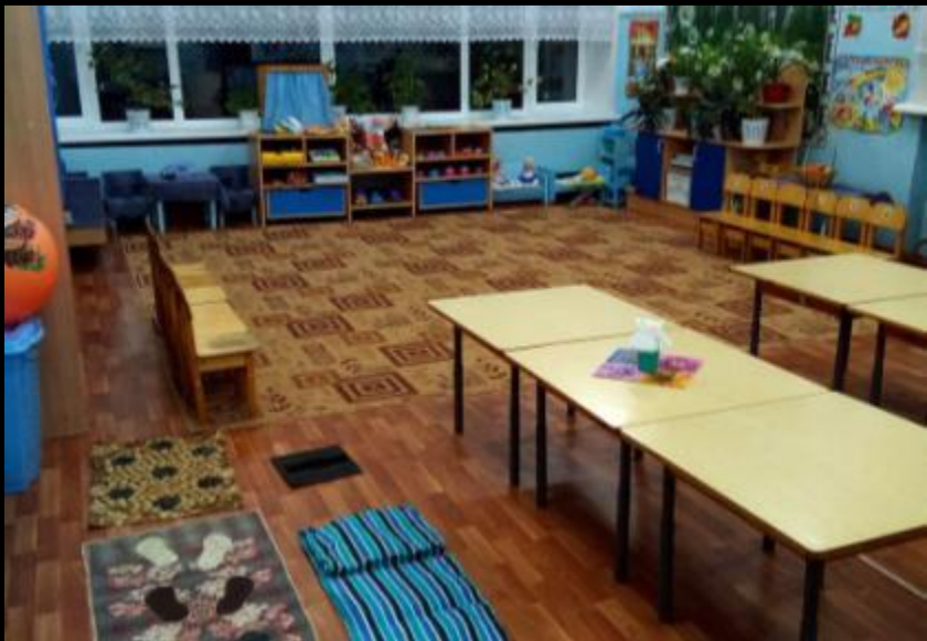
Вход в группу, нижняя левая точка