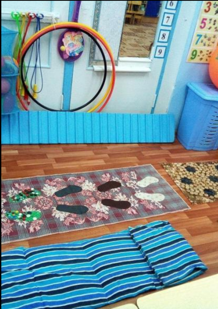
Центр двигательной активности