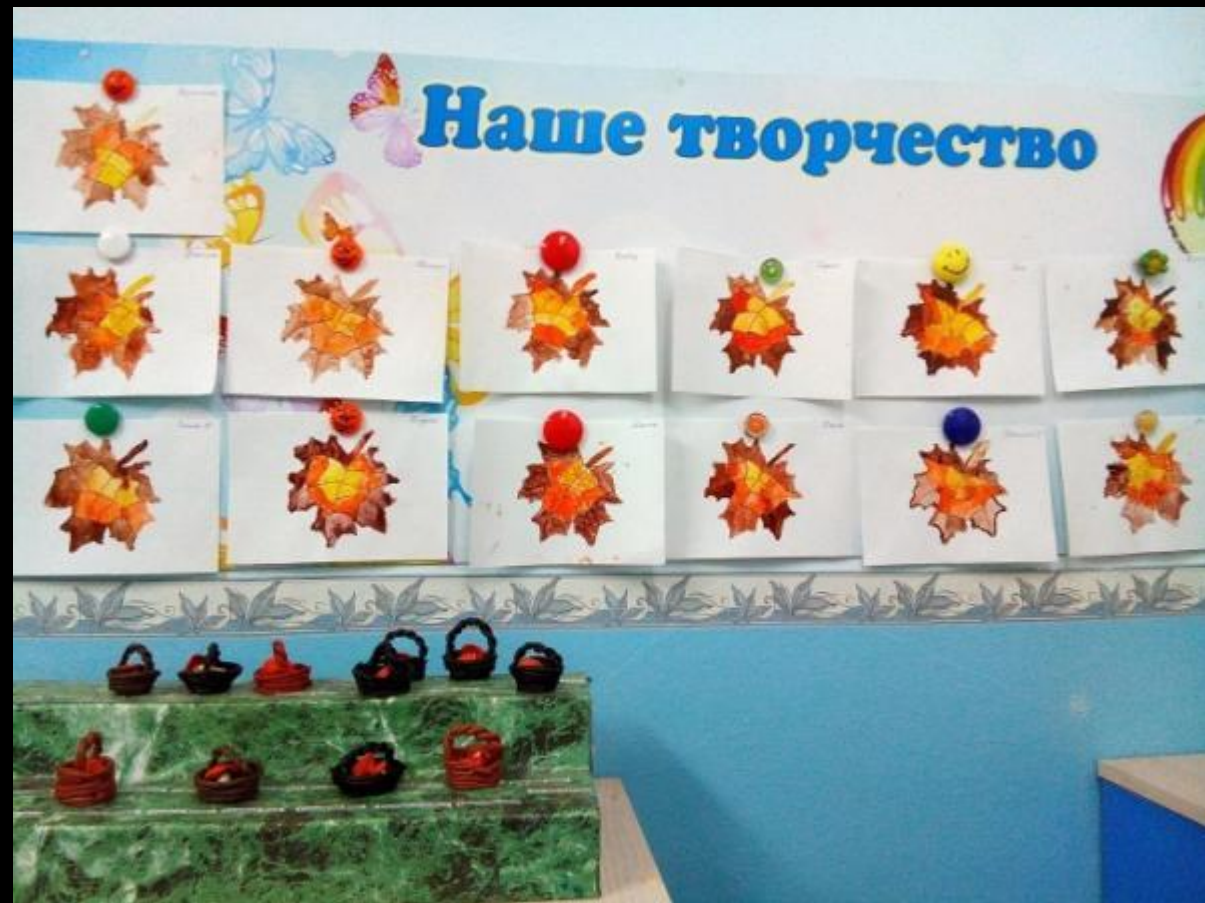
Центр творческой активности