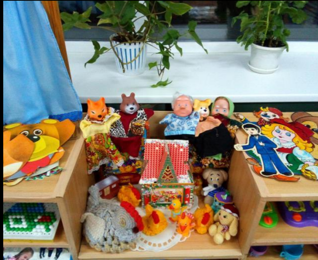
Центр театрализованной деятельности