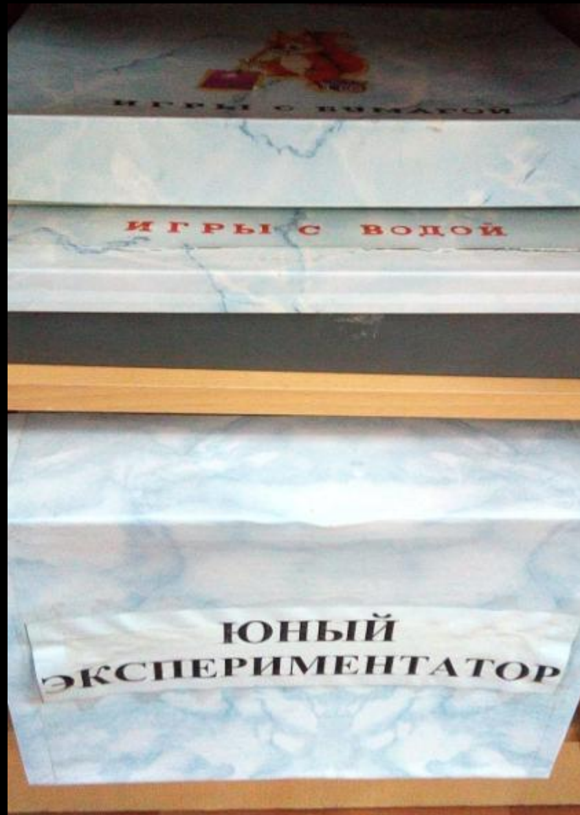
Центр «Экспериментирование-исследовательская деятельность»