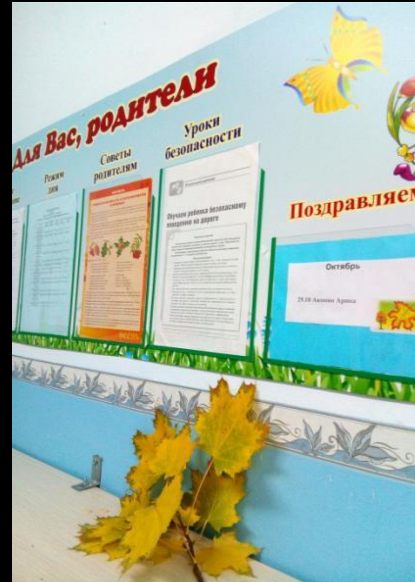
Среда для диалога с родителями