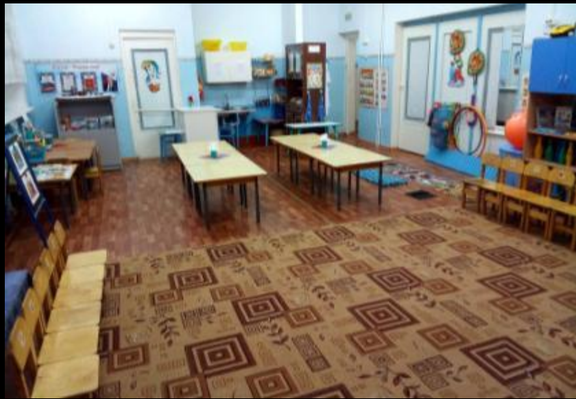
Верхняя правая точка