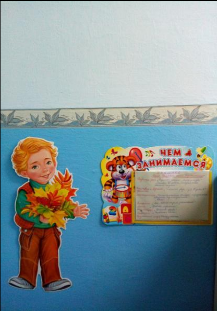
Среда для диалога с родителями