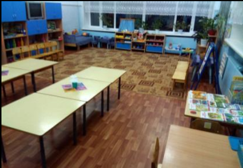
Нижняя правая точка