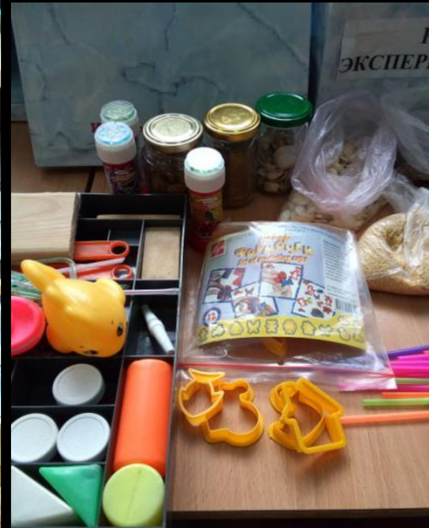
Центр «Экспериментирование-исследовательская деятельность»