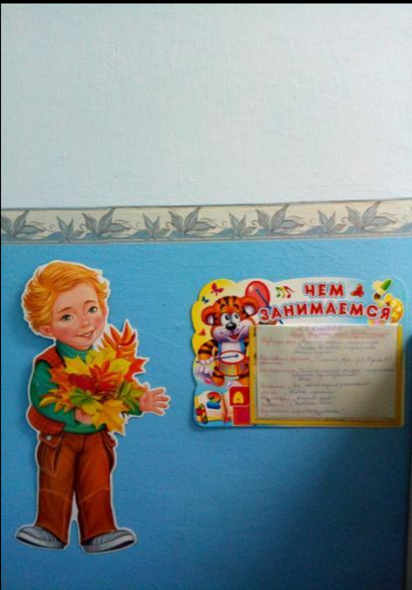
Среда для диалога с родителями