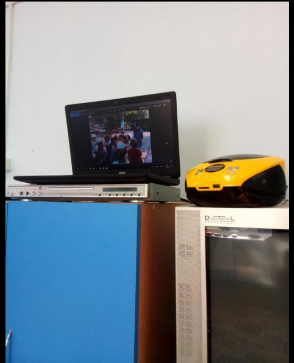
1.7. Рабочий сектор (ИКТ для педагога)