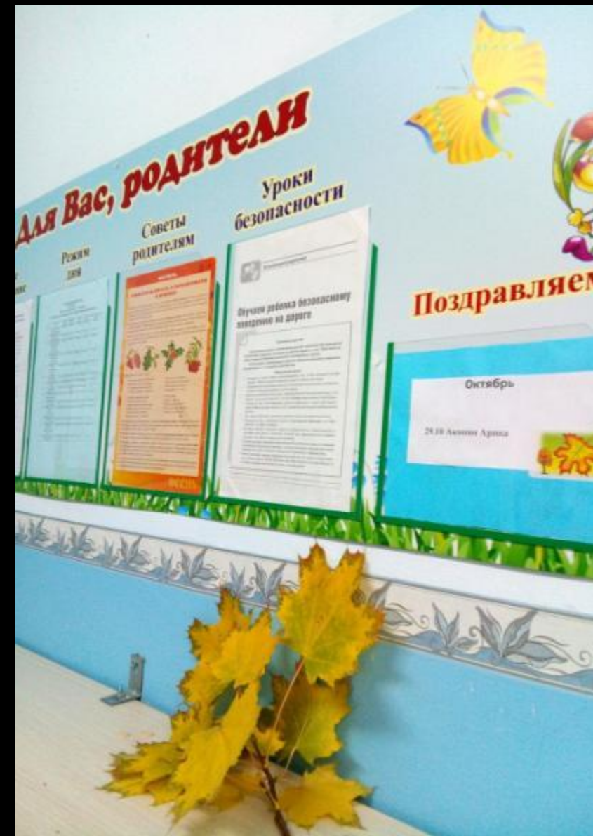
Среда для диалога с родителями