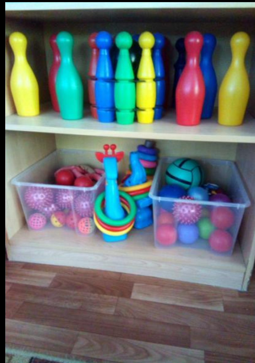
Центр двигательной активности