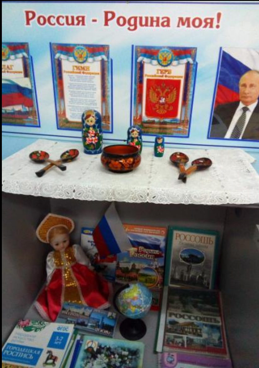
Наследие культуры и социокультурные ценности