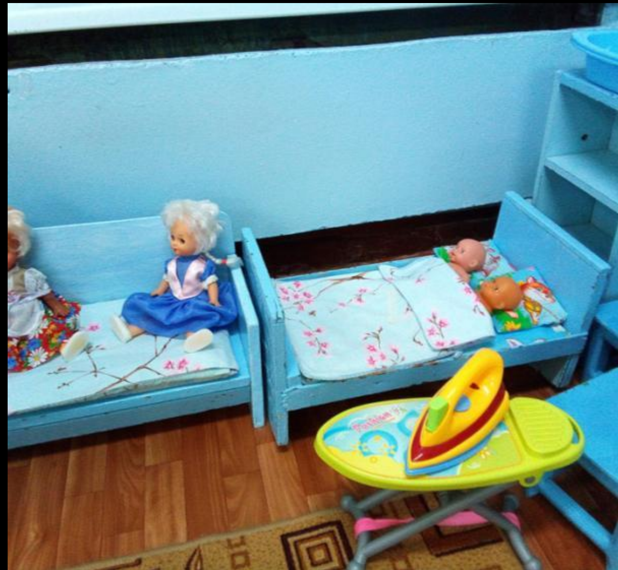
Центр сюжетно-ролевой игры