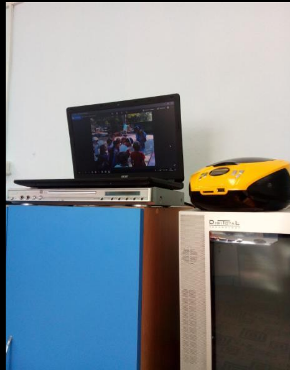
1.7. Рабочий сектор (ИКТ для педагога)