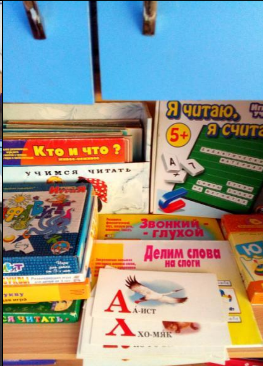
Освоение родного языка и литературы