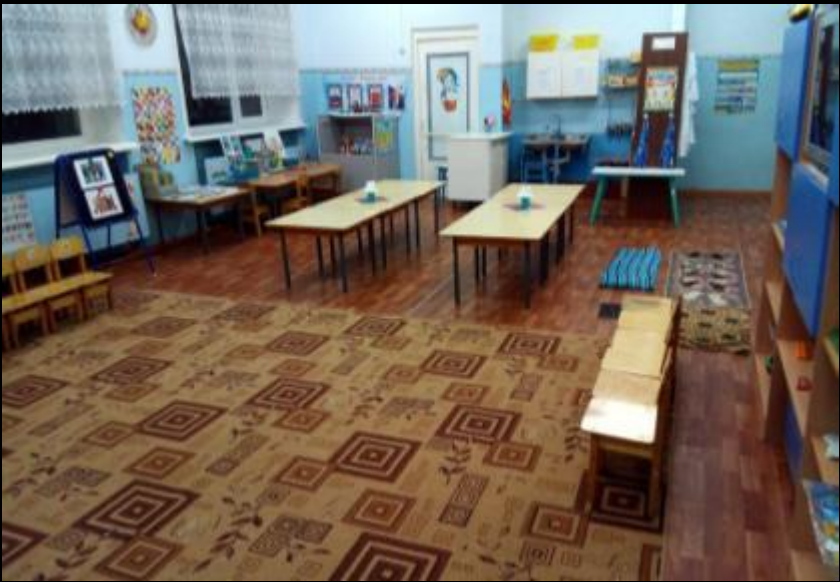
Верхняя левая точка