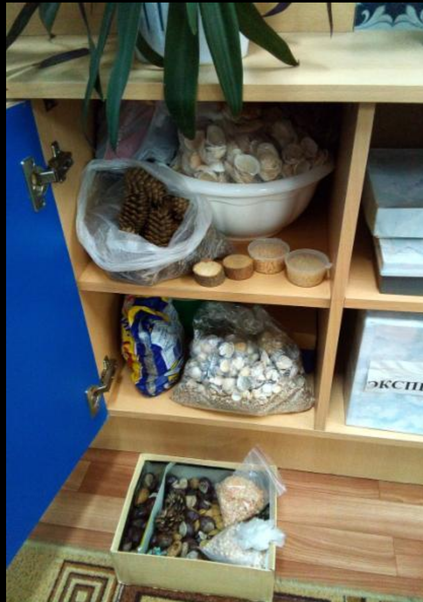
Центр «Экспериментирование-исследовательская деятельность»