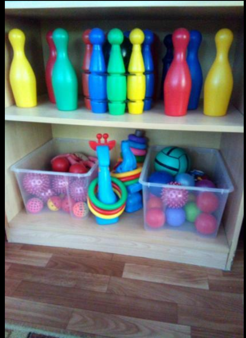
Центр двигательной активности