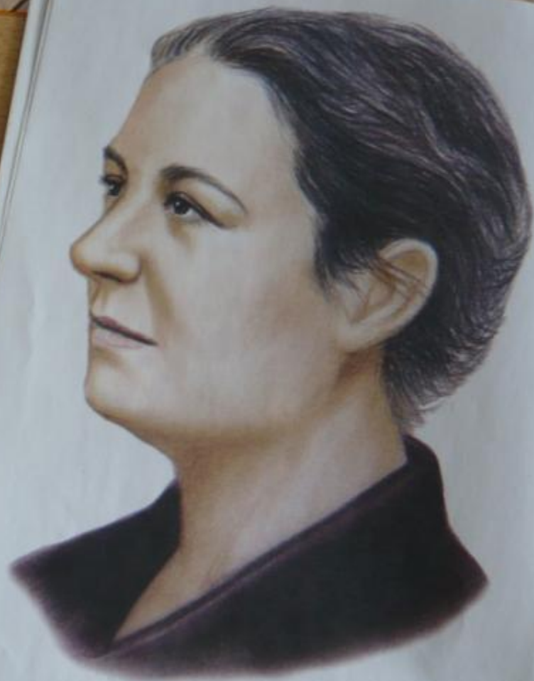
Барто Агния Львовна (1906-1981)