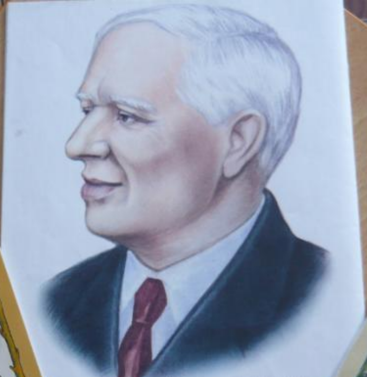
Чуковский Корней Иванович (1882-1969)