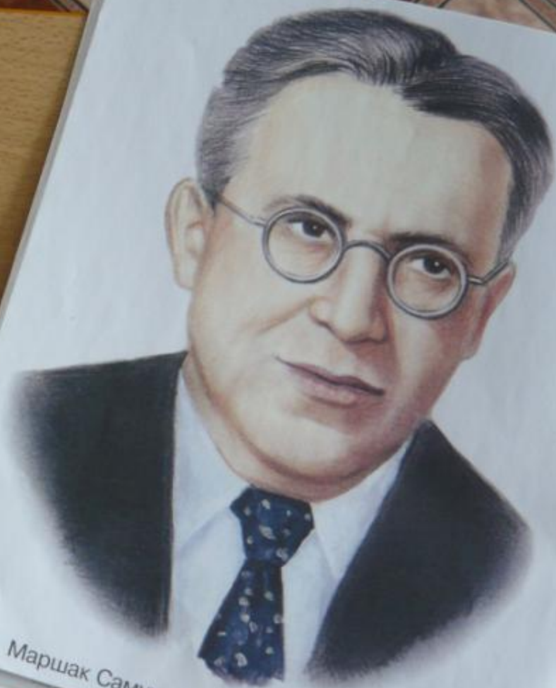
Маршак Самуил Яковлевич (1887-1964)