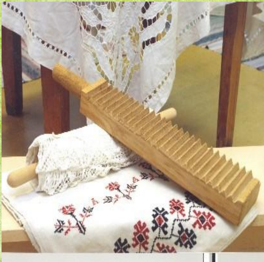
Рубель и валек