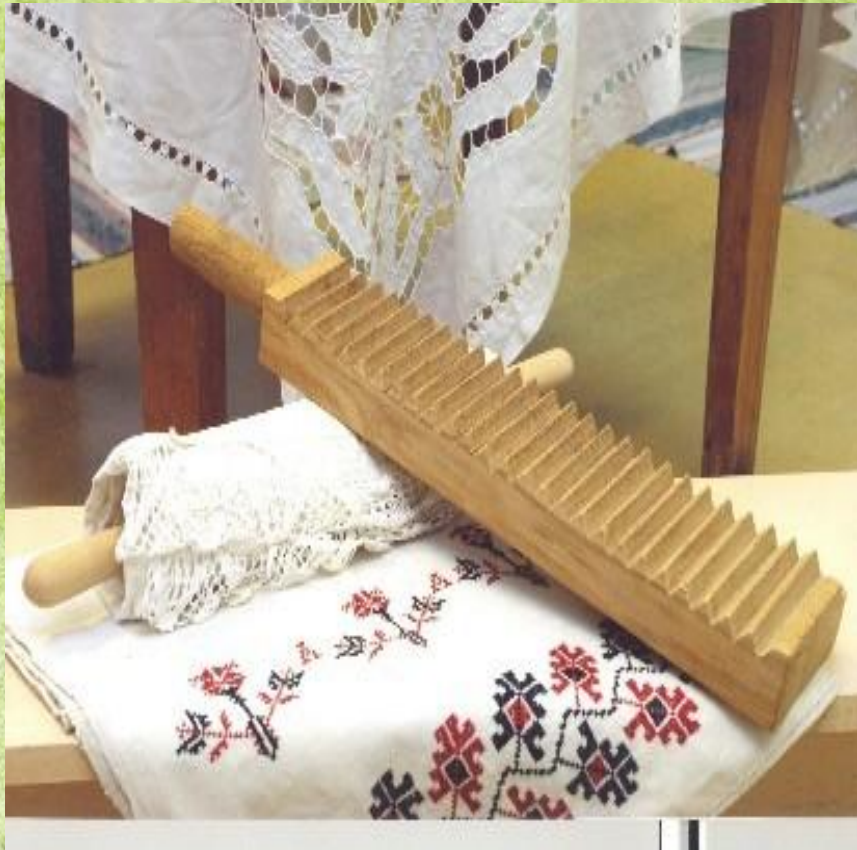
Рубель и валек