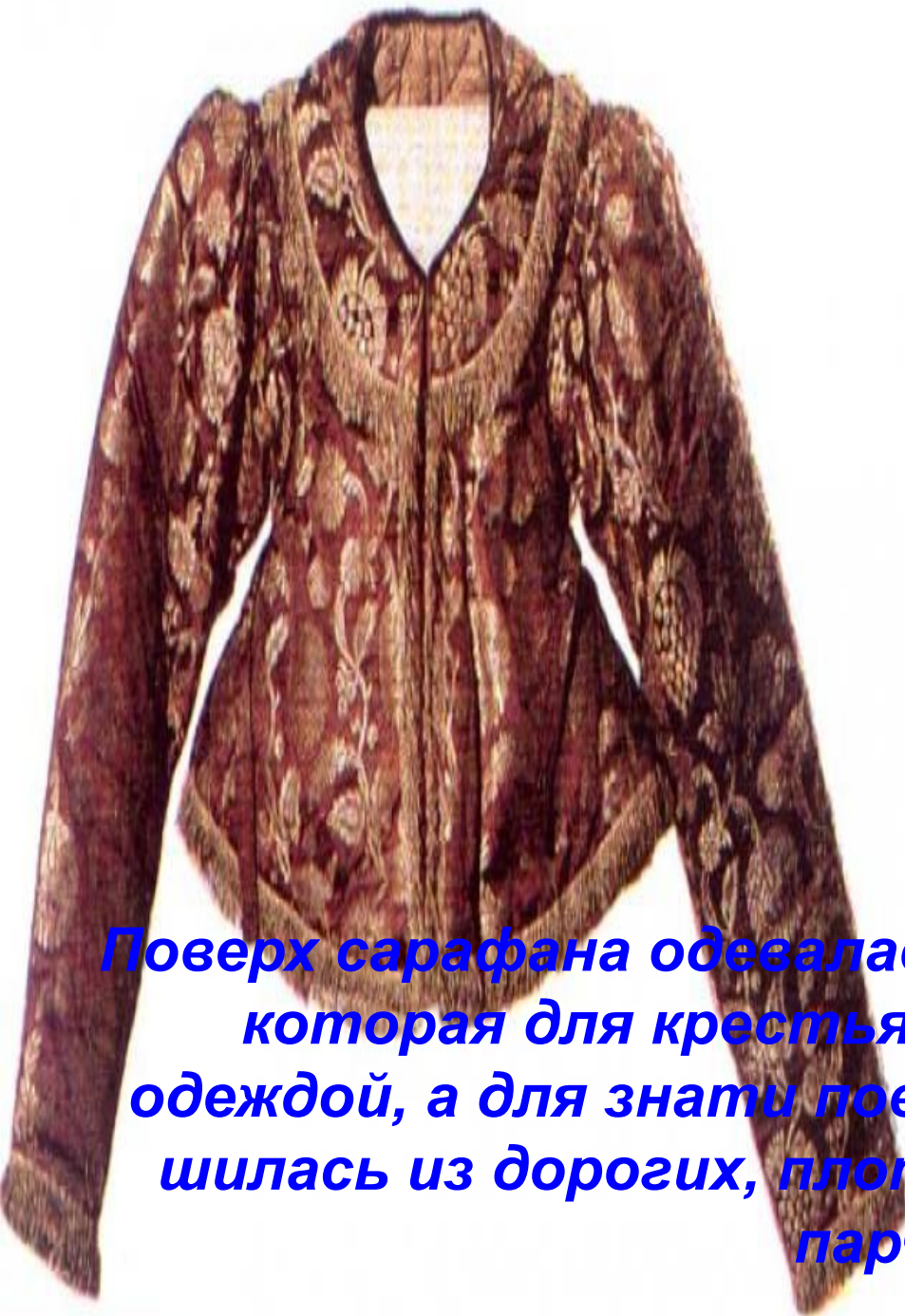
42. Праздничная одежда. Север России. Первая половина XIX в. Woman's festive clothes. Northern Russia, first half of the 19 th century