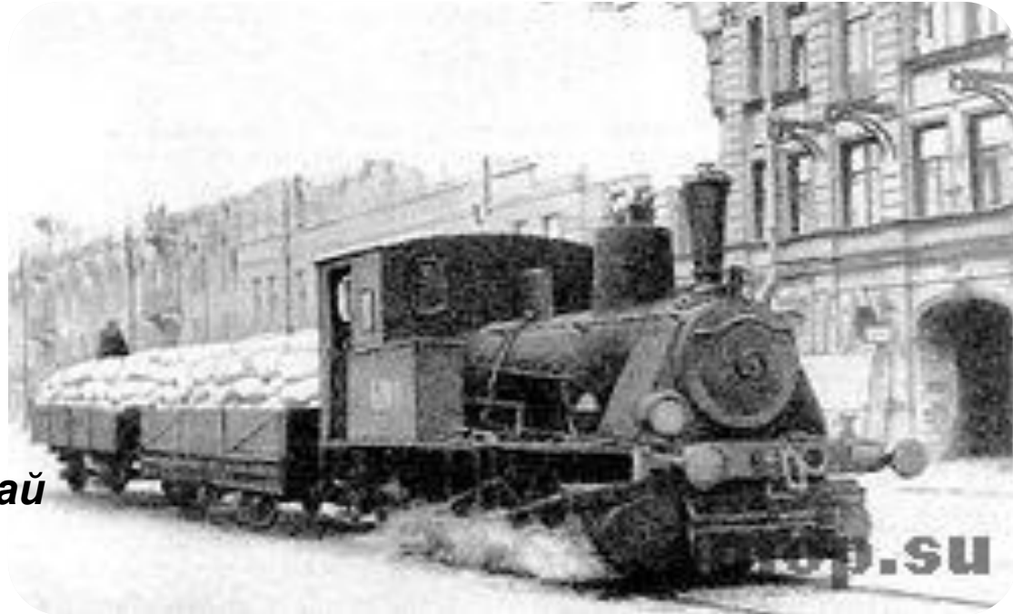
Локомотив - трамвай

Трасса проходит по району Ржевка — Пороховые от железнодорожной станции Ржевка по Рябовскому шоссе и шоссе Революции.