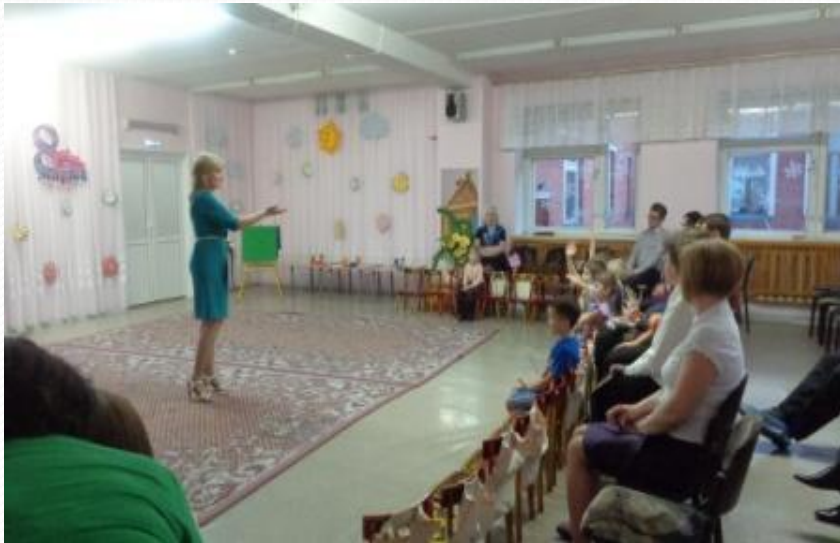
Беседа с детьми о зиме, зимних забавах.