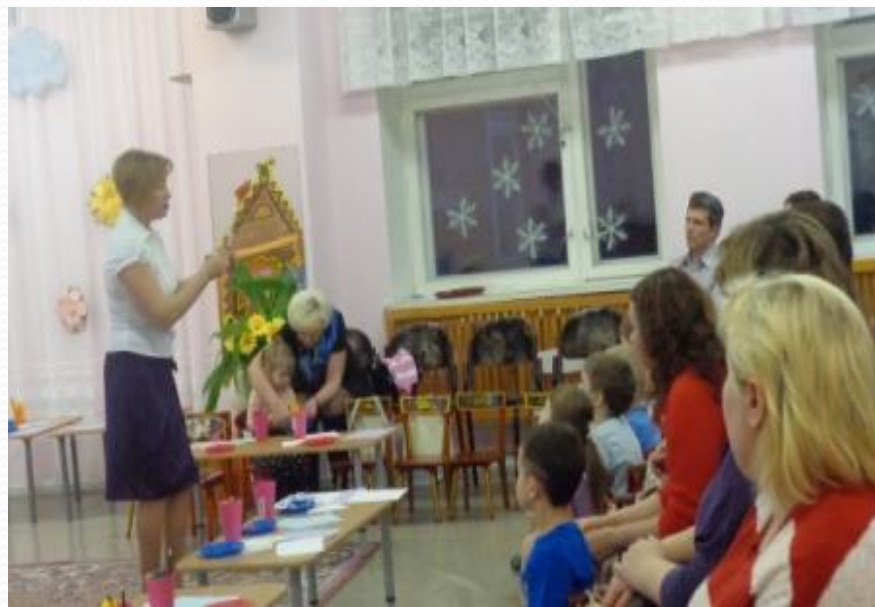
Показ способов изготовления.