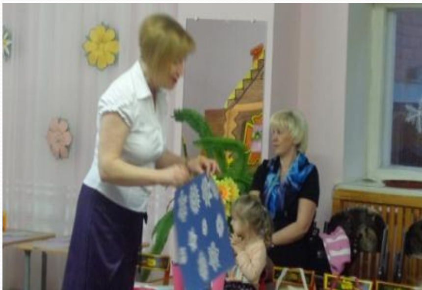
Рассматривание образцов снежинок.