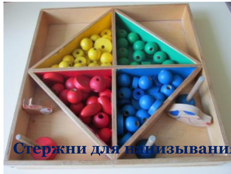
Стержни для нанизывания