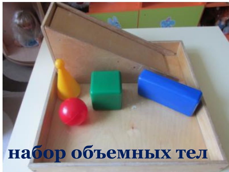
набор объемных тел