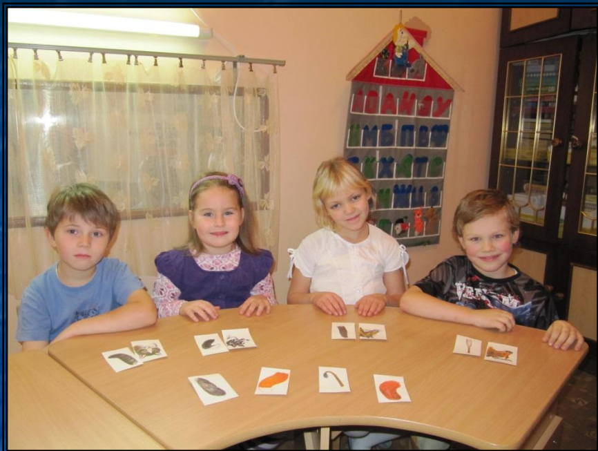
Игра: Чей хвост?