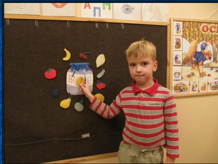
Игра: Что из чего?