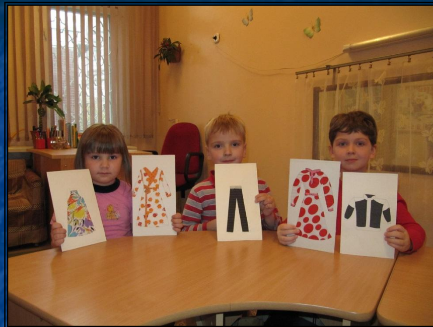
Игра: Что из чего?