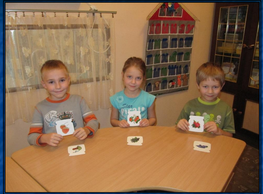
Игра: Какое варенье?