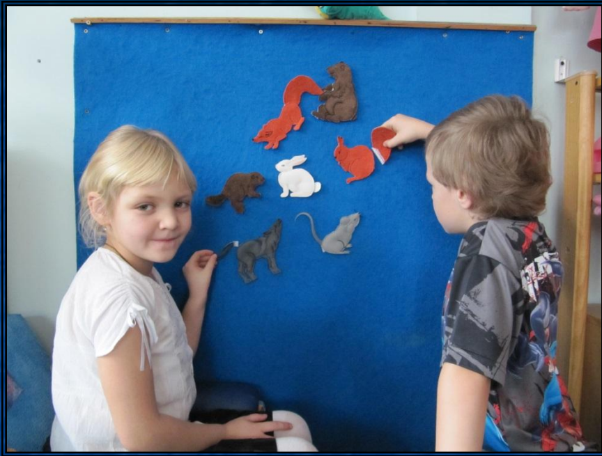
Игра: Чей хвост ?