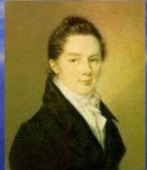
Иван Иванович Пуцин

Пушкин сохранил лицейскую дружбу и культ Лицея на всю жизнь.