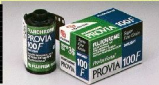
фотоплёнки и киноплёнку