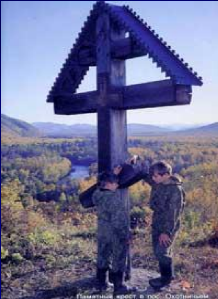
Памятный крест в пос. Охотничьем