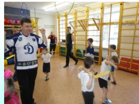
Спортивное развлечение – хоккейный матч «Большие и маленькие»