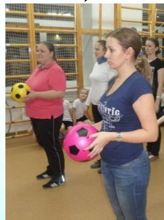
Соревнования с родителями