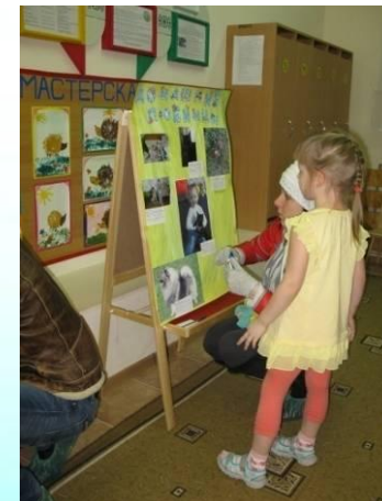
Оформление газеты «Домашние любимцы»