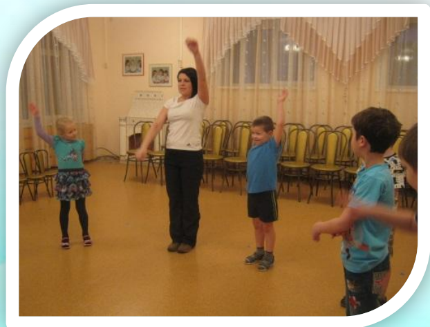
Утренняя гимнастика с родителями