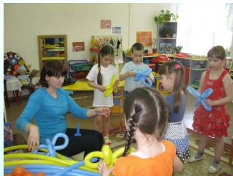
Мастер-класс «Игрушки из воздушных шаров»