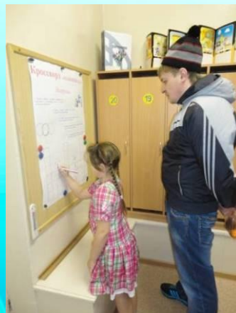
Заполнение кроссворда «Олимпиада»