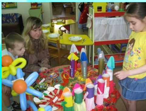
Презентация выставки «Игрушки-самоделки»