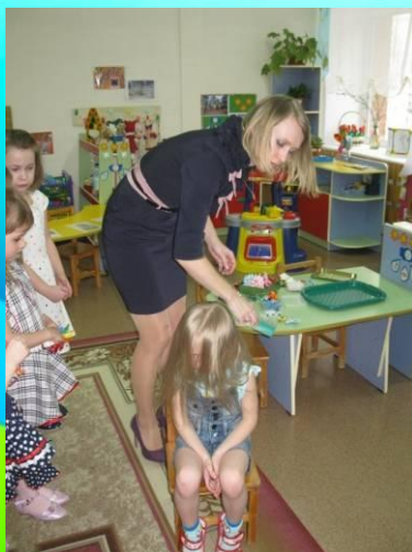
Мастер-класс по плетению косичек «Русские красавицы»