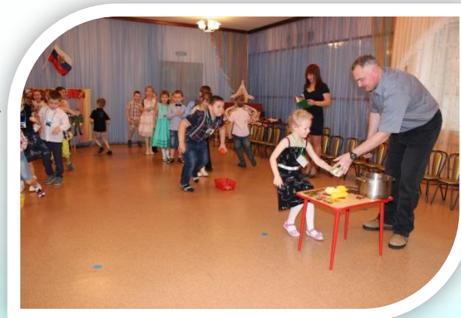
Совместный активный отдых