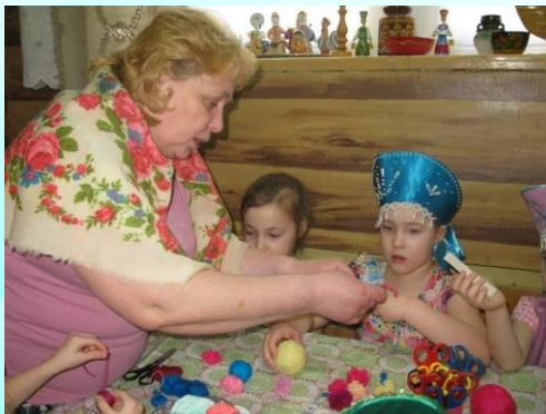
Досуг «Бабушкины посиделки»

Проект «Увлекательное путешествие Традиций из семьи в детский сад»