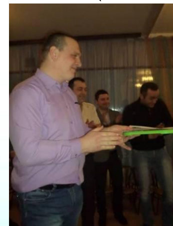
Викторина «Здоровье-наше все!»