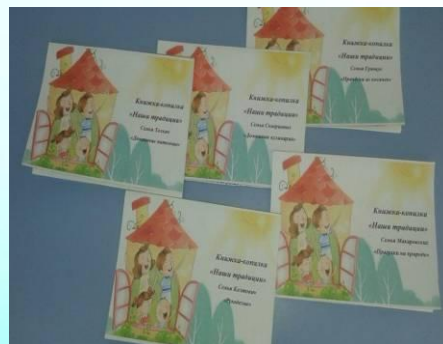
Оформление книжек-копилки «Наши традиции»