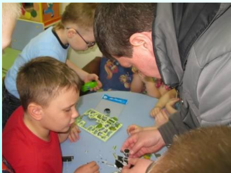
Досуг «Вместе собираем ЗД-конструкции»