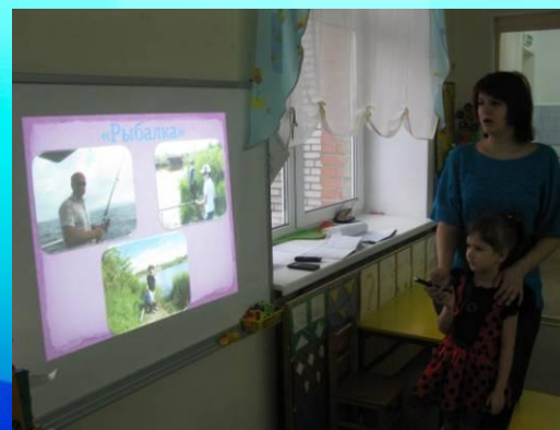
Развлечение с фотопрезентацией «Прогулки на природе»