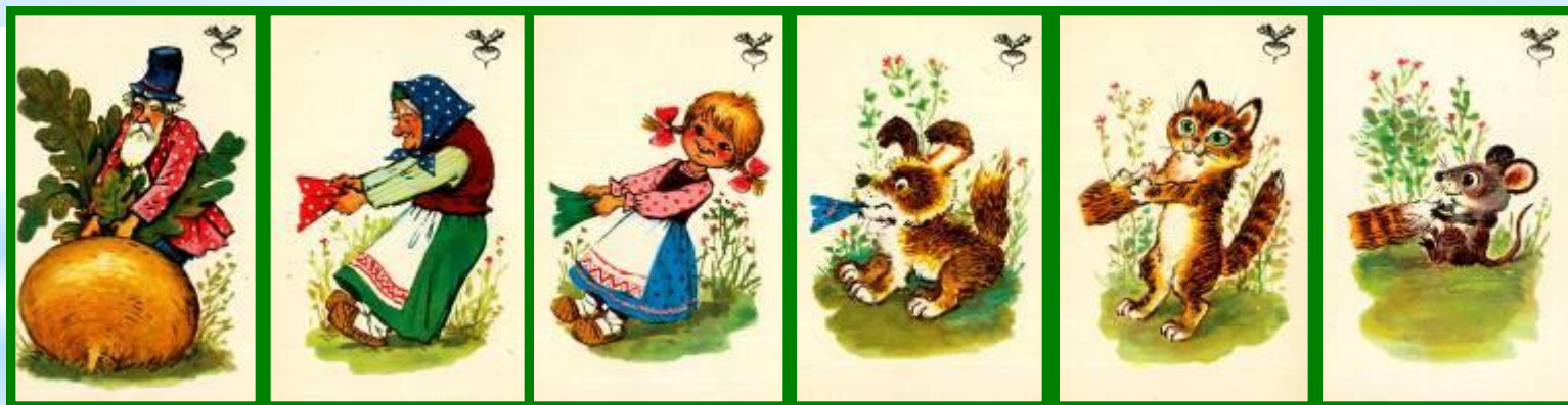
Дидактическая игра «Разложи по порядку».