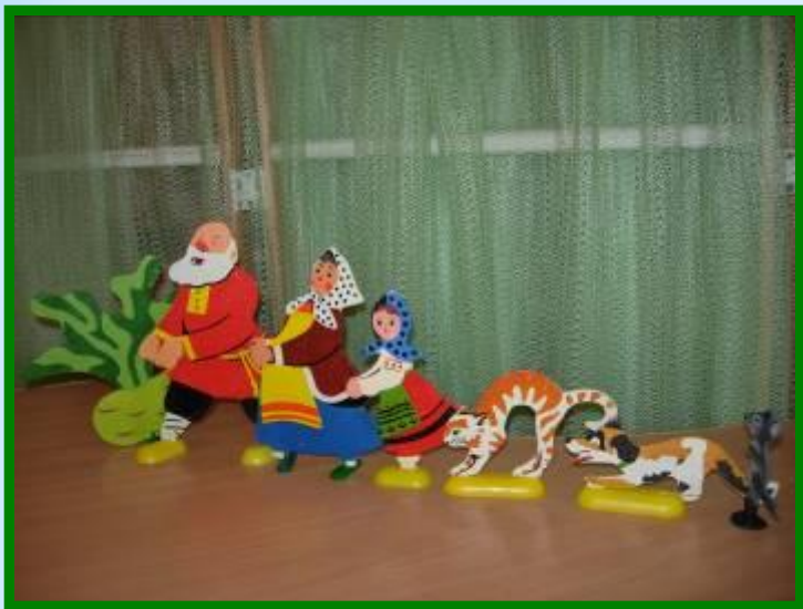
Настольный театр «Репка»