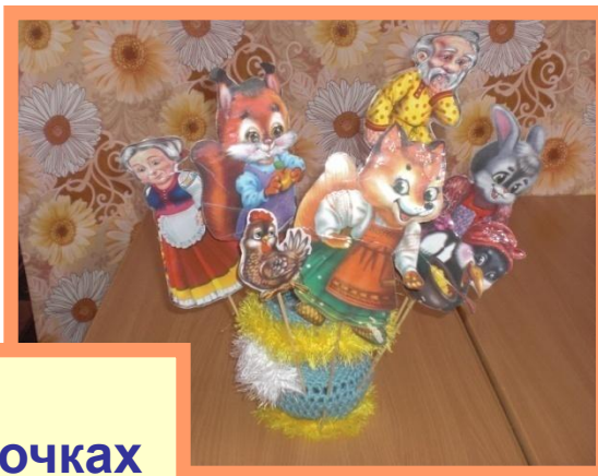
Театр на палочках