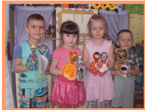
Театр на ложках