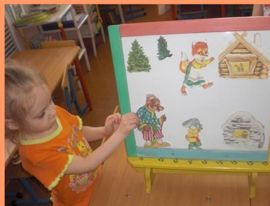
Театр на фланелеграфе