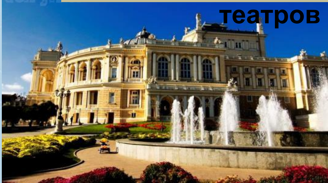
Одесский оперный театр