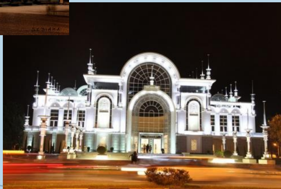
Оперный театр в Батуми