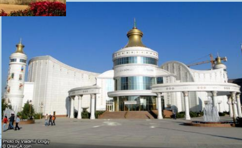
Туркменский оперный театр