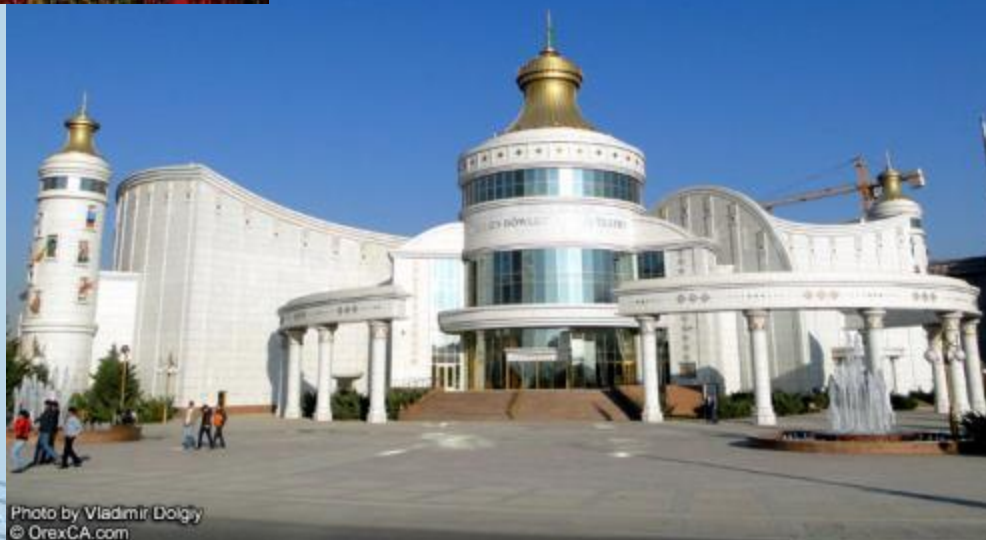
Туркменский оперный театр