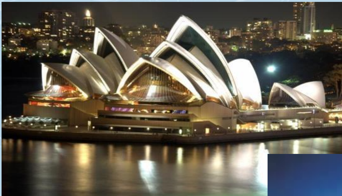
Оперный театр в Сиднее