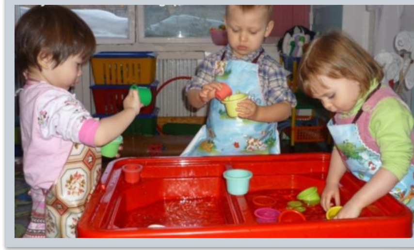
Элементарный бытовой труд