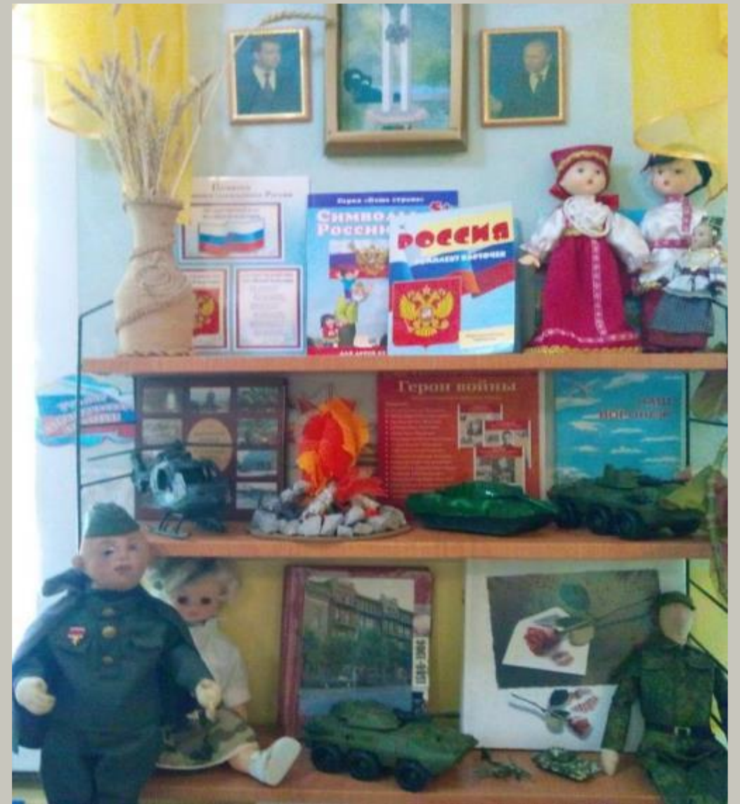
Рабочий сектор (модуль «Моя родина»).