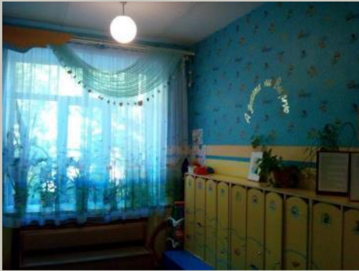
Верхняя левая точка.