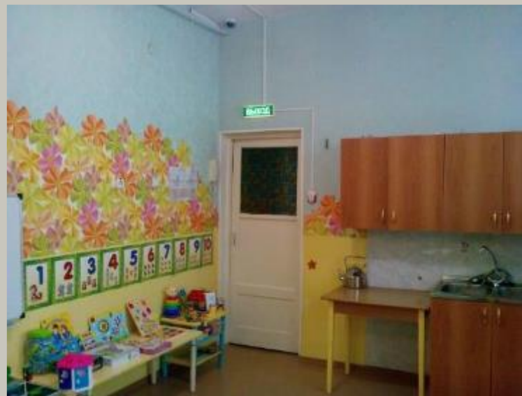
Вход в группу, нижняя правая точка