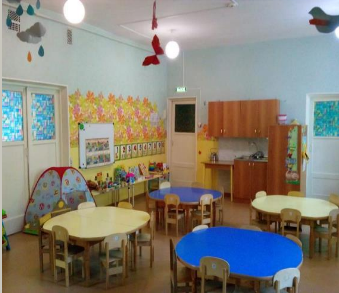
Вид из центра группы, на вход в помещение .