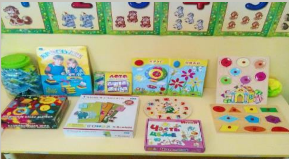
Модуль «Математическое развитие».