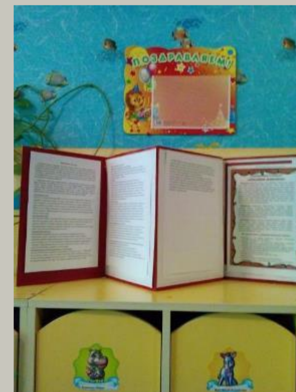
Информационный Блок. Рубрика «Поздравляем!»