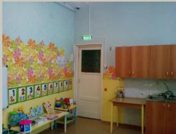
Вход в группу, нижняя правая точка