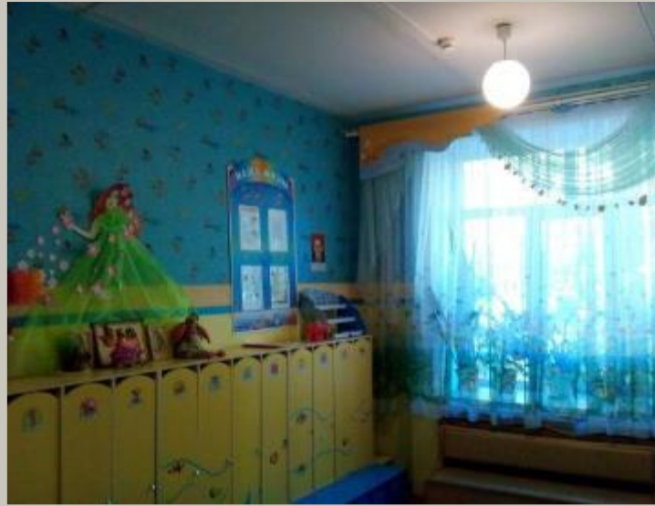
Верхняя правая точка.