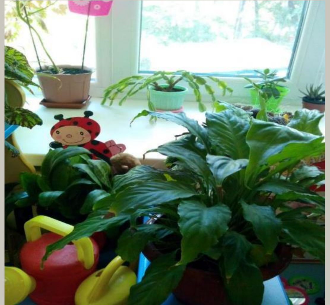
Рабочий сектор(модуль « Живая и неживая природа»).