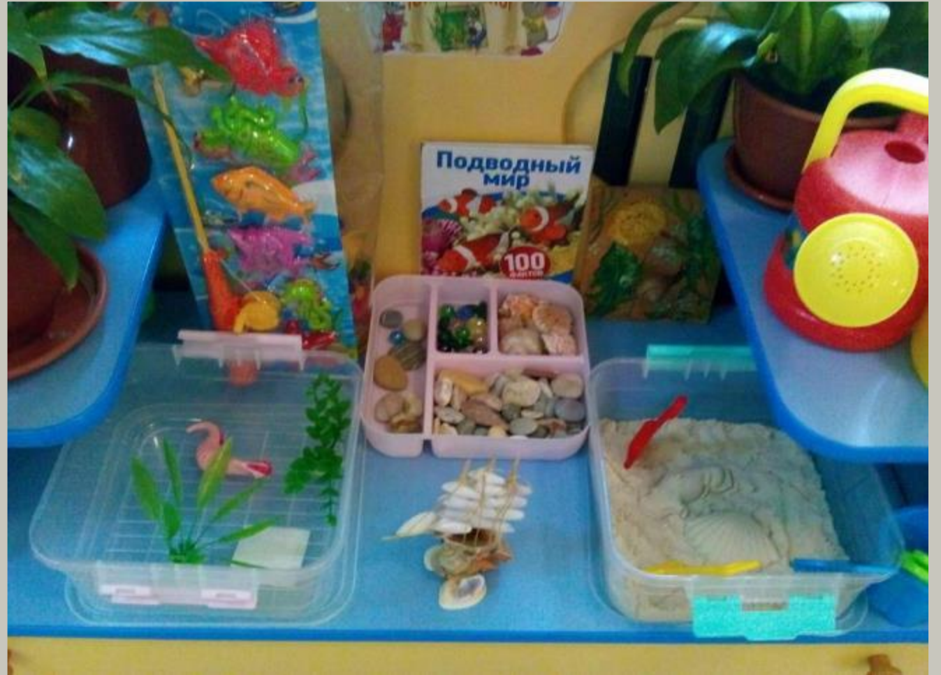
Модуль «Центр воды и песка».