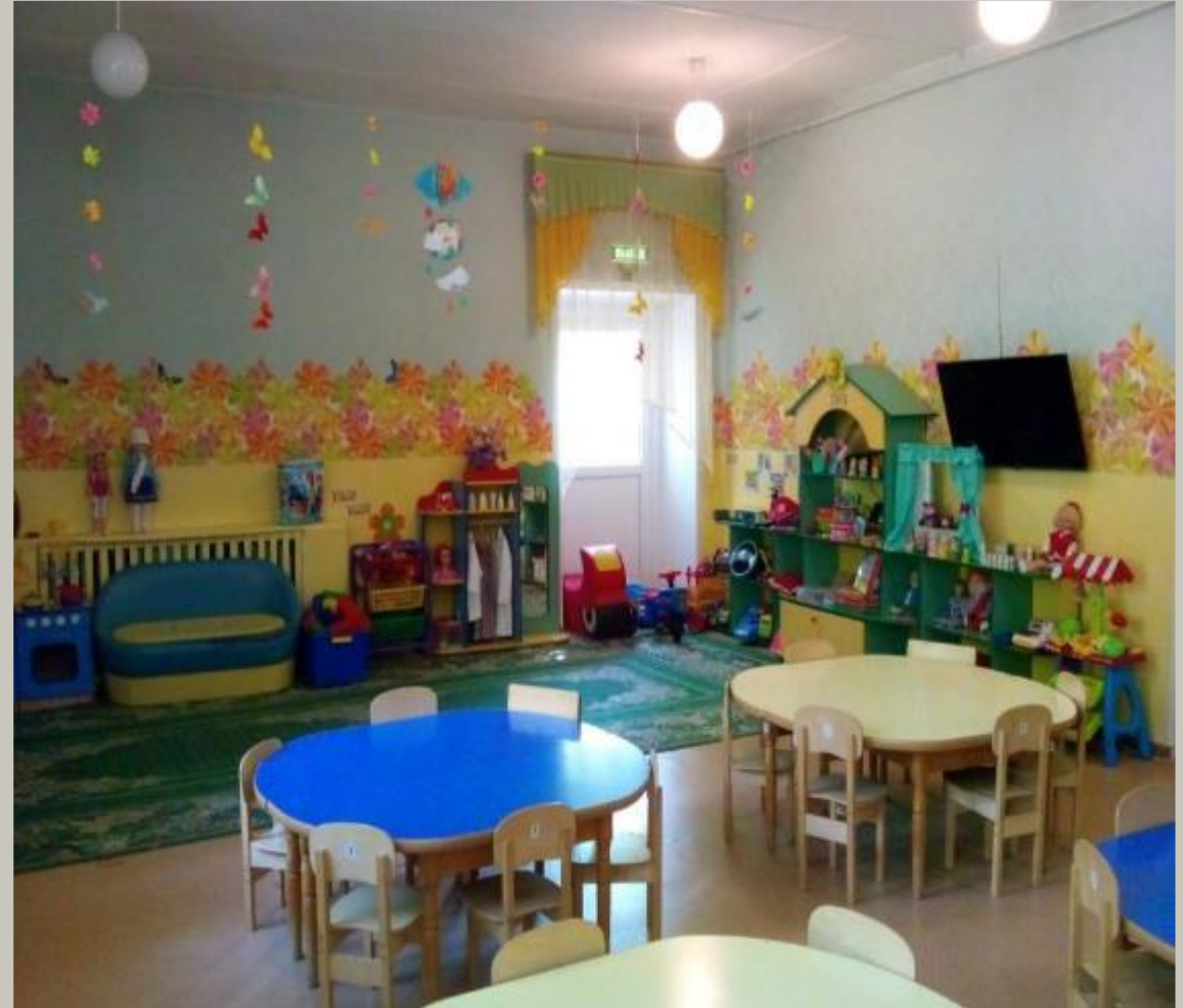
Вид из центра группы, в противоположном входу направлении.