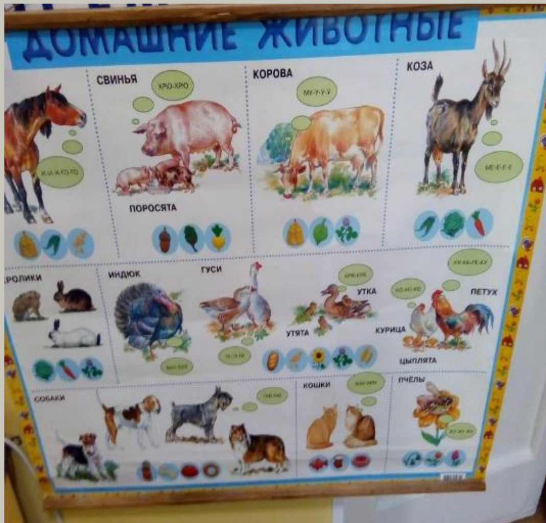
Рабочий сектор (хранение наглядного Материала).