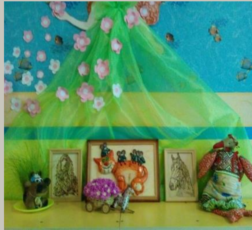
Практический блок (Совместное творчество детей и родителей).