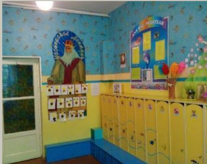
Нижняя правая точка.

Вид помещения (приёмная) с четырёх точек по периметру.