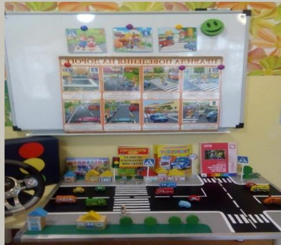
Активный сектор «Уголок безопасности на дороге».