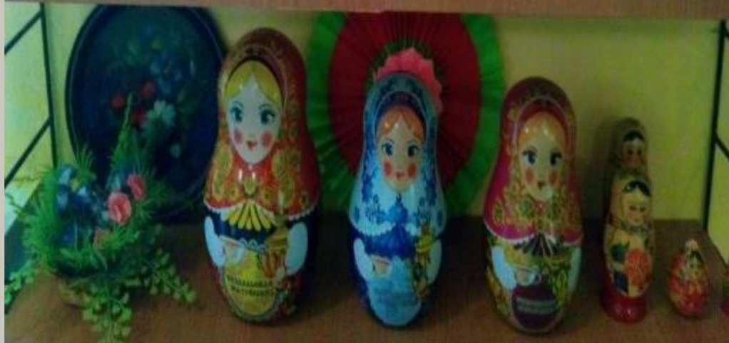
Рабочий сектор (модуль «Наследие культуры и соц. культурные ценности»).