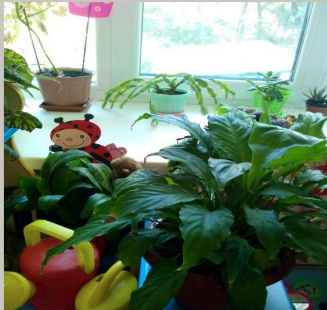
Рабочий сектор(модуль « Живая и неживая природа»).