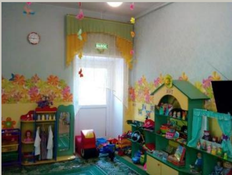
Нижняя левая точка