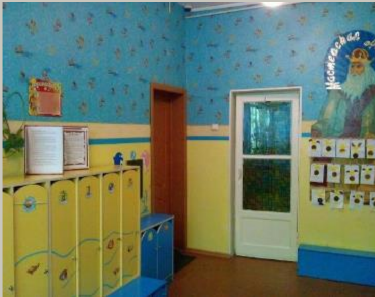
Вход в группу, нижняя левая точка.