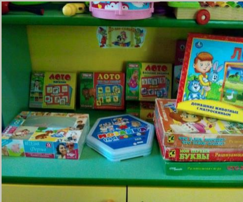
Активный сектор Дидактические игры с правилами.