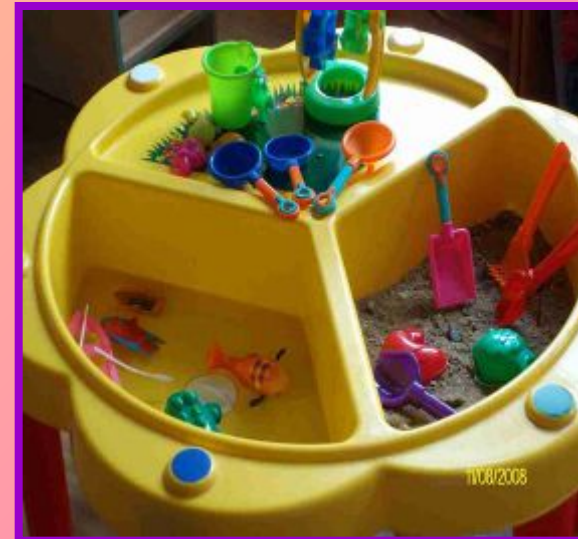
Дидактический стол для игр с песком и водой