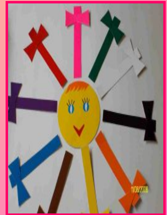
Д/И «Нарядим солнышко»