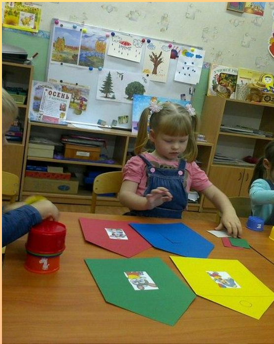
Д/и «Спрячь зайку»