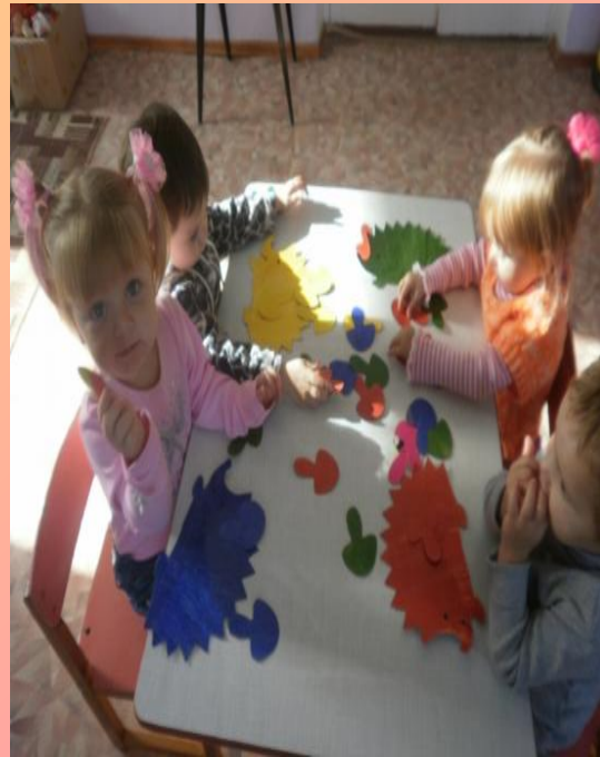
Д/и «Цветные ежики»