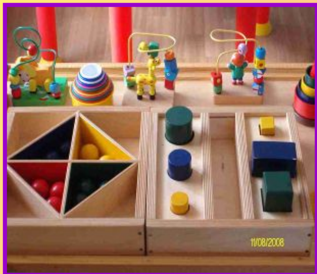
Дидактический стол по сенсорике