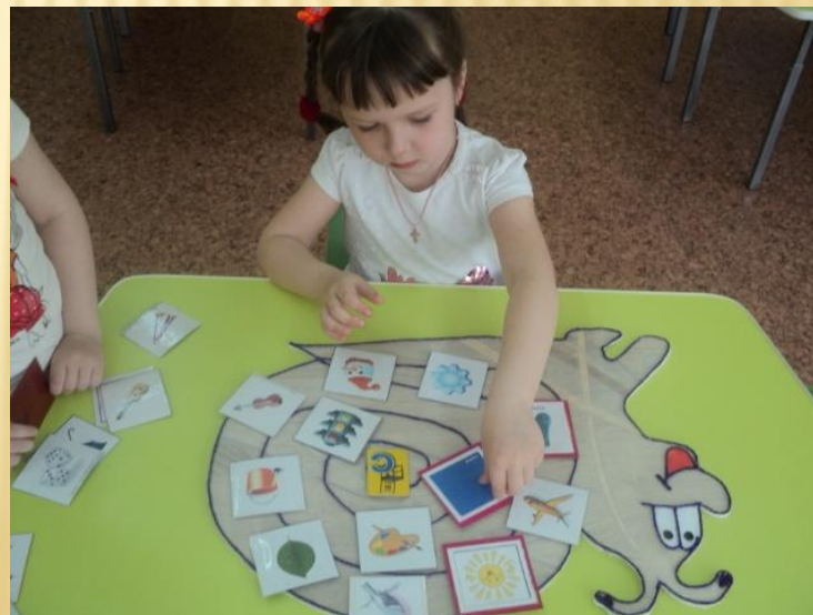
«Где живет звук»