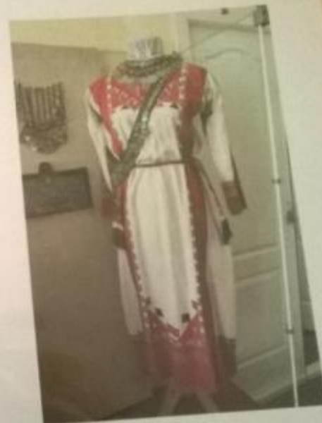
Чувашский национальный костюм