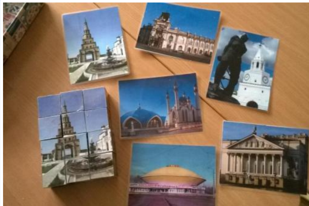
Кубики «достопримечательности Казани»