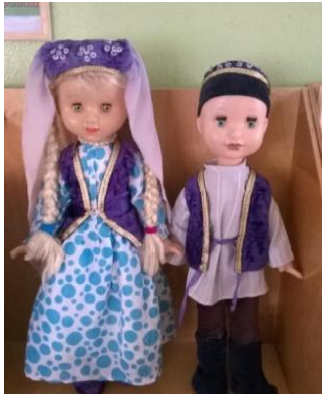
Куклы в национальном костюме- татарский