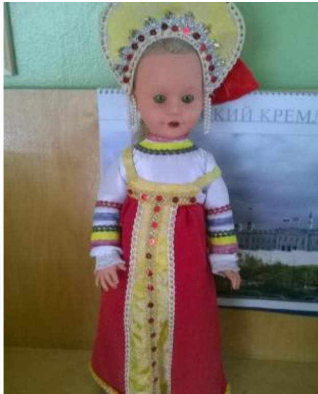
Куклы в национальном костюме- русский