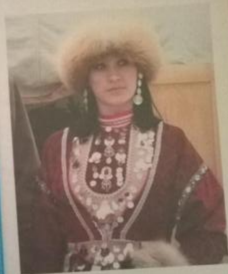
Башкирский национальный костюм