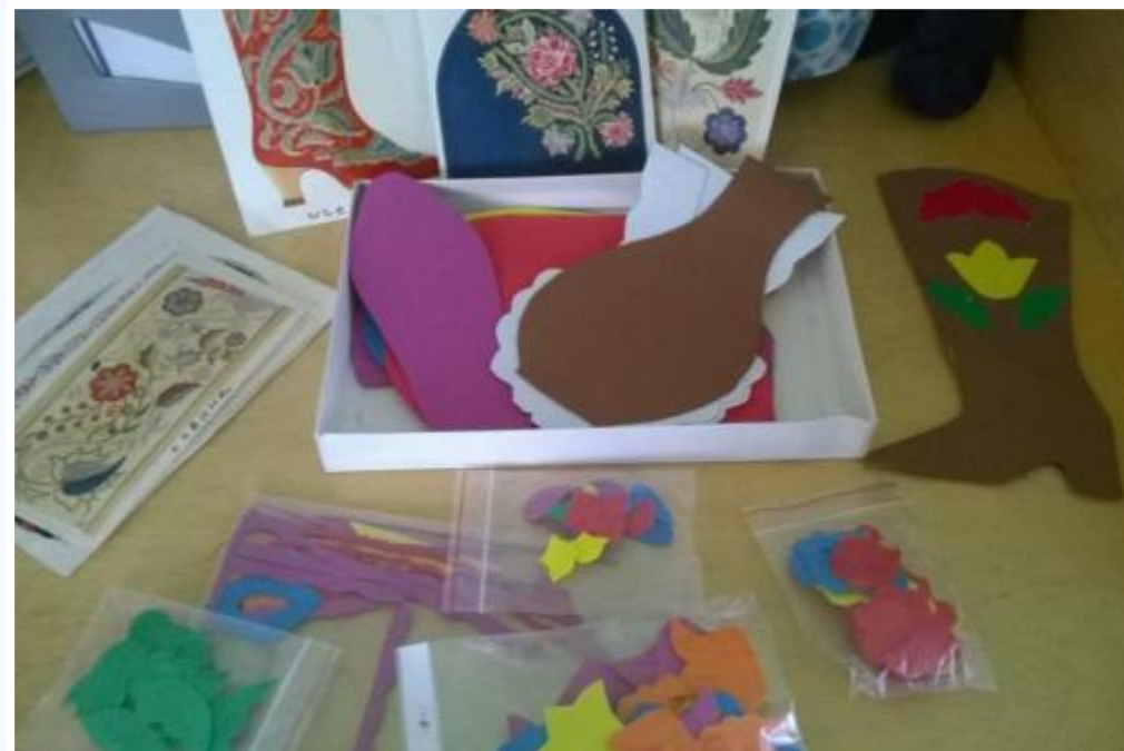
Составь узор на: сапоге, тубетейке, калфаке, фартуке, вазе.