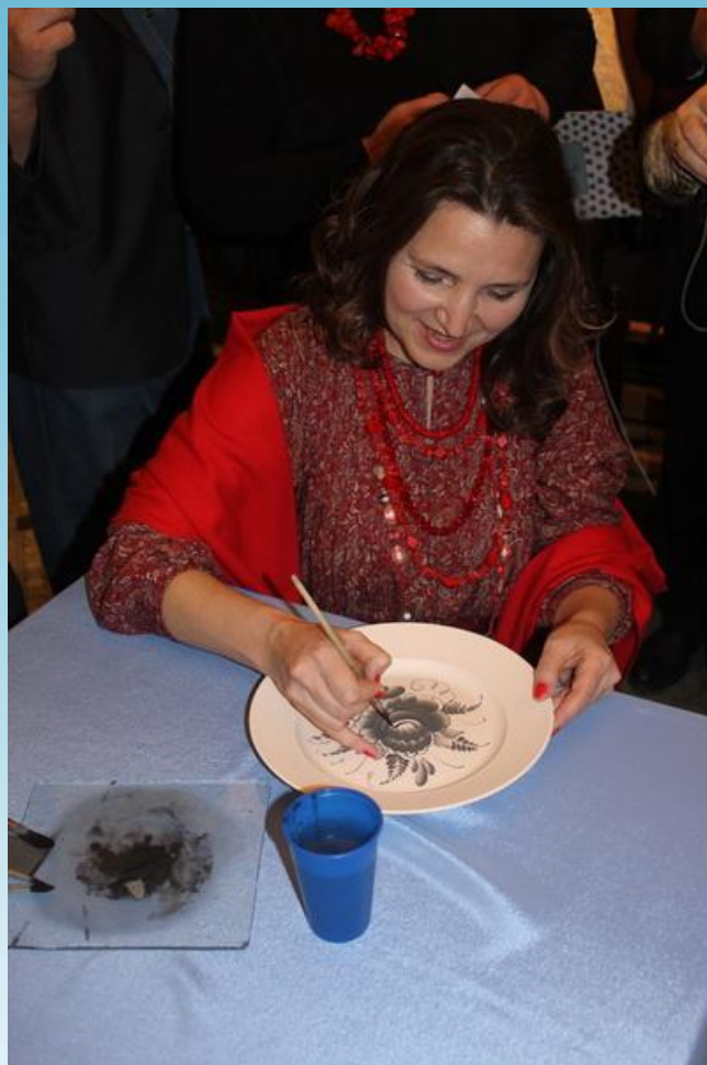
Мастерица за работой.