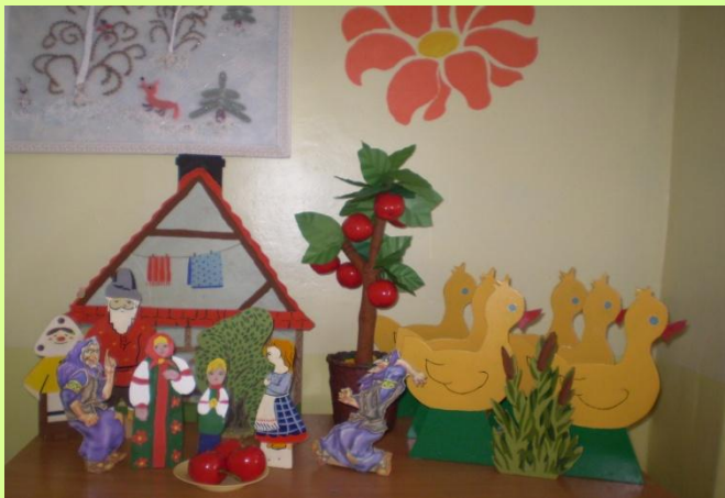
«Настольный театр» Сказка «Гуси лебеди»