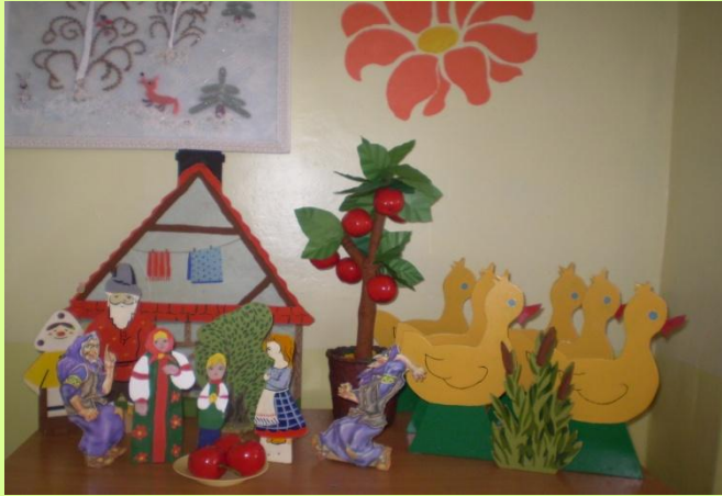
«Настольный театр» Сказка «Гуси лебеди»