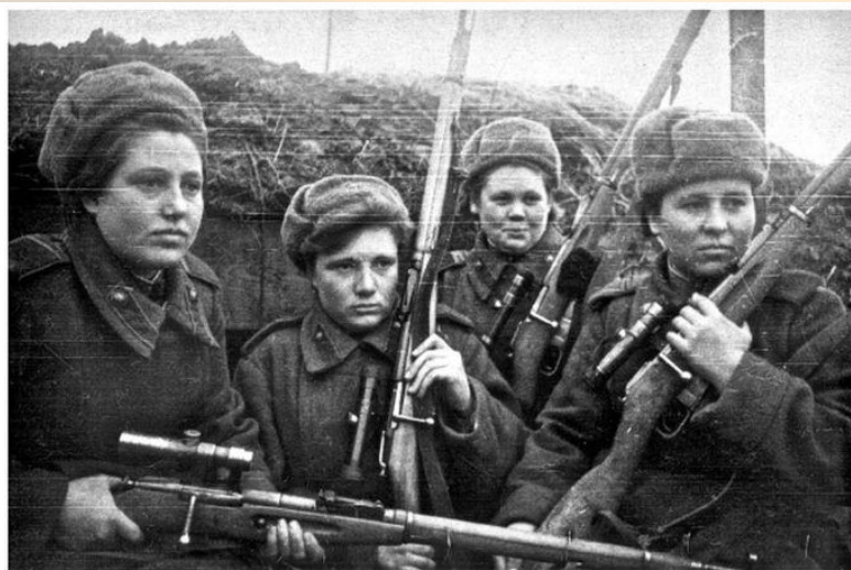
Женщины - снайперы

На фронт уходили не только мужчины, но и женщины и даже подростки