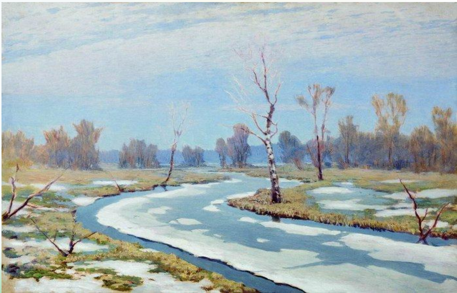
А. Куинджи «Ранняя весна»