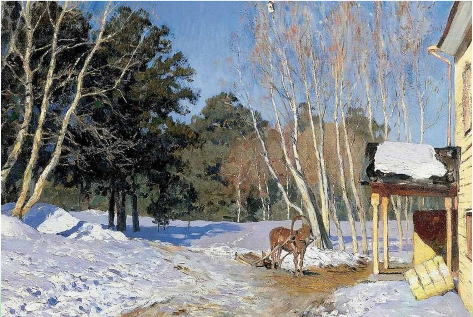
И. Левитан «Март»