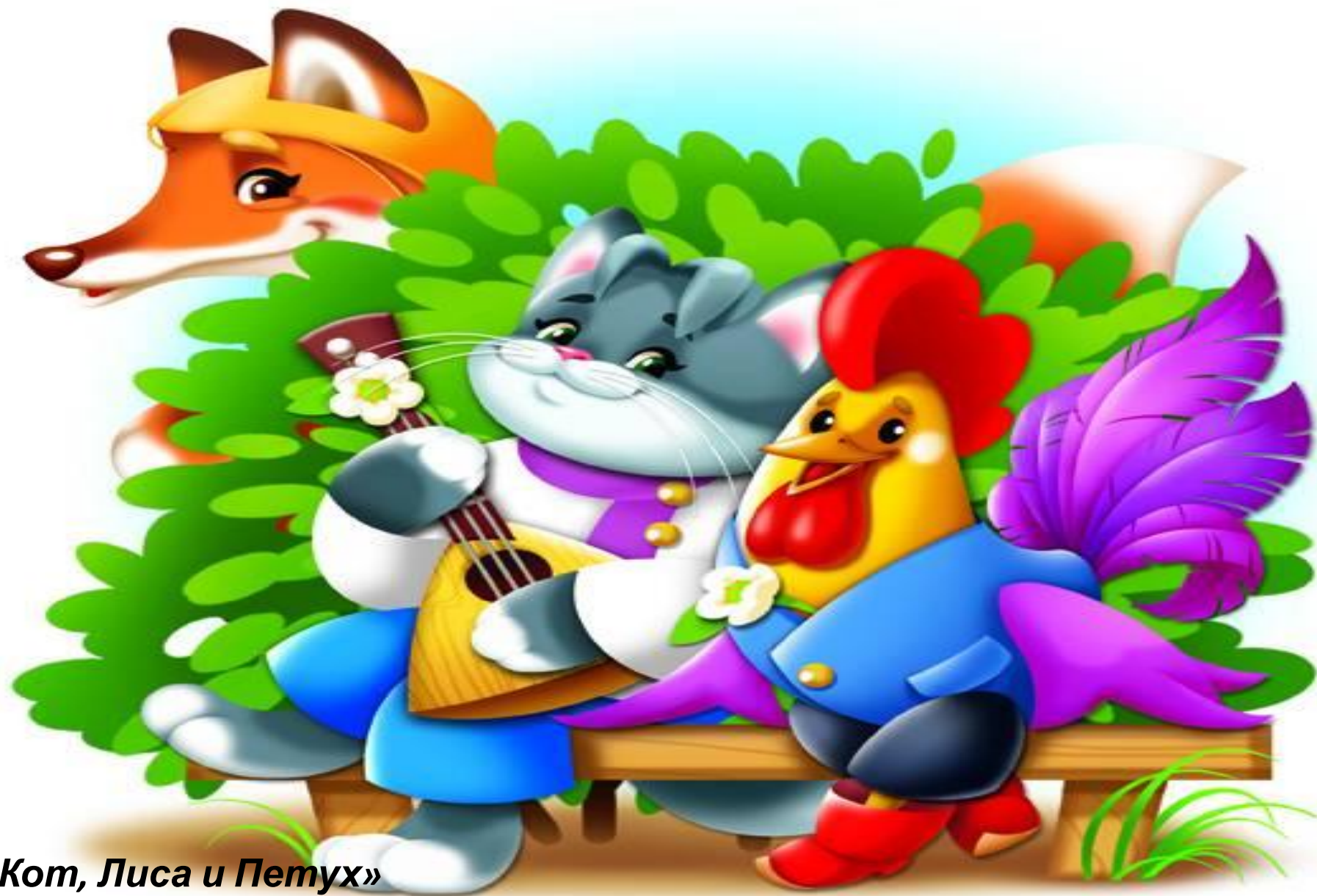
«Кот, Лиса и Петух»

Ой Лиса, Лиса, Лиса Хитрая плутовка. Пела песенку она очень, очень звонко: -Петушок, Петушок! Золотой гребешок. Выгляни в окошко, Дам тебе горошку.