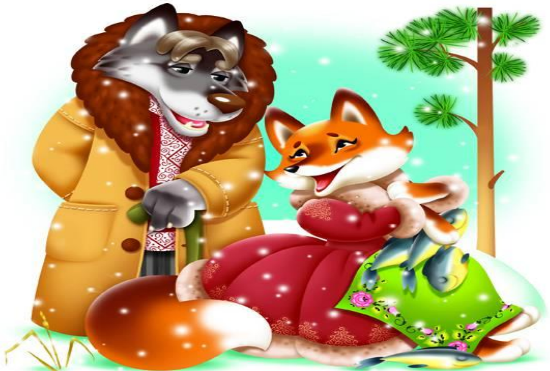
«Волк и лиса»

Эта ловкая плутовк а Посадил а в прорубь волка. А потом на нём каталас ь, Очень хитро ухмылял ась: «Битый небитог о везёт.»