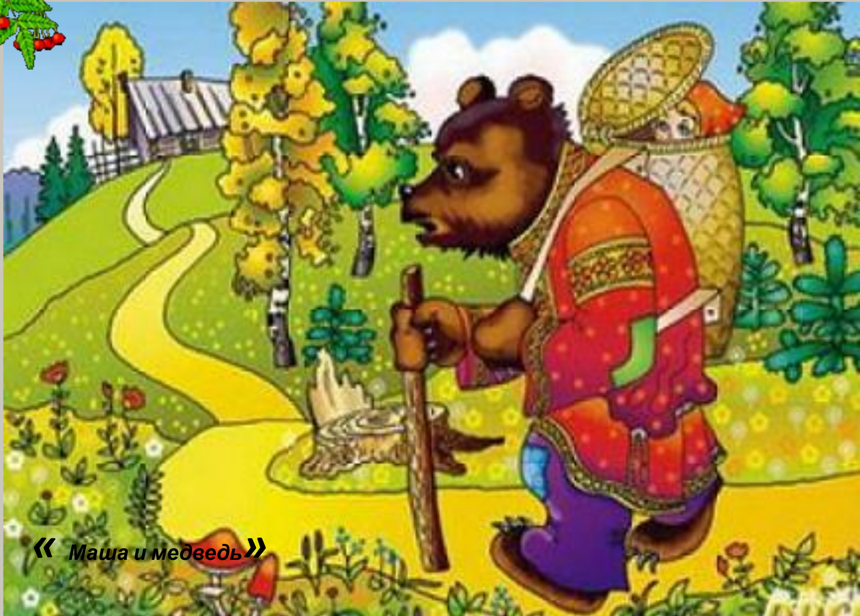
« Маша и медведь »

Отвечайте на вопрос: Кто в корзине Машу нёс Кто сажился на пенёк И хотел съесть пирожок? Сказочку ты знаешь ведь? Кто же это был?... медведь